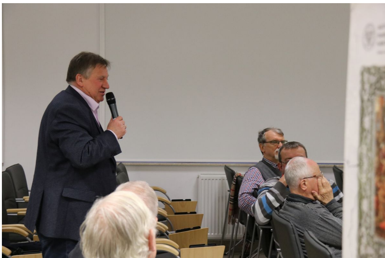
W siedzibie IPN Gdańsk 27 marca odbył się pokaz fabularyzowanego filmu dokumentalnego „Skazany na niepamięć”.