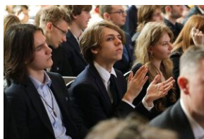
Finał 50. Olimpiady Historycznej – Gdańsk, 14 kwietnia 2024.