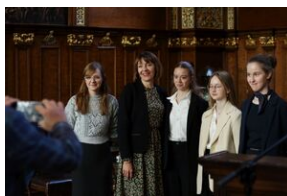
Finał 50. Olimpiady Historycznej – Gdańsk, 14 kwietnia 2024.