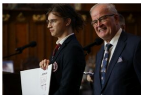
Finał 50. Olimpiady Historycznej – Gdańsk, 14 kwietnia 2024.