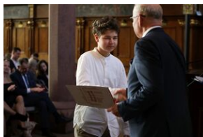
Finał 50. Olimpiady Historycznej – Gdańsk, 14 kwietnia 2024.