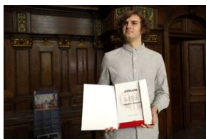
Finał 50. Olimpiady Historycznej – Gdańsk, 14 kwietnia 2024.