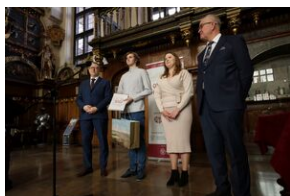
Finał 50. Olimpiady Historycznej – Gdańsk, 14 kwietnia 2024.

Warto podkreślić, że wielu uczniów biorących udział w Olimpiadzie z czasem dołącza do elity intelektualnej Polski – spośród olimpijczyków wywodzi się znaczny procent pracowników naukowych historii uczelni wyższych. Jest to jedno z najważniejszych wydarzeń historycznych organizowanych na terenie naszego kraju.