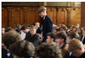
Finał 50. Olimpiady Historycznej – Gdańsk, 14 kwietnia 2024.