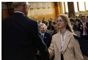
Finał 50. Olimpiady Historycznej – Gdańsk, 14 kwietnia 2024.