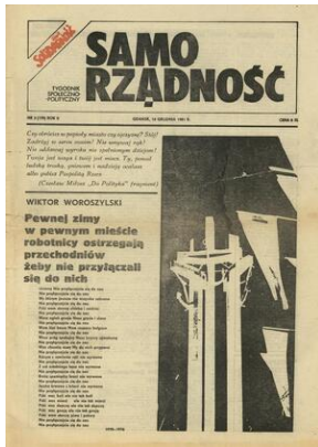
07.Samorządność nr 3 14-12-1981