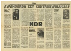
08.Samorządność - KOR