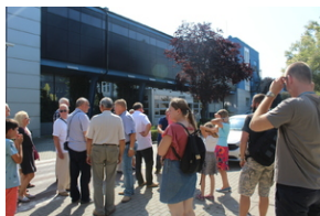
Śladami Sierpnia '80 w Gdyni #4