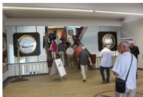
Śladami Sierpnia '80 w Gdyni #16