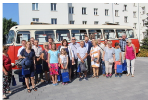
Śladami Sierpnia '80 w Gdyni #19