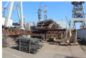
Śladami Sierpnia '80 w Gdyni #2