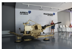
Śladami Sierpnia '80 w Gdyni #11