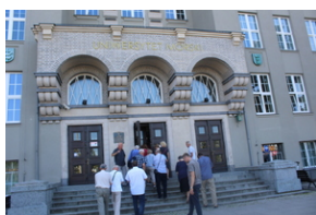
Śladami Sierpnia '80 w Gdyni #10