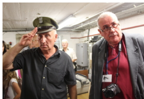
Śladami Sierpnia '80 w Gdyni #3