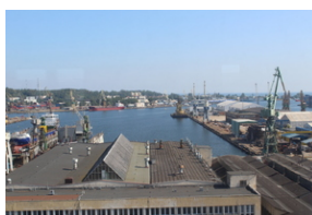
Śladami Sierpnia '80 w Gdyni #15