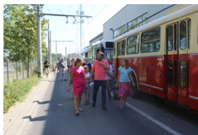
Śladami Sierpnia '80 w Gdyni #9