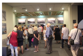
Śladami Sierpnia '80 w Gdyni #14