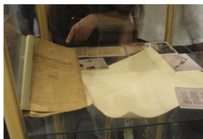
Śladami Sierpnia '80 w Gdyni #6