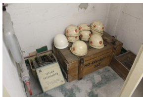
Śladami Sierpnia '80 w Gdyni #17