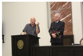
Śladami Sierpnia '80 w Gdyni #8