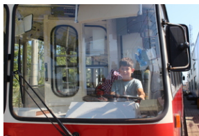
Śladami Sierpnia '80 w Gdyni #21