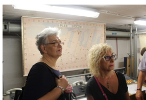
Śladami Sierpnia '80 w Gdyni #12