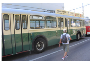
Śladami Sierpnia '80 w Gdyni #13