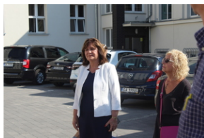
Śladami Sierpnia '80 w Gdyni #20