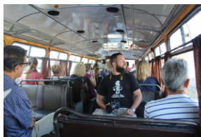
Śladami Sierpnia '80 w Gdyni #18