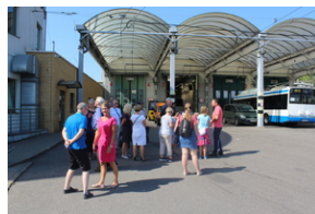
Śladami Sierpnia '80 w Gdyni #5