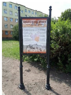
Tablica „Genocidium Atroux” w Grudziądzu