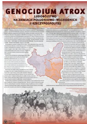
Tablica przygotowana przez IPN Oddział w Gdańsku