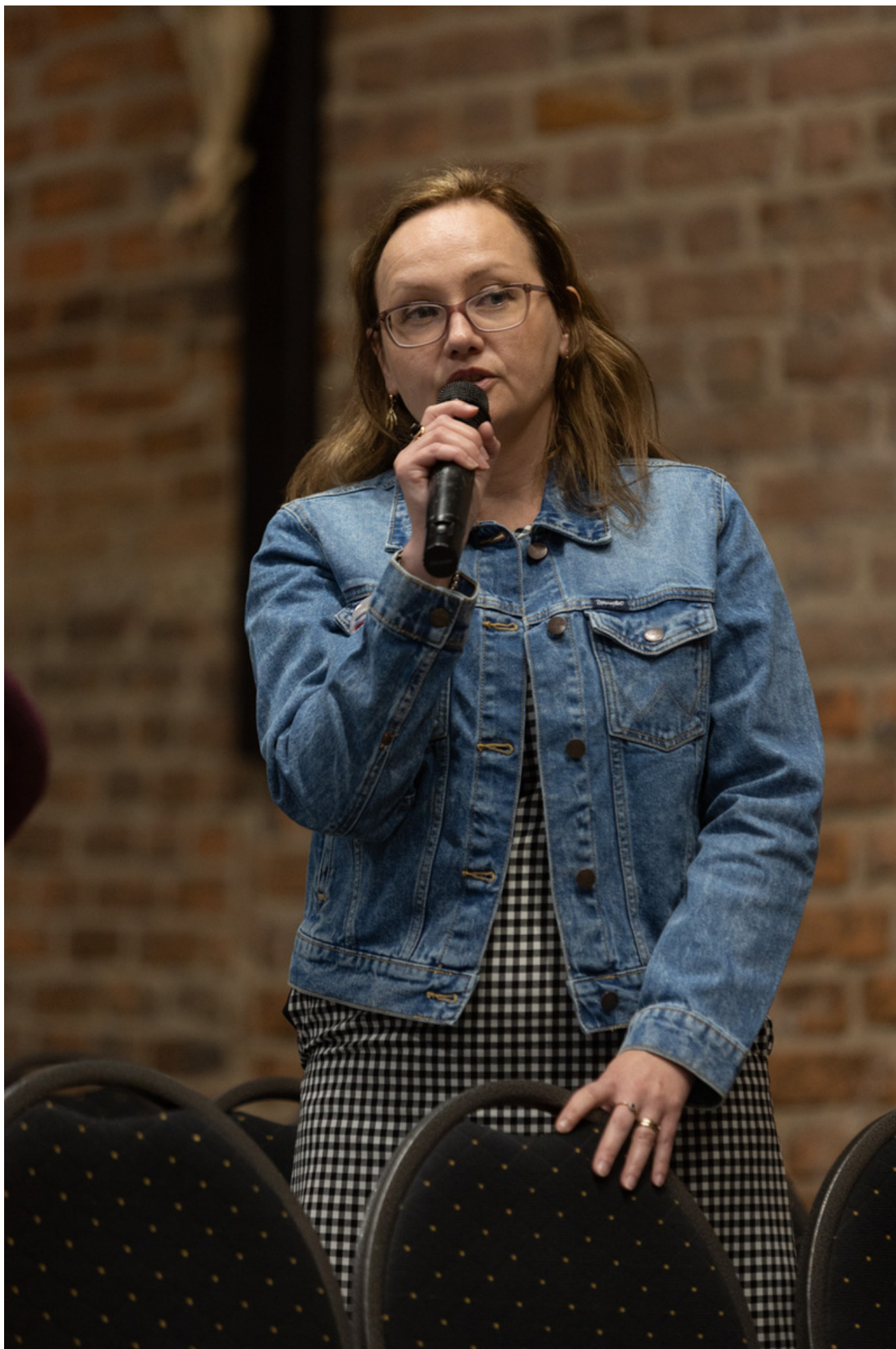
Promocja książki Bartosza Januszewskiego „Nie tylko Wołyń. Polacy i Ukraińcy - krótka historia najtrudniejszego