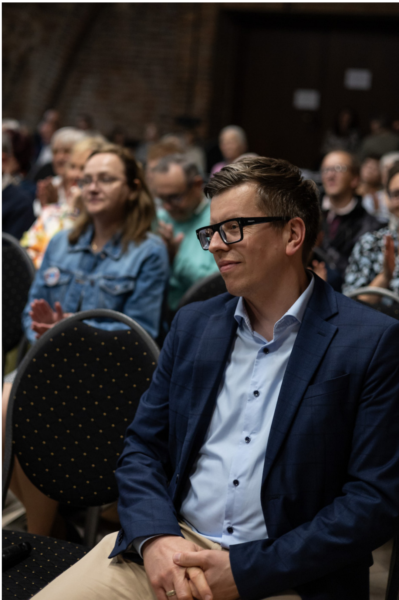
Promocja książki Bartosza Januszewskiego „Nie tylko Wołyń. Polacy i Ukraińcy - krótka historia najtrudniejszego