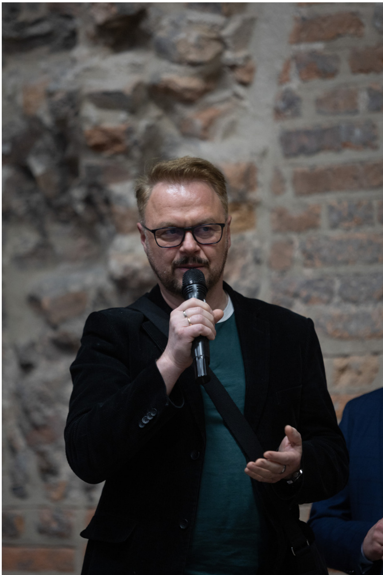
Promocja książki Bartosza Januszewskiego „Nie tylko Wołyń. Polacy i Ukraińcy - krótka historia najtrudniejszego