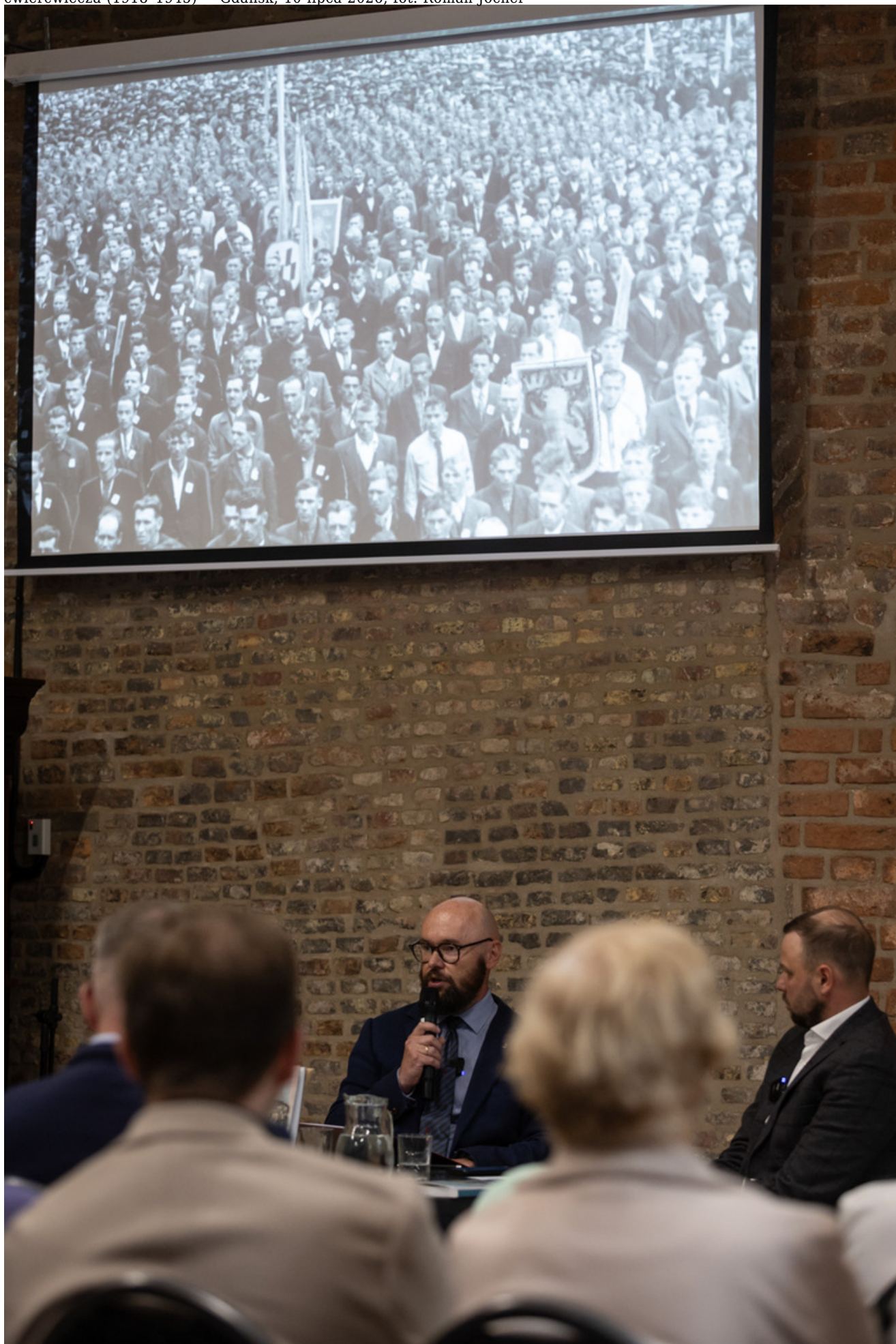
“ćwierćwiecza (1918-1945)” - Gdańsk, 10 lipca 2026