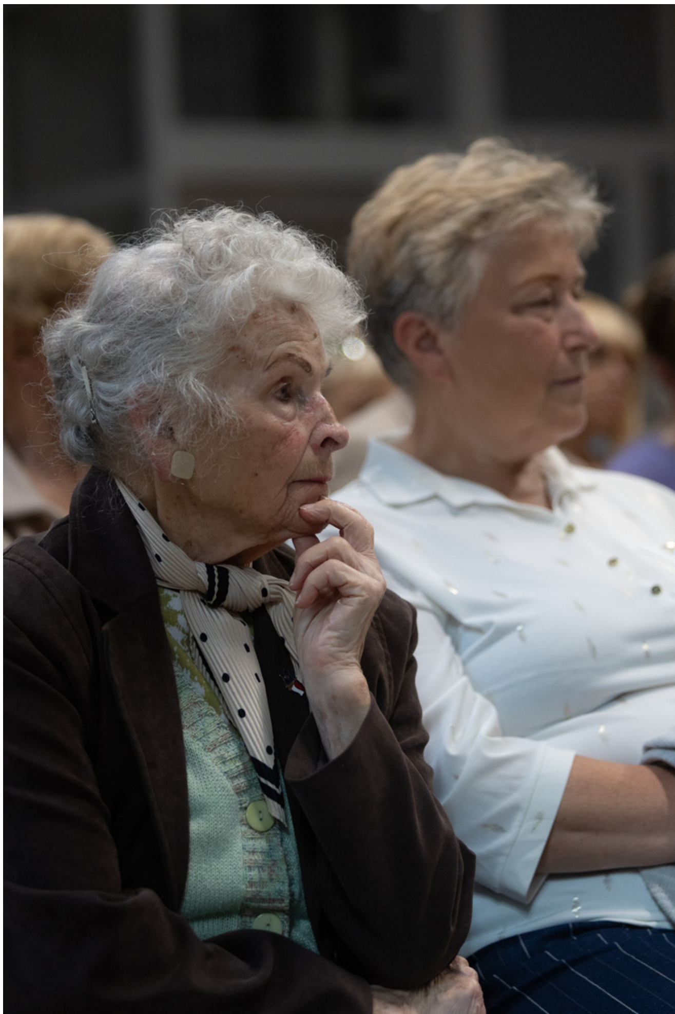
Promocja książki Bartosza Januszewskiego „Nie tylko Wołyń. Polacy i Ukraińcy - krótka historia najtrudniejszego