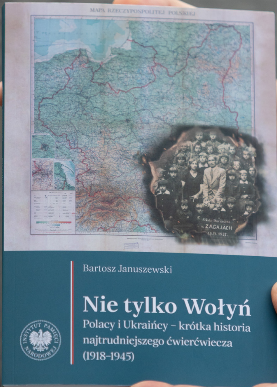
Promocja książki Bartosza Januszewskiego „Nie tylko Wołyń. Polacy i Ukraińcy - krótka historia najtrudniejszego