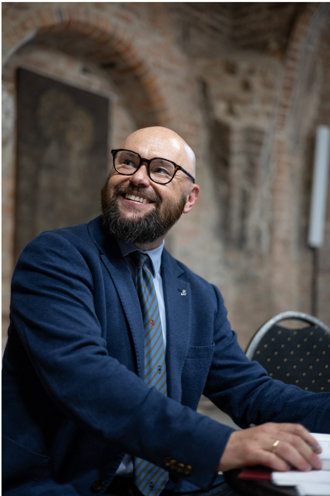
Promocja książki Bartosza Januszewskiego „Nie tylko Wołyń. Polacy i Ukraińcy - krótka historia najtrudniejszego