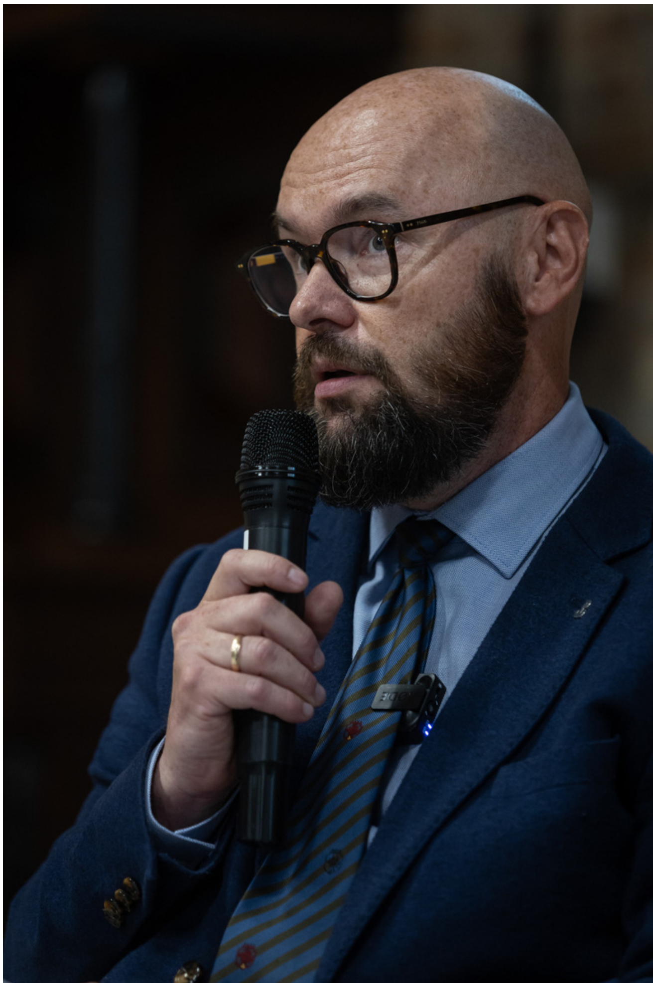
Promocja książki Bartosza Januszewskiego „Nie tylko Wołyń. Polacy i Ukraińcy - krótka historia najtrudniejszego