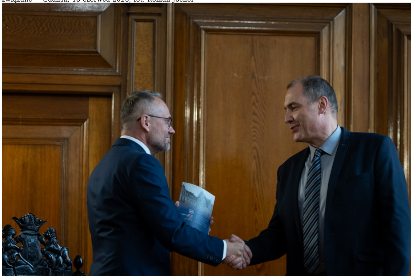
Promocja publikacji „Niezwykła historia zwykłych obiektów. Budynek Sądu Okręgowego w Gdańsku i osoby z nim związane” - Gdańsk, 18 czerwca 2026