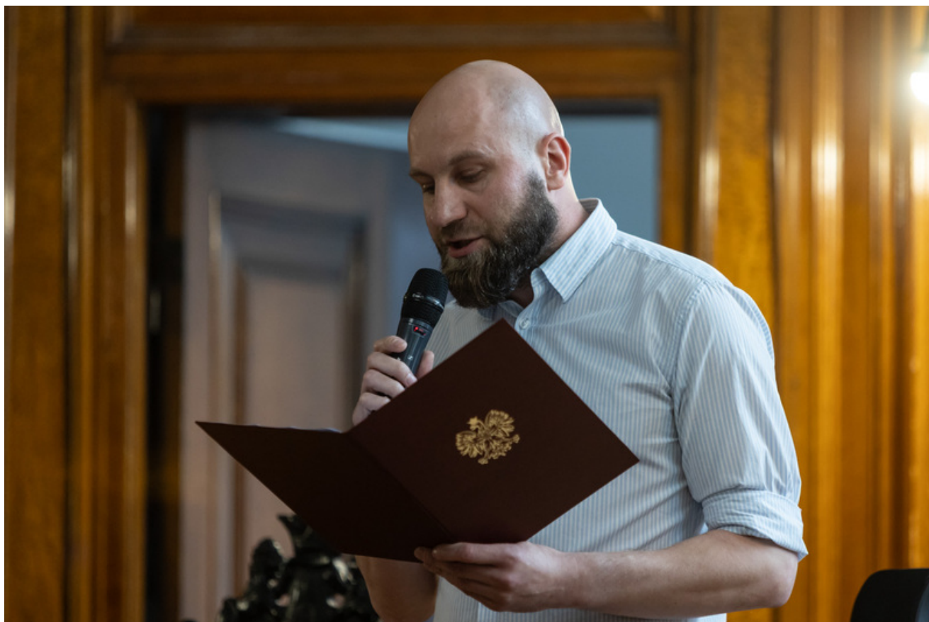
Promocja publikacji „Niezwyczajna historia zwykłych obiektów. Budynek Sądu Okręgowego w Gdańsku i osoby z nim związane” - Gdańsk, 18 czerwca 2026, fot. Roman Jocher