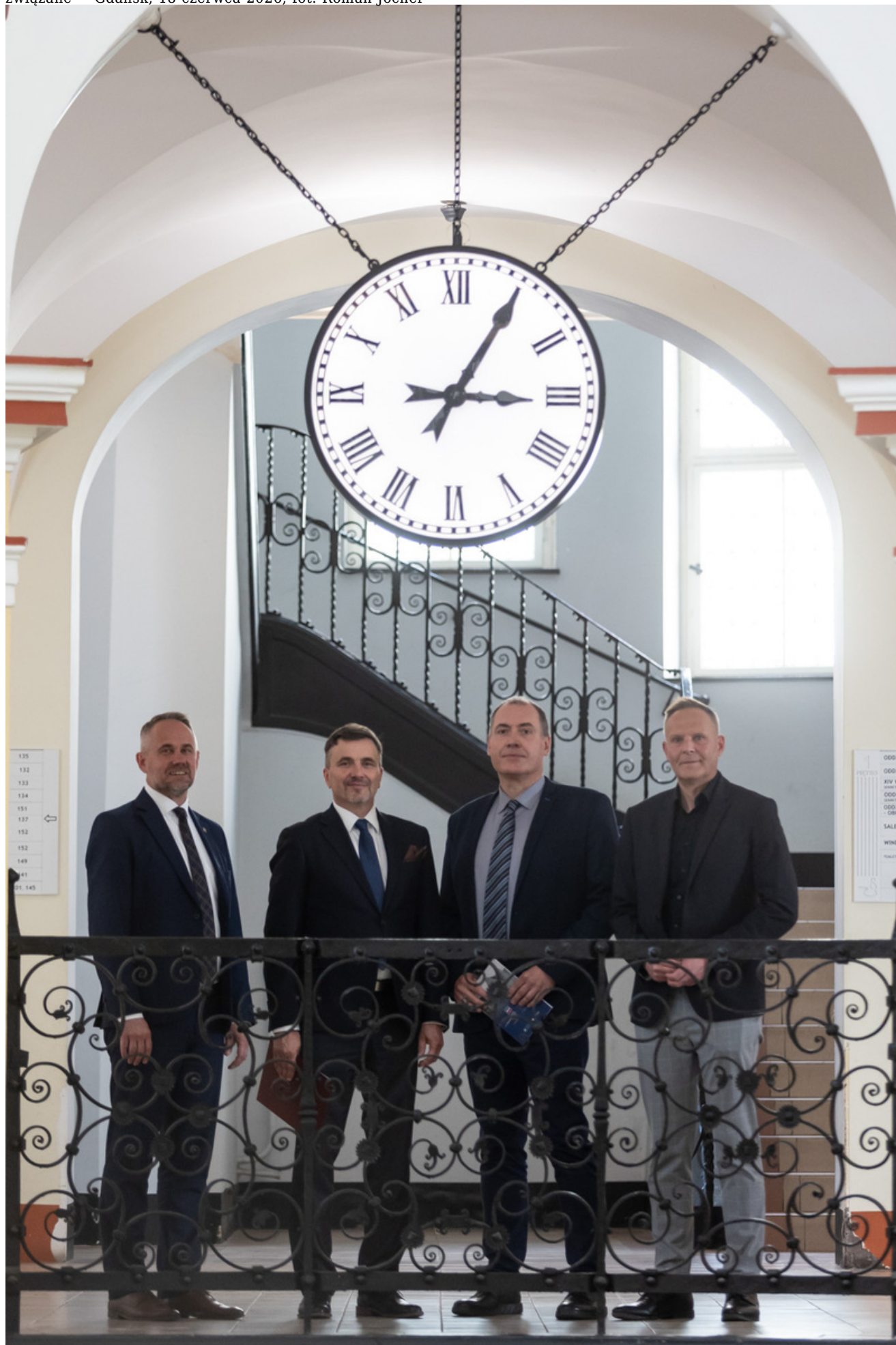
związane” - Gdańsk, 18 czerwca 2026