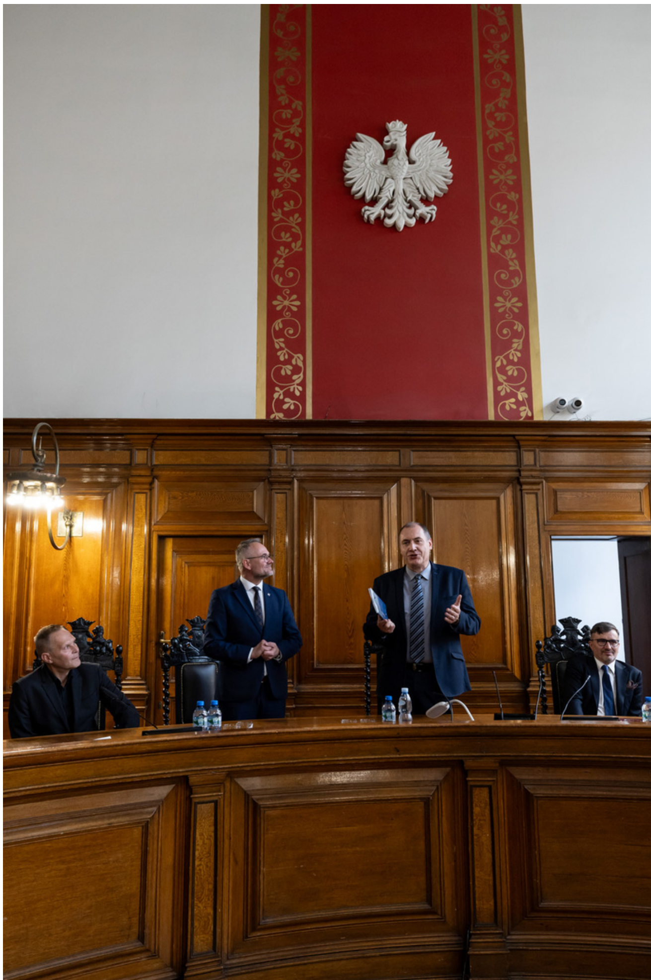
Promocja publikacji „Niezwyczajna historia zwykłych obiektów”. Budynek Sądu Okręgowego w Gdańsku i osoby z nim