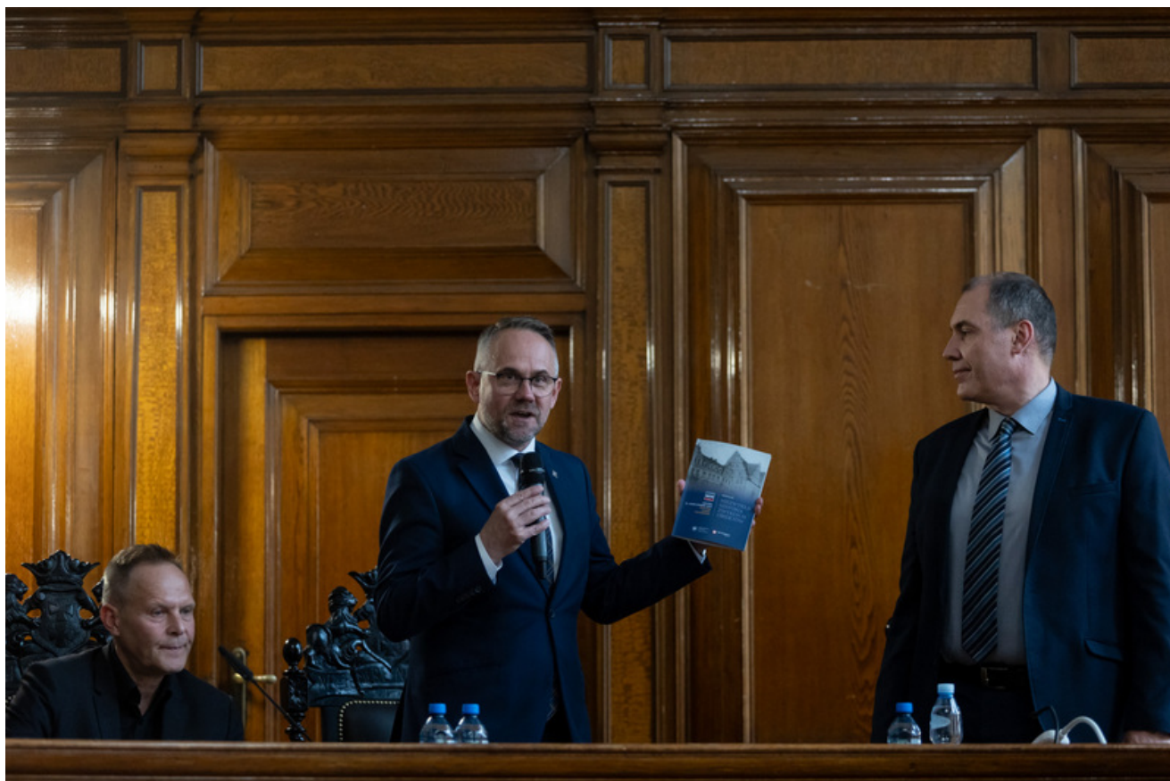
Promocja publikacji „Niezwykła historia zwykłych obiektów. Budynek Sądu Okręgowego w Gdańsku i osoby z nim związane” - Gdańsk, 18 czerwca 2026