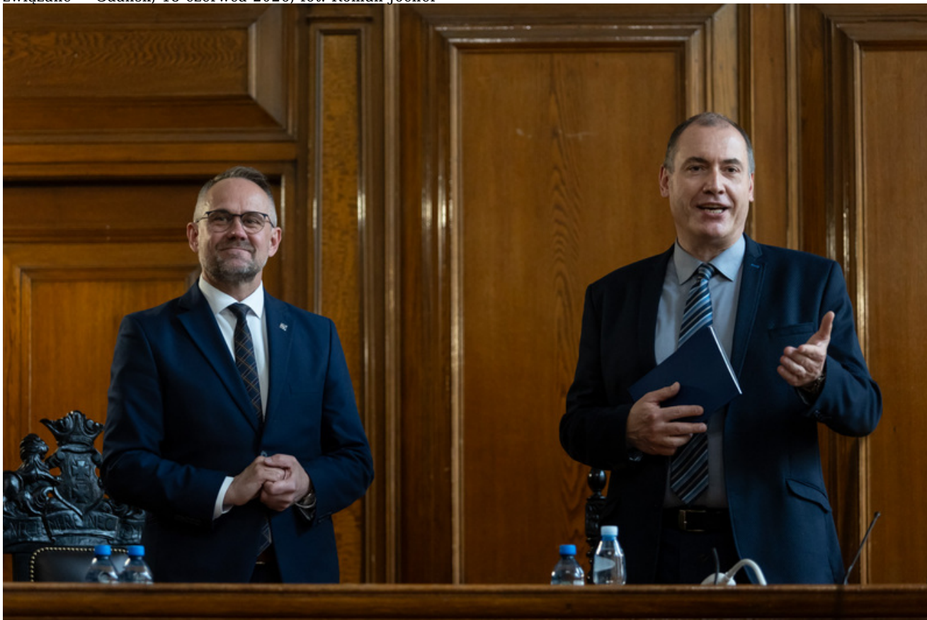
Promocja publikacji „Niezwykła historia zwykłych obiektów. Budynek Sądu Okręgowego w Gdańsku i osoby z nim związane” - Gdańsk, 18 czerwca 2026