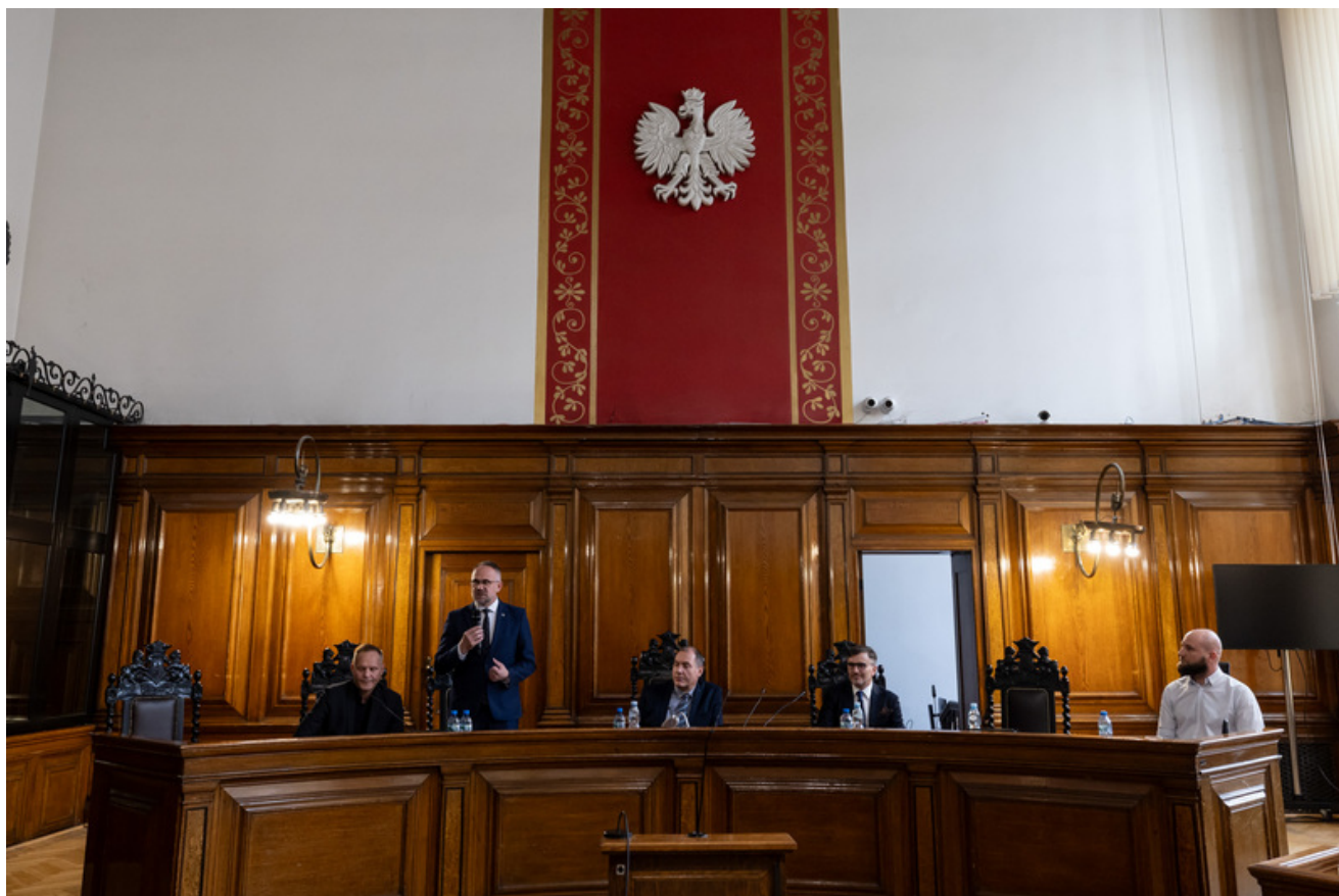
Promocja publikacji „Niezwyczajna historia zwykłych obiektów. Budynek Sądu Okręgowego w Gdańsku i osoby z nim związane” - Gdańsk, 18 czerwca 2026, fot. Roman Jocher