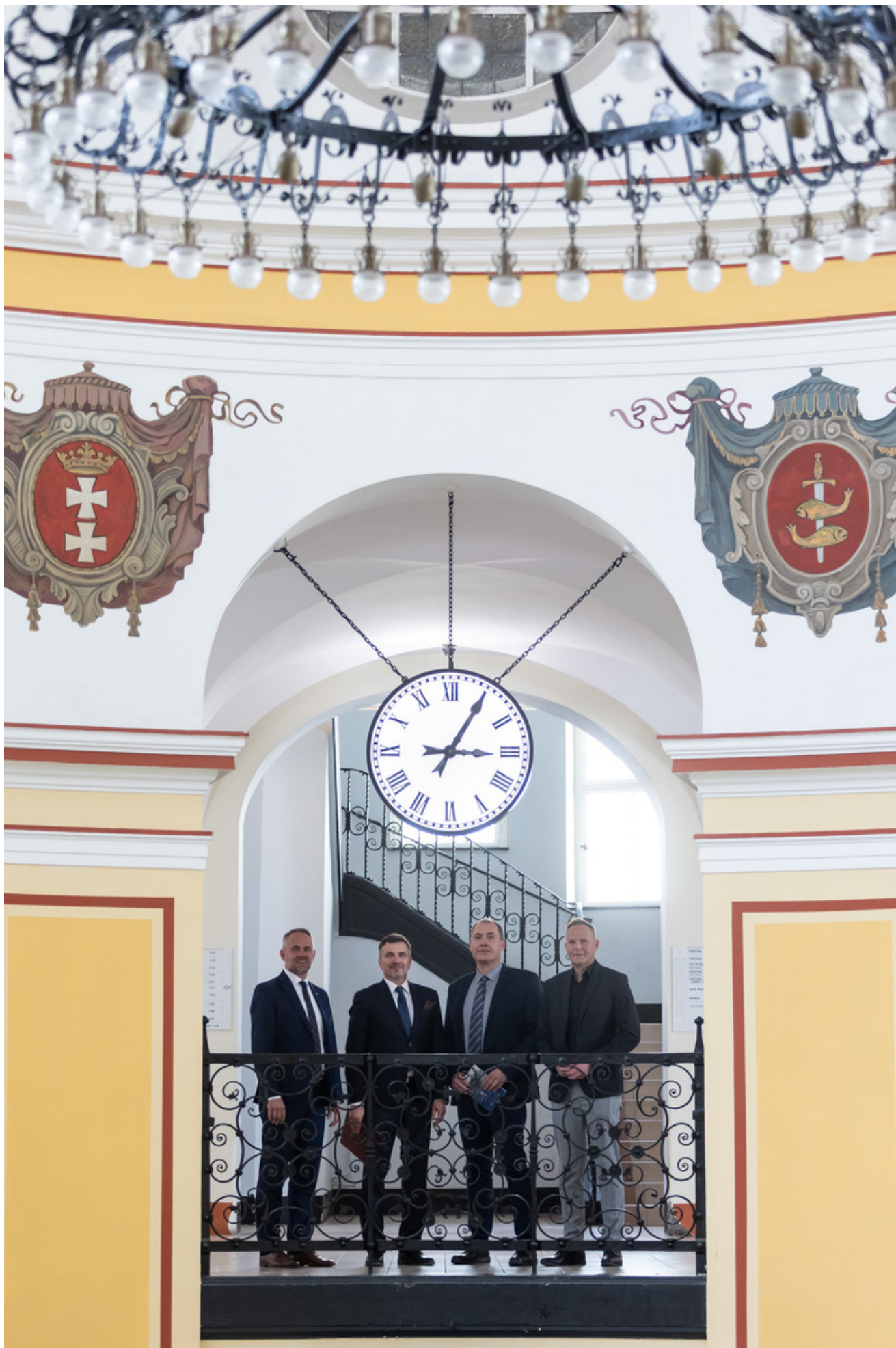
Promocja publikacji „Niezwykła historia zwykłych obiektów. Budynek Sądu Okręgowego w Gdańsku i osoby z nim