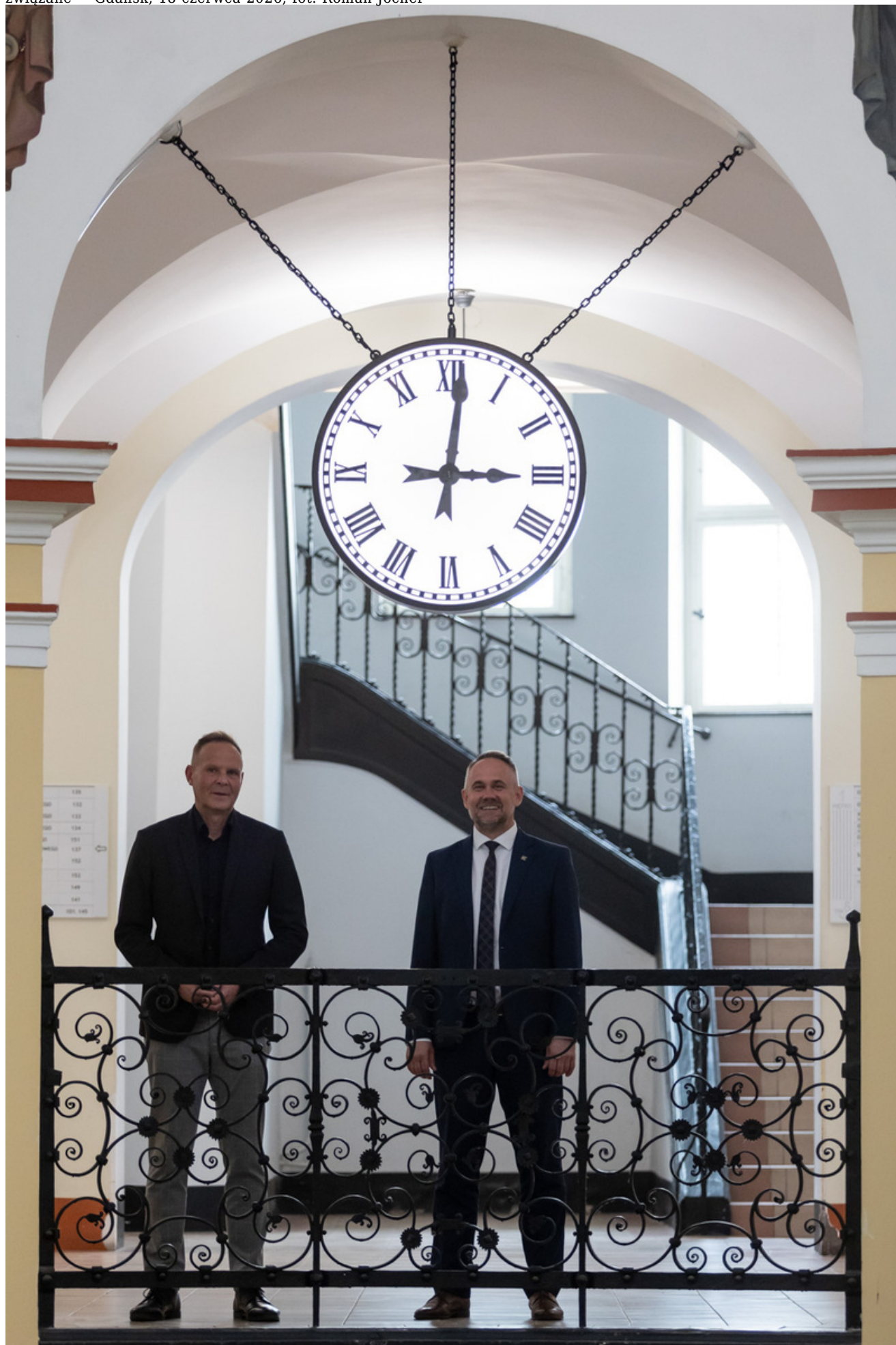
związane” - Gdańsk, 18 czerwca 2026