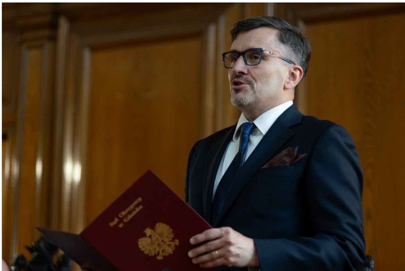
Promocja publikacji „Niezwykła historia zwykłych obiektów. Budynek Sądu Okręgowego w Gdańsku i osoby z nim związane” - Gdańsk, 18 czerwca 2026