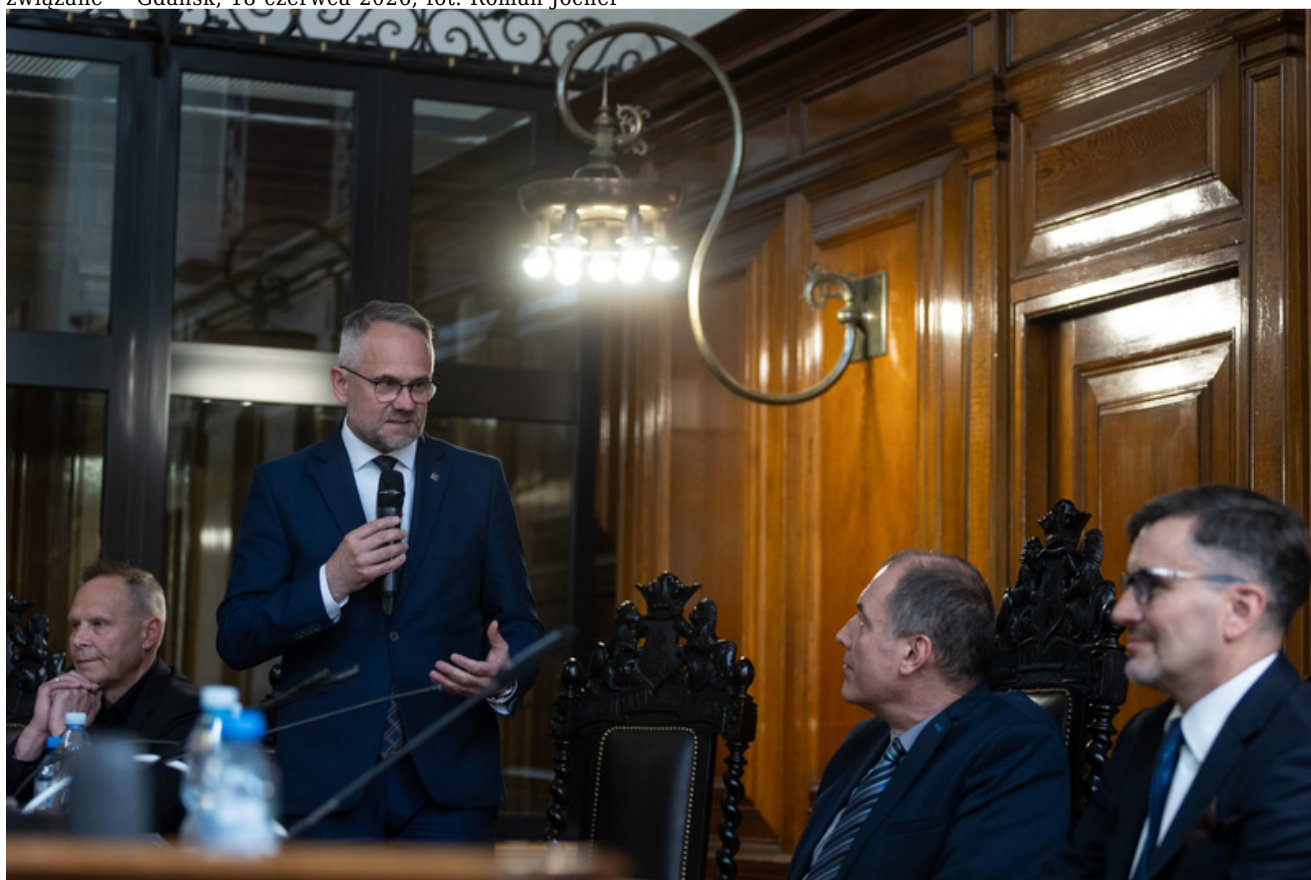
Promocja publikacji „Niezwyczajna historia zwykłych obiektów. Budynek Sądu Okręgowego w Gdańsku i osoby z nim związane” - Gdańsk, 18 czerwca 2026