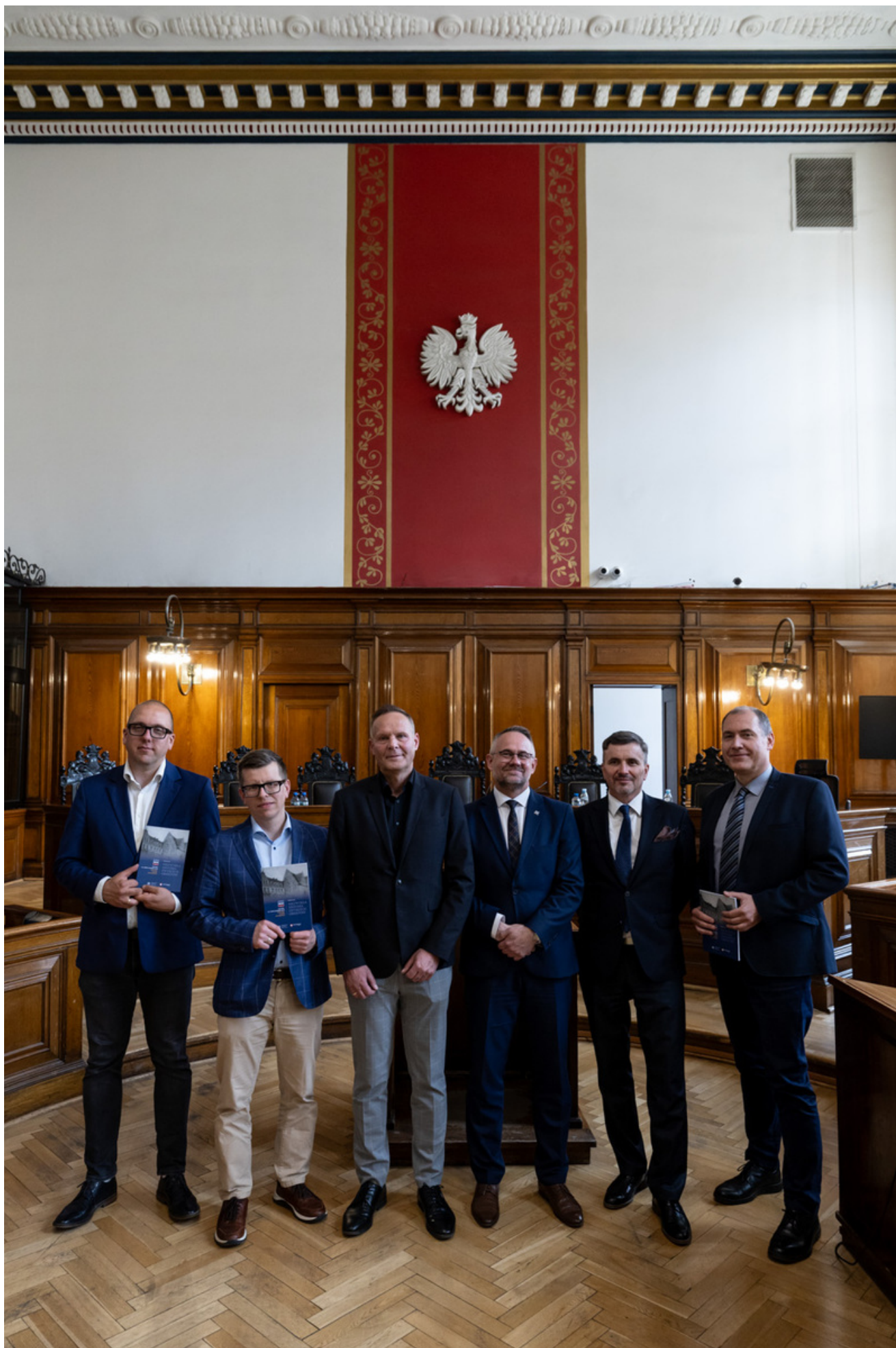
Promocja publikacji „Niezwyczajna historia zwykłych obiektów”. Budynek Sądu Okręgowego w Gdańsku i osoby z nim