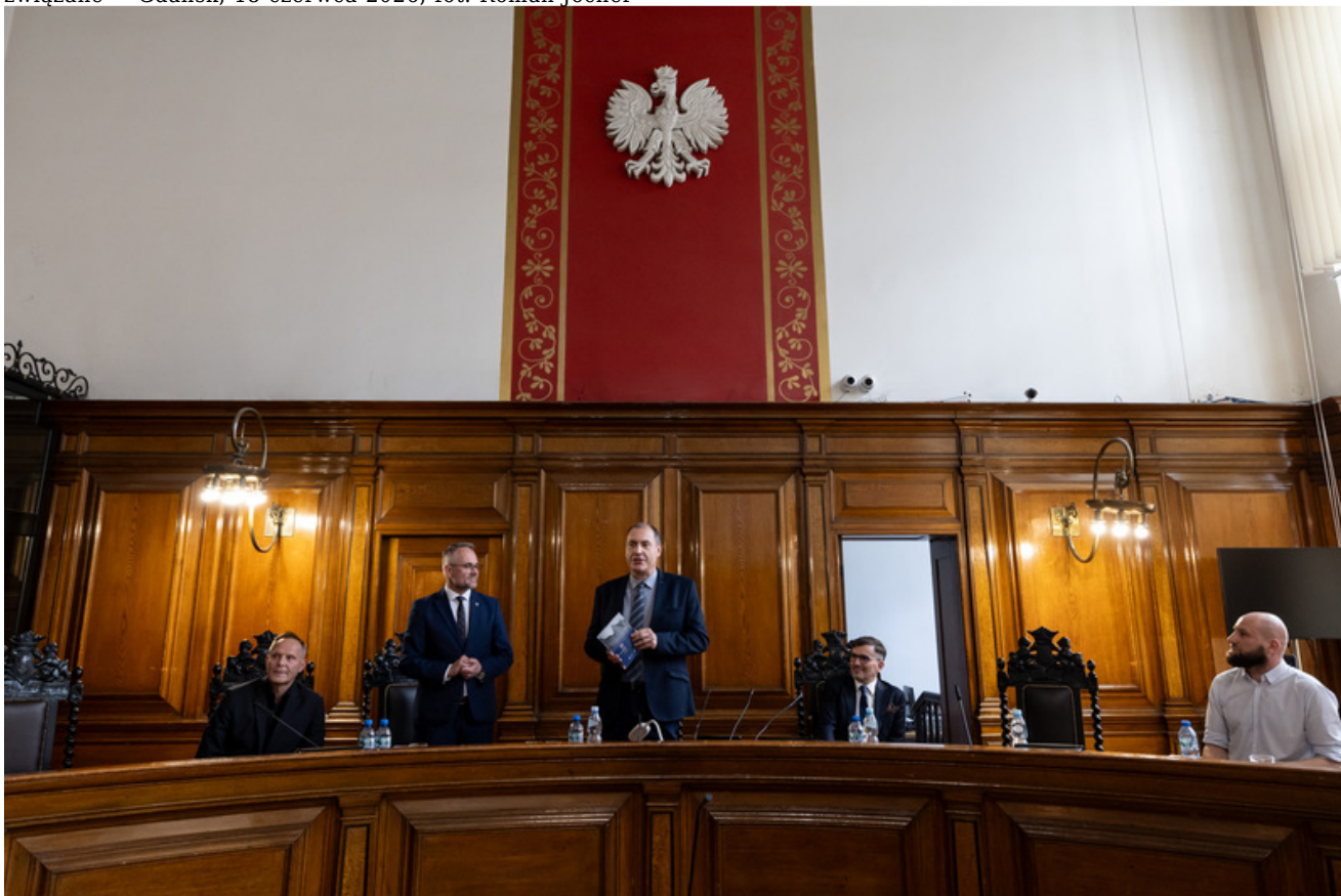
Promocja publikacji „Niezwykła historia zwykłych obiektów. Budynek Sądu Okręgowego w Gdańsku i osoby z nim związane” - Gdańsk, 18 czerwca 2026