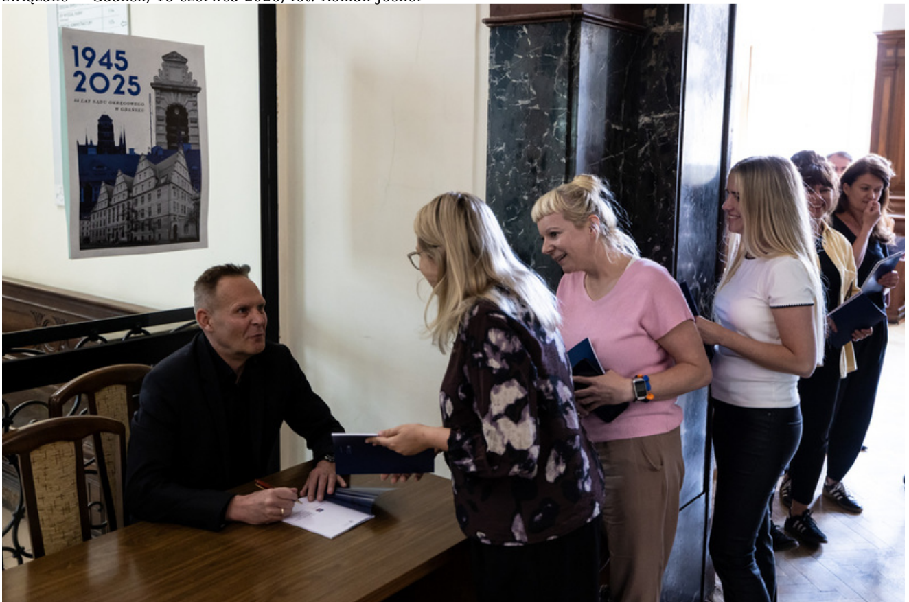
Promocja publikacji „Niezwyczajna historia zwykłych obiektów. Budynek Sądu Okręgowego w Gdańsku i osoby z nim związane” - Gdańsk, 18 czerwca 2026