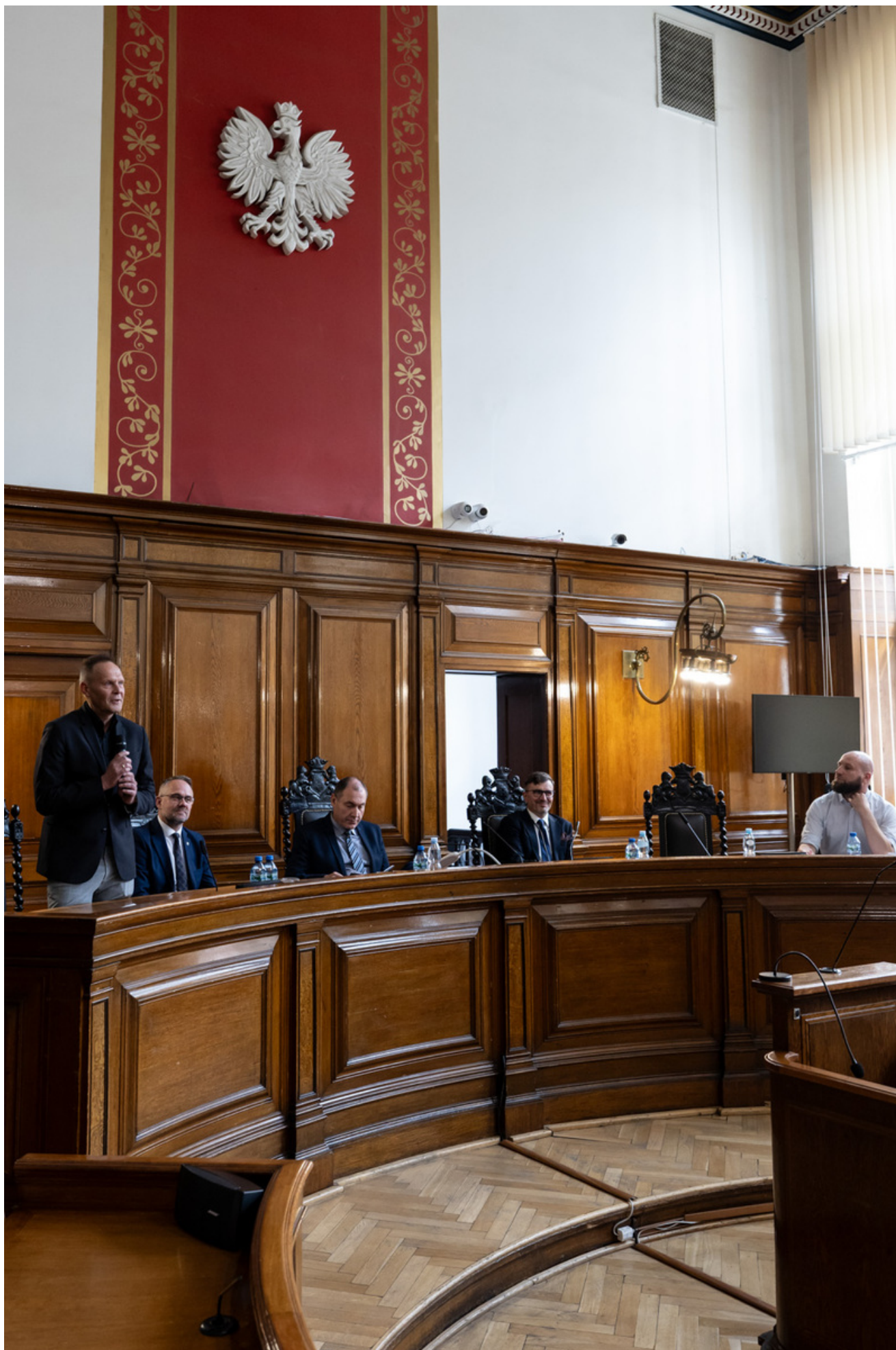
Promocja publikacji „Niezwyczajna historia zwykłych obiektów. Budynek Sądu Okręgowego w Gdańsku i osoby z nim