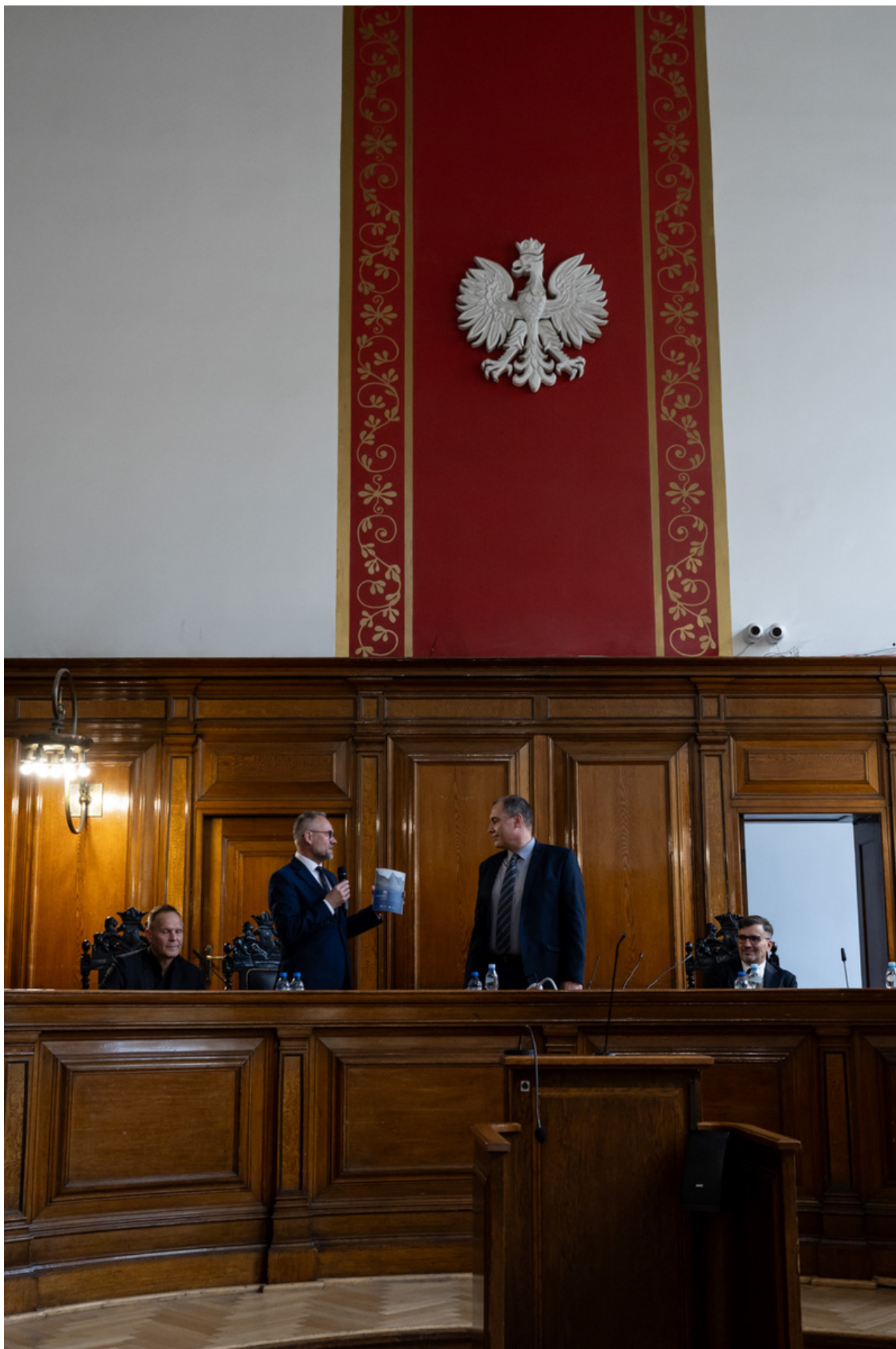
Promocja publikacji „Niezwyczajna historia zwykłych obiektów”. Budynek Sądu Okręgowego w Gdańsku i osoby z nim