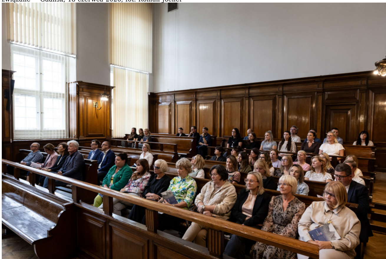
Promocja publikacji „Niezwykła historia zwykłych obiektów. Budynek Sądu Okręgowego w Gdańsku i osoby z nim związane” - Gdańsk, 18 czerwca 2026, fot. Roman Jocher