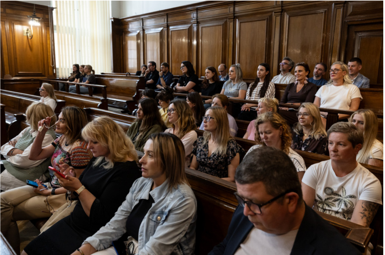
Promocja publikacji „Niezwyczajna historia zwykłych obiektów. Budynek Sądu Okręgowego w Gdańsku i osoby z nim związane” - Gdańsk, 18 czerwca 2026