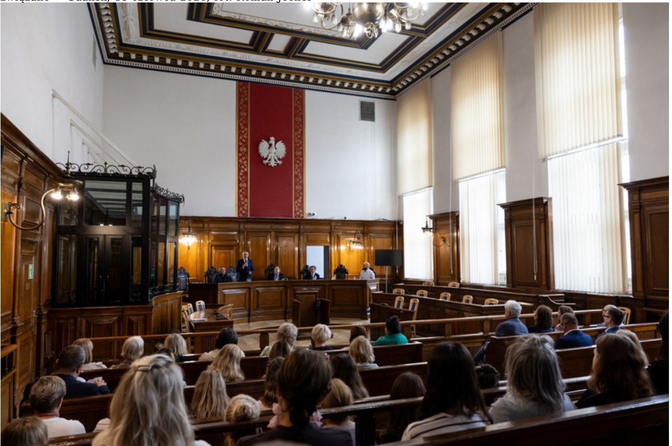
Promocja publikacji „Niezwyczajna historia zwykłych obiektów. Budynek Sądu Okręgowego w Gdańsku i osoby z nim związane” - Gdańsk, 18 czerwca 2026