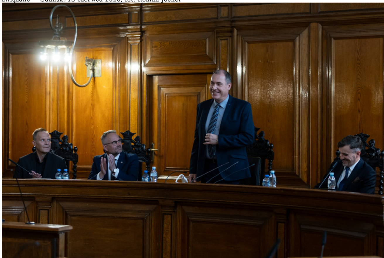
Promocja publikacji „Niezwyczajna historia zwykłych obiektów. Budynek Sądu Okręgowego w Gdańsku i osoby z nim związane” - Gdańsk, 18 czerwca 2026