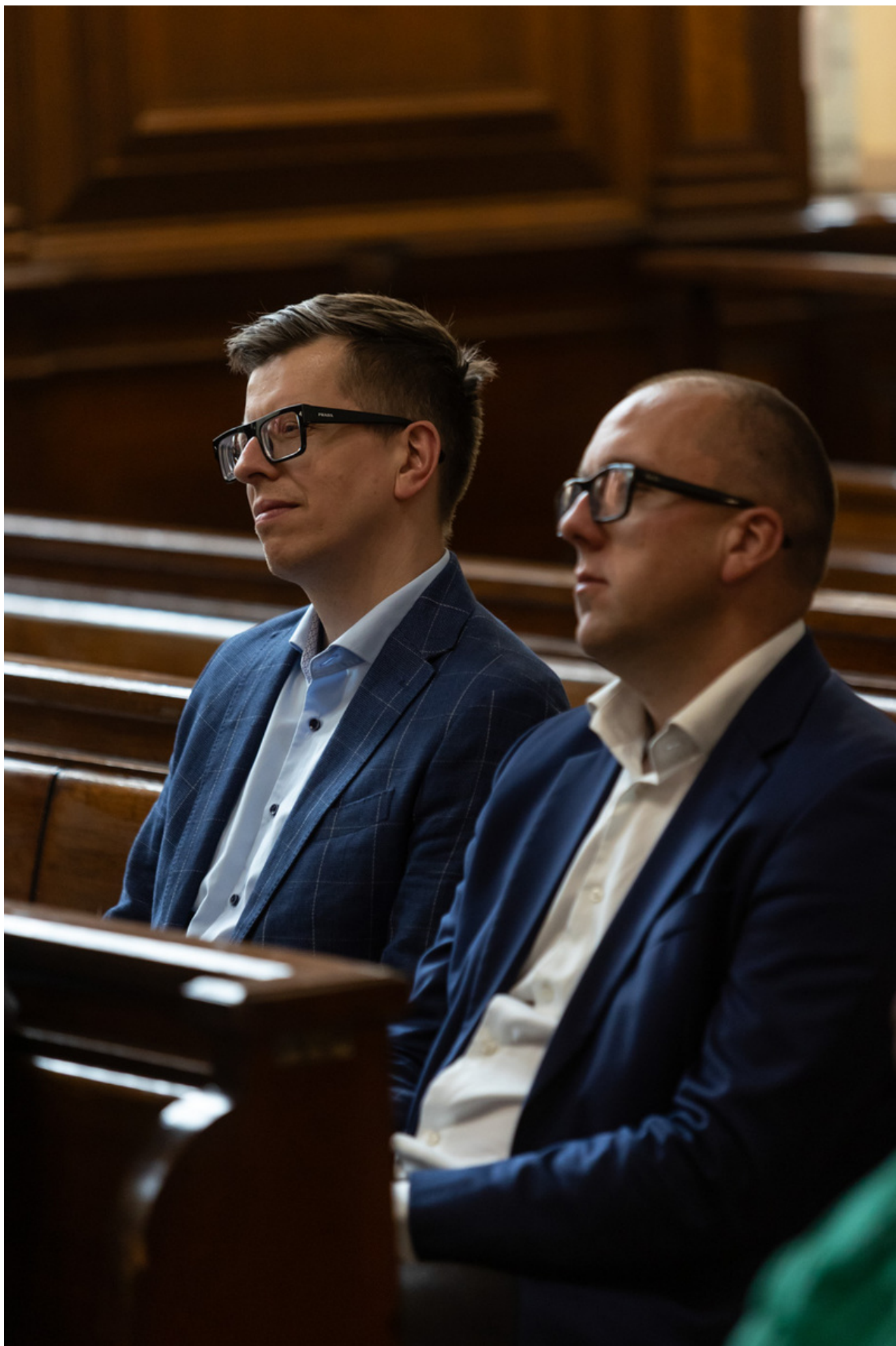
Promocja publikacji „Niezwyczajna historia zwykłych obiektów”. Budynek Sądu Okręgowego w Gdańsku i osoby z nim