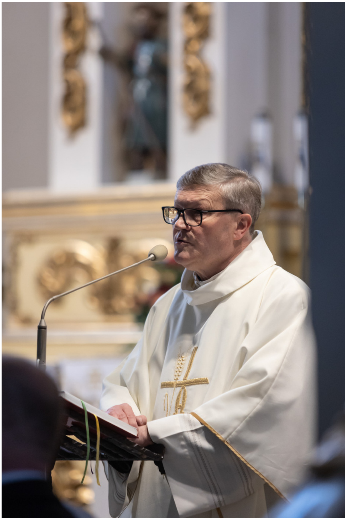
„Nie ulegli, więc zwyciężyli” — uroczystość odsłonięcia odrestaurowanego pomnika 5. Wileńskiej Brygady AK w