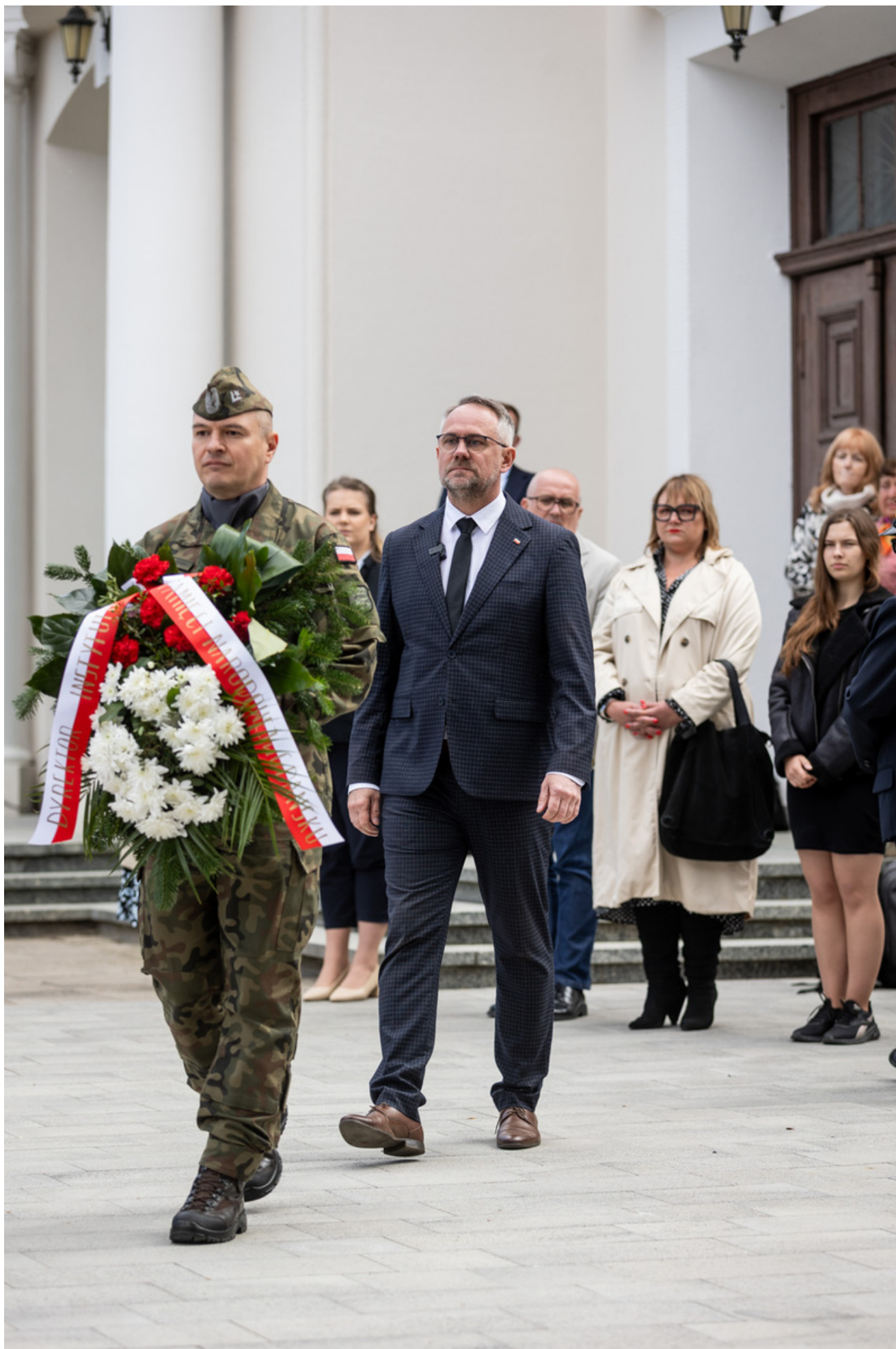
„Nie ulegli, więc zwyciężyli” — uroczystość odsłonięcia odrestaurowanego pomnika 5. Wileńskiej Brygady AK w