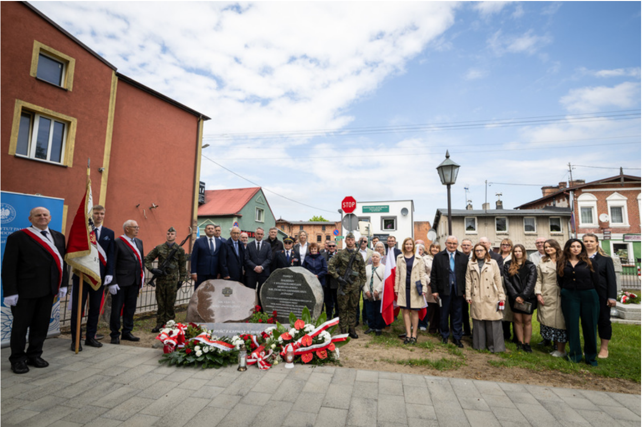
„Nie ulegli, więc zwyciężyli” — uroczystość odsłonięcia odrestaurowanego pomnika 5. Wileńskiej Brygady AK w Lubichowie - Lubichowo, 19 maja 2026