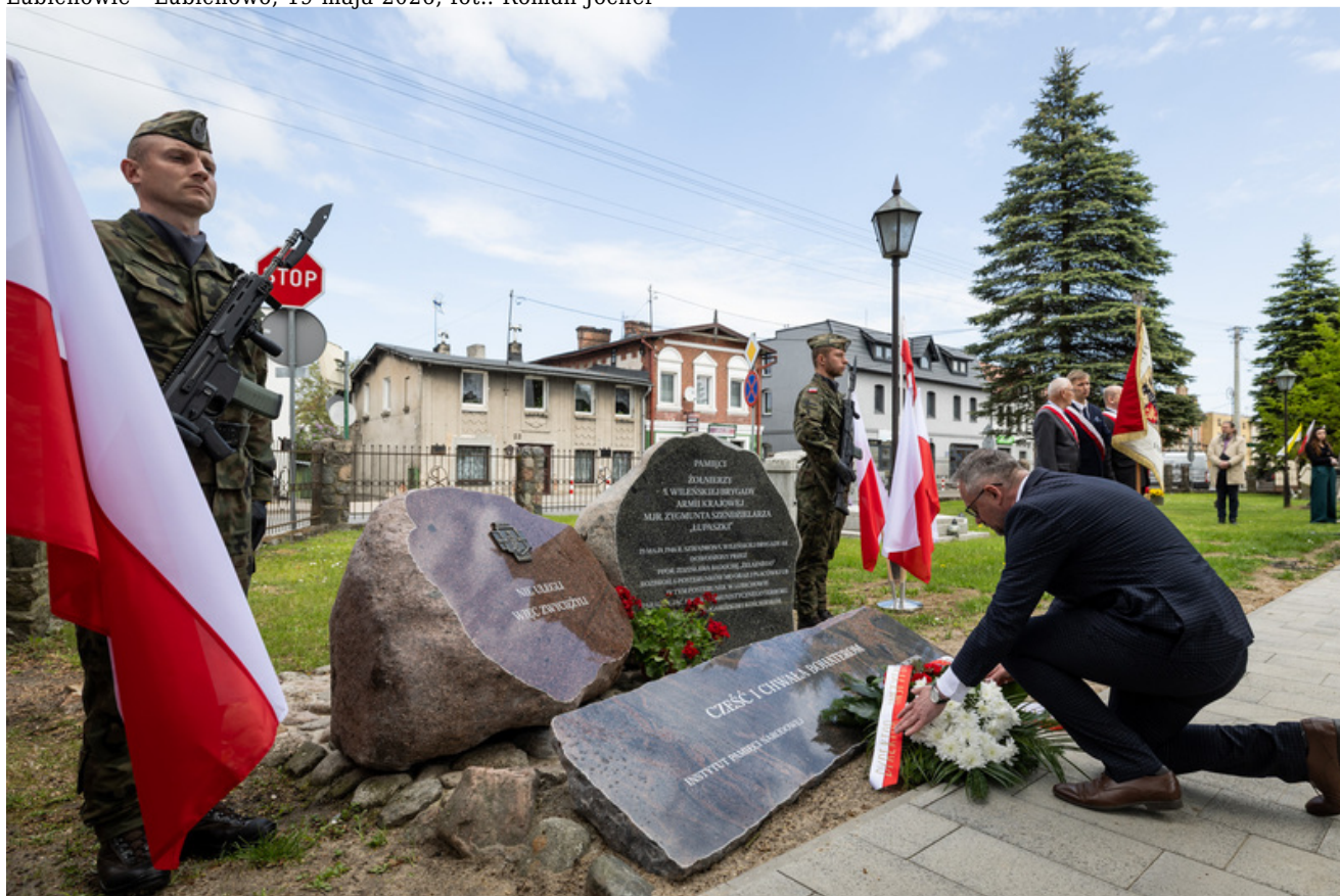
„Nie ulegli, więc zwyciężyli” — uroczystość odsłonięcia odrestaurowanego pomnika 5. Wileńskiej Brygady AK w Lubichowie - Lubichowo, 19 maja 2026