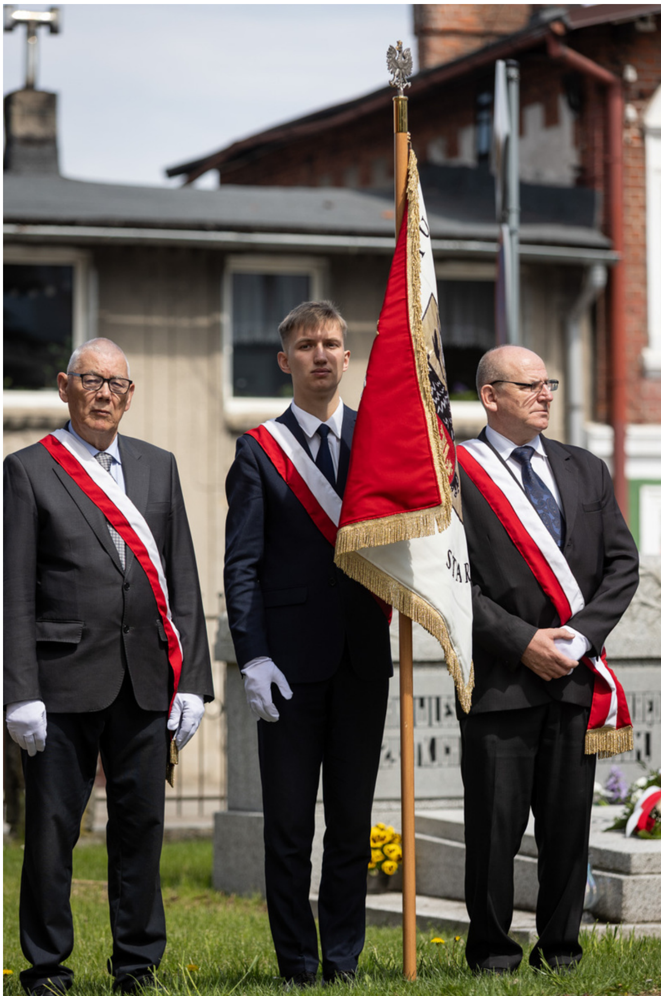
„Nie ulegli, więc zwyciężyli” — uroczystość odsłonięcia odrestaurowanego pomnika 5. Wileńskiej Brygady AK w