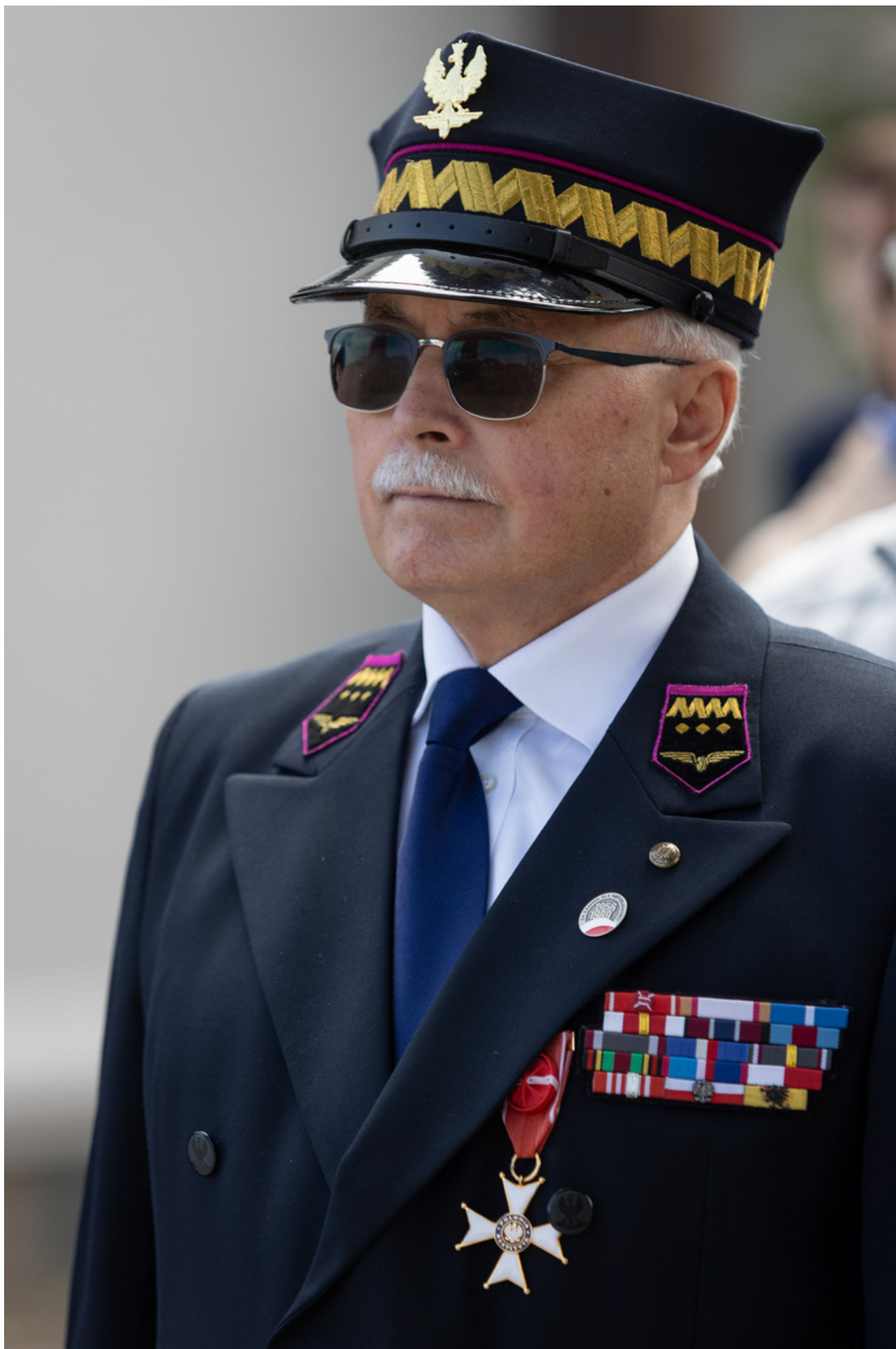
„Nie ulegli, więc zwyciężyli” — uroczystość odsłonięcia odrestaurowanego pomnika 5. Wileńskiej Brygady AK w