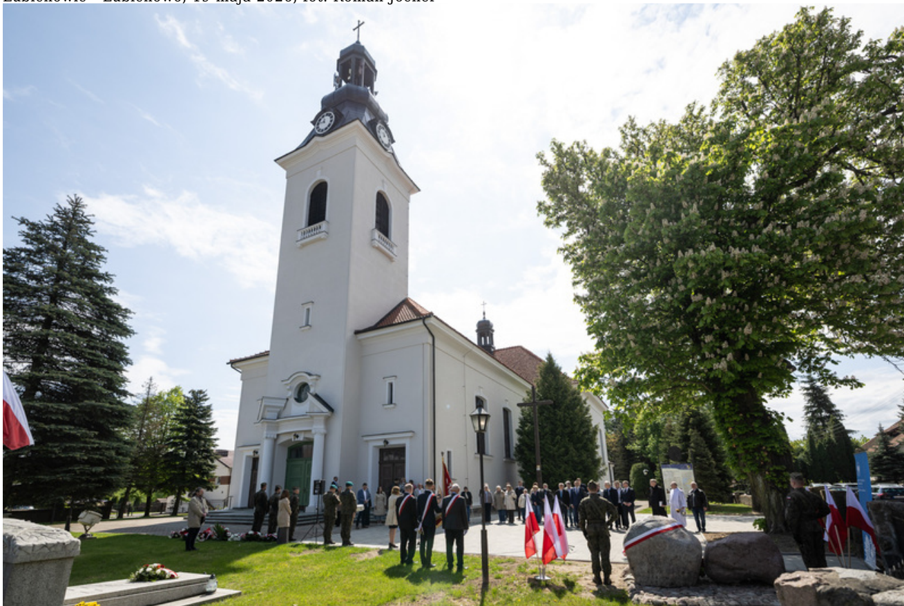
„Nie ulegli, więc zwyciężyli” — uroczystość odsłonięcia odrestaurowanego pomnika 5. Wileńskiej Brygady AK w Lubichowie - Lubichowo, 19 maja 2026