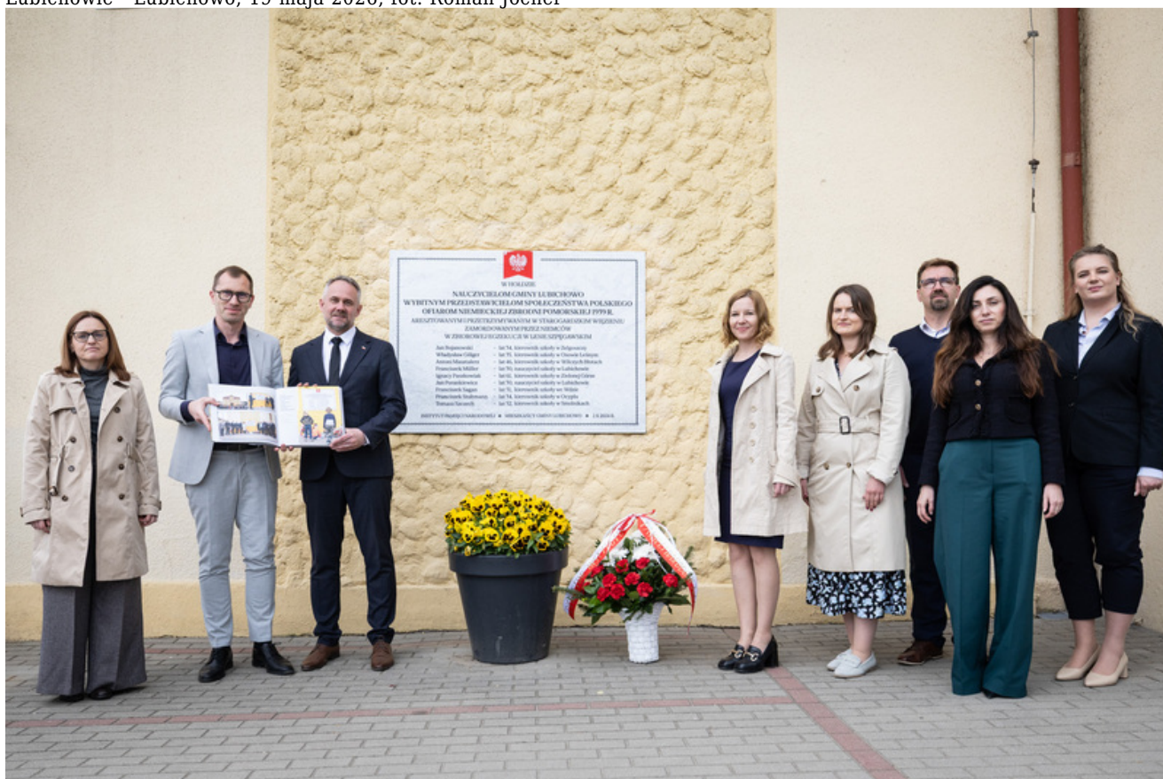
„Nie ulegli, więc zwyciężyli” — uroczystość odsłonięcia odrestaurowanego pomnika 5. Wileńskiej Brygady AK w Lubichowie - Lubichowo, 19 maja 2026