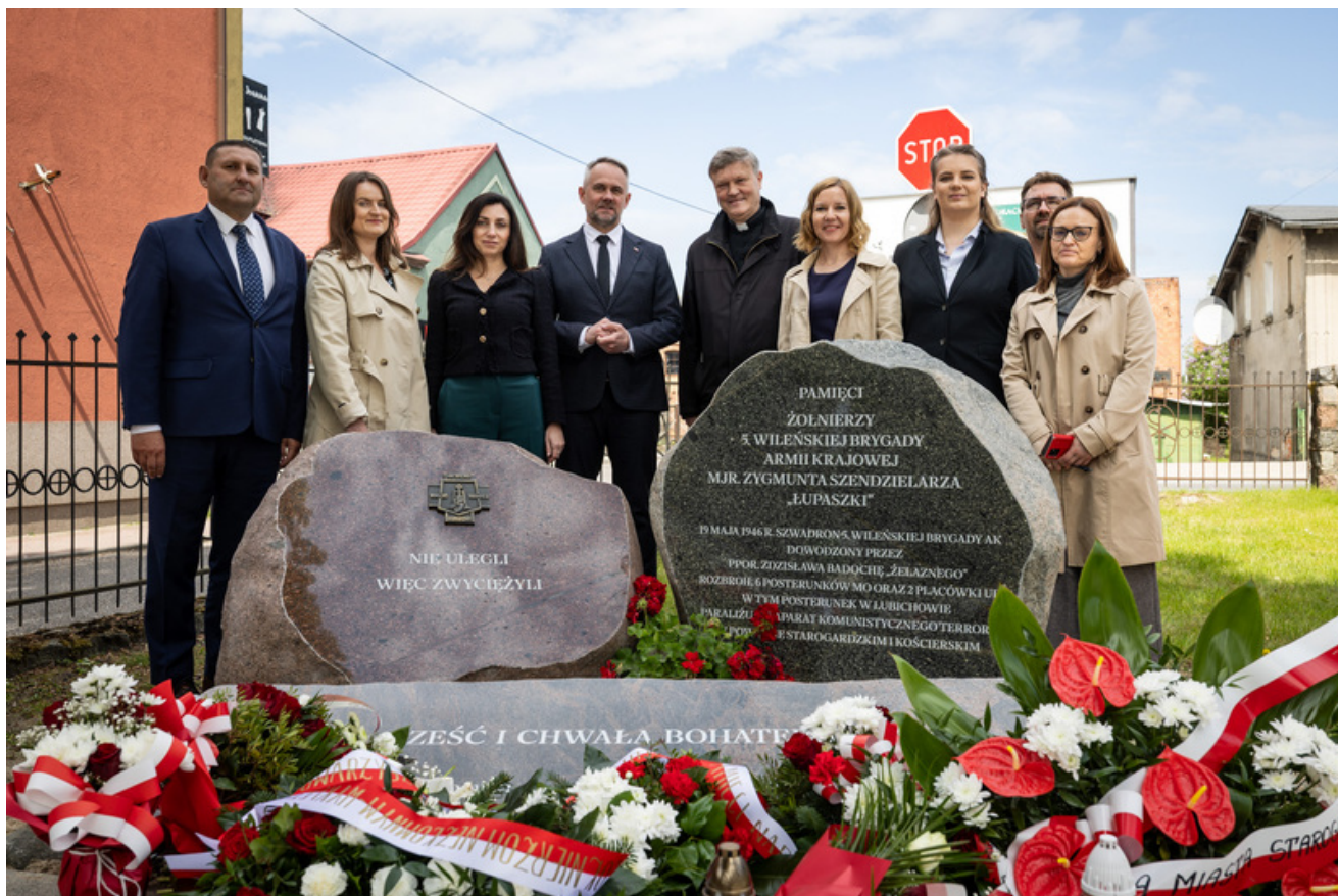
„Nie ulegli, więc zwyciężyli” — uroczystość odsłonięcia odrestaurowanego pomnika 5. Wileńskiej Brygady AK w Lubichowie - Lubichowo, 19 maja 2026