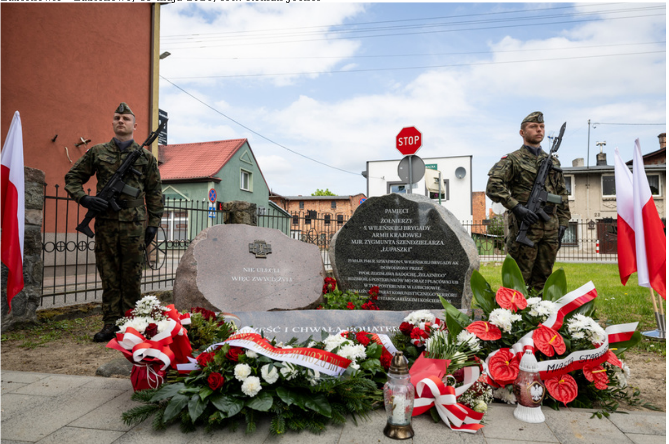
„Nie ulegli, więc zwyciężyli” — uroczystość odsłonięcia odrestaurowanego pomnika 5. Wileńskiej Brygady AK w Lubichowie - Lubichowo, 19 maja 2026