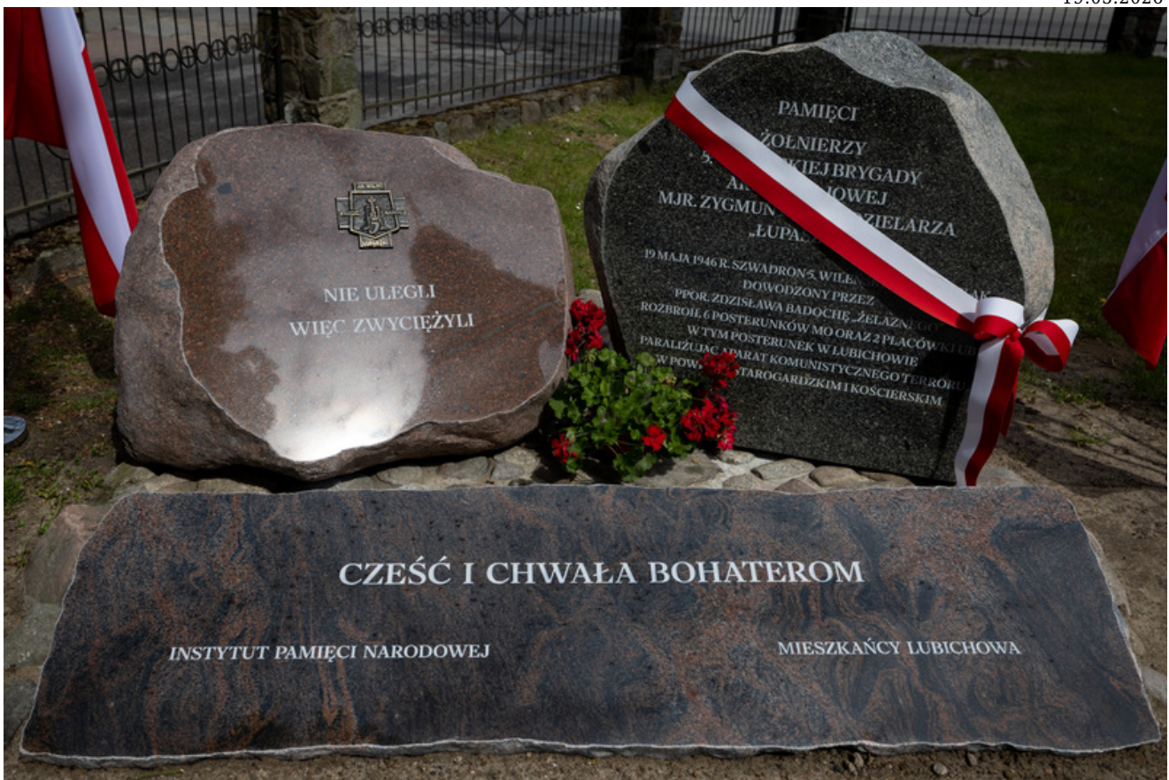
„Nie ulegli, więc zwyciężyli” — uroczystość odsłonięcia odrestaurowanego pomnika 5. Wileńskiej Brygady AK w Lubichowie - Lubichowo, 19 maja 2026