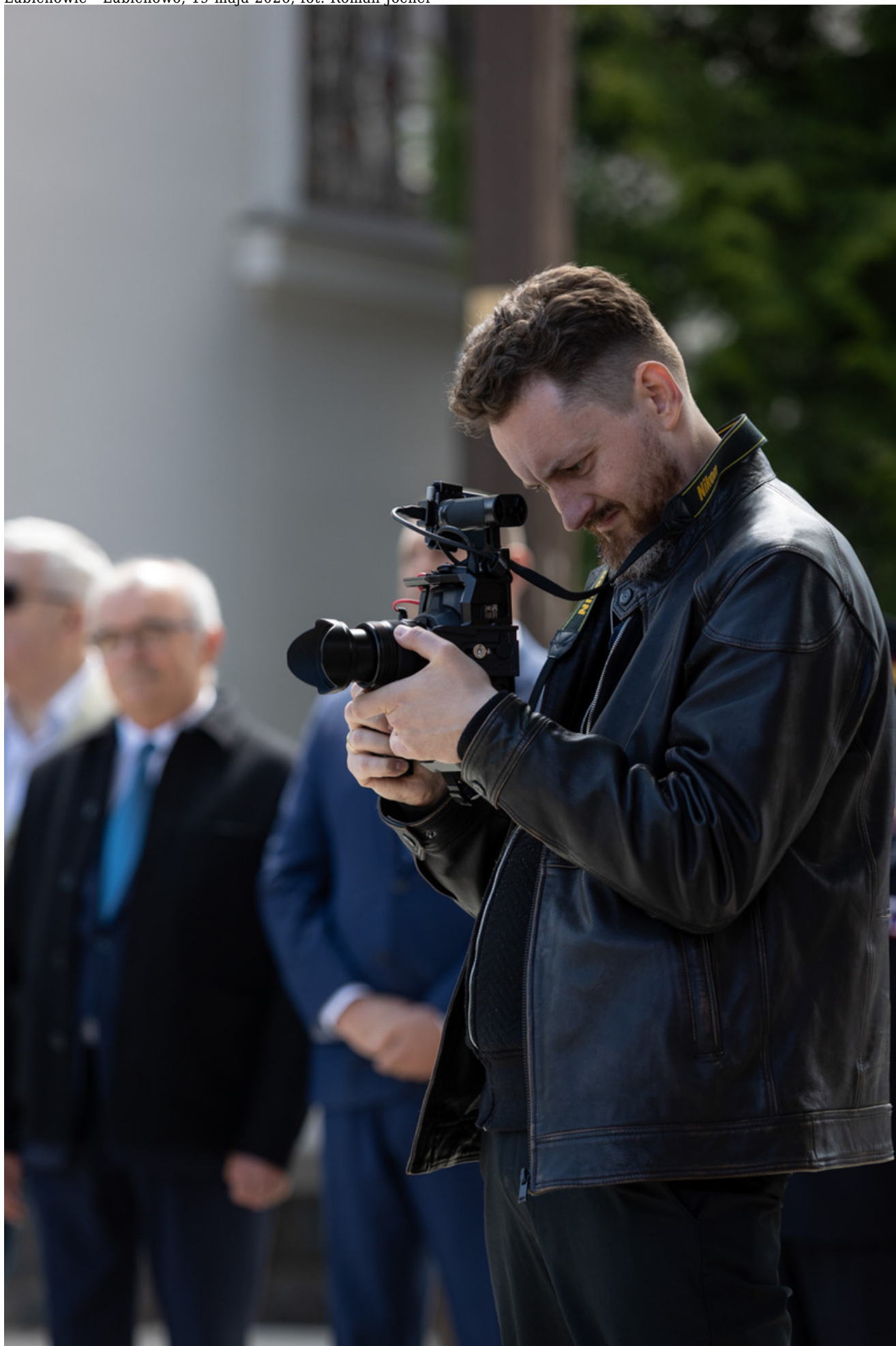
Lubichowie - Lubichowo, 19 maja 2026