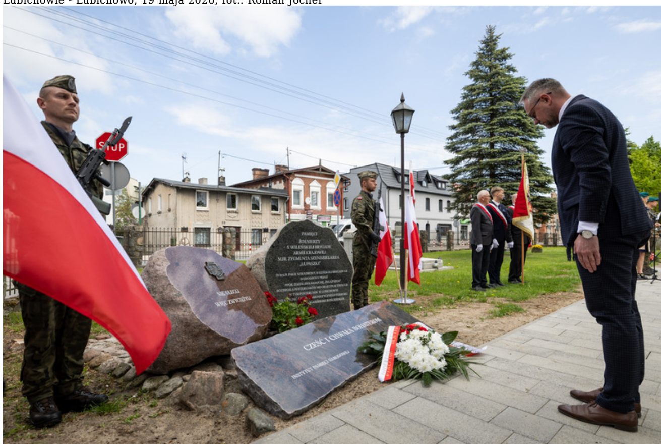
„Nie ulegli, więc zwyciężyli” — uroczystość odsłonięcia odrestaurowanego pomnika 5. Wileńskiej Brygady AK w Lubichowie - Lubichowo, 19 maja 2026, fot.. Roman Jocher