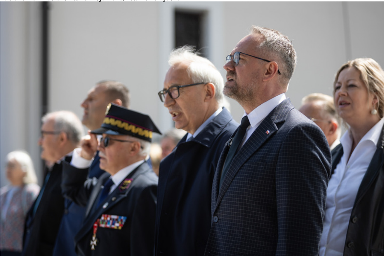
„Nie ulegli, więc zwyciężyli” — uroczystość odsłonięcia odrestaurowanego pomnika 5. Wileńskiej Brygady AK w Lubichowie - Lubichowo, 19 maja 2026