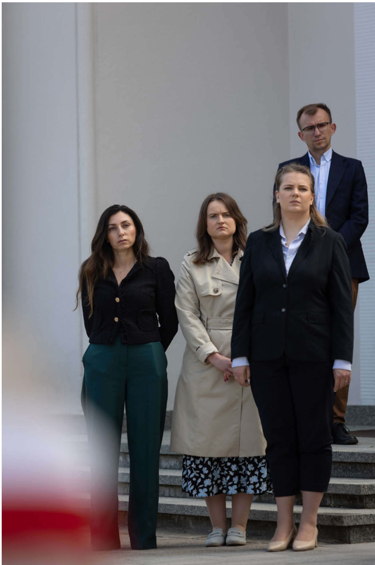
„Nie ulegli, więc zwyciężyli” — uroczystość odsłonięcia odrestaurowanego pomnika 5. Wileńskiej Brygady AK w