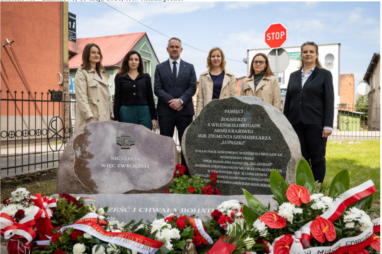
„Nie ulegli, więc zwyciężyli” — uroczystość odsłonięcia odrestaurowanego pomnika 5. Wileńskiej Brygady AK w Lubichowie - Lubichowo, 19 maja 2026