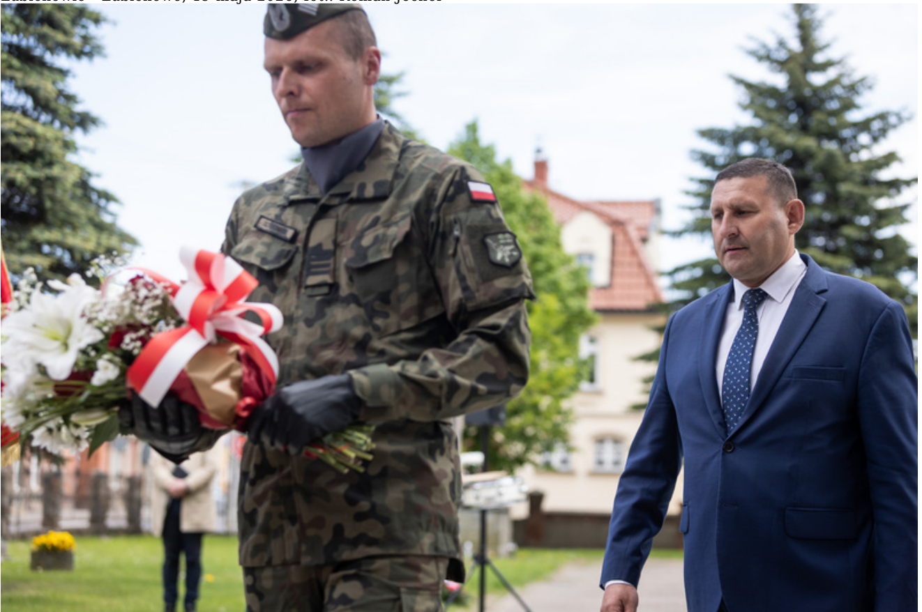
„Nie ulegli, więc zwyciężyli” — uroczystość odsłonięcia odrestaurowanego pomnika 5. Wileńskiej Brygady AK w Lubichowie - Lubichowo, 19 maja 2026