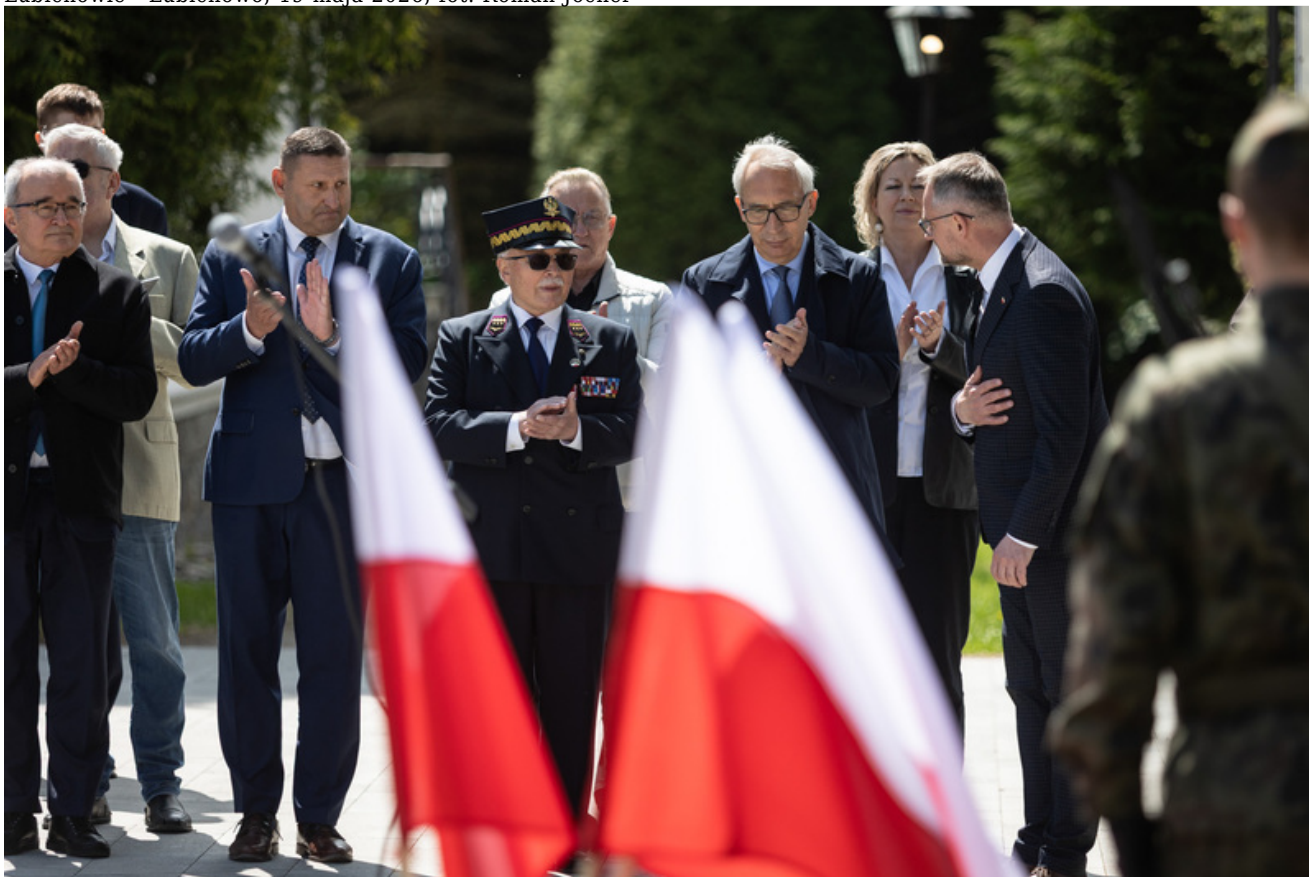
„Nie ulegli, więc zwyciężyli” — uroczystość odsłonięcia odrestaurowanego pomnika 5. Wileńskiej Brygady AK w Lubichowie - Lubichowo, 19 maja 2026, fot. Roman Jocher