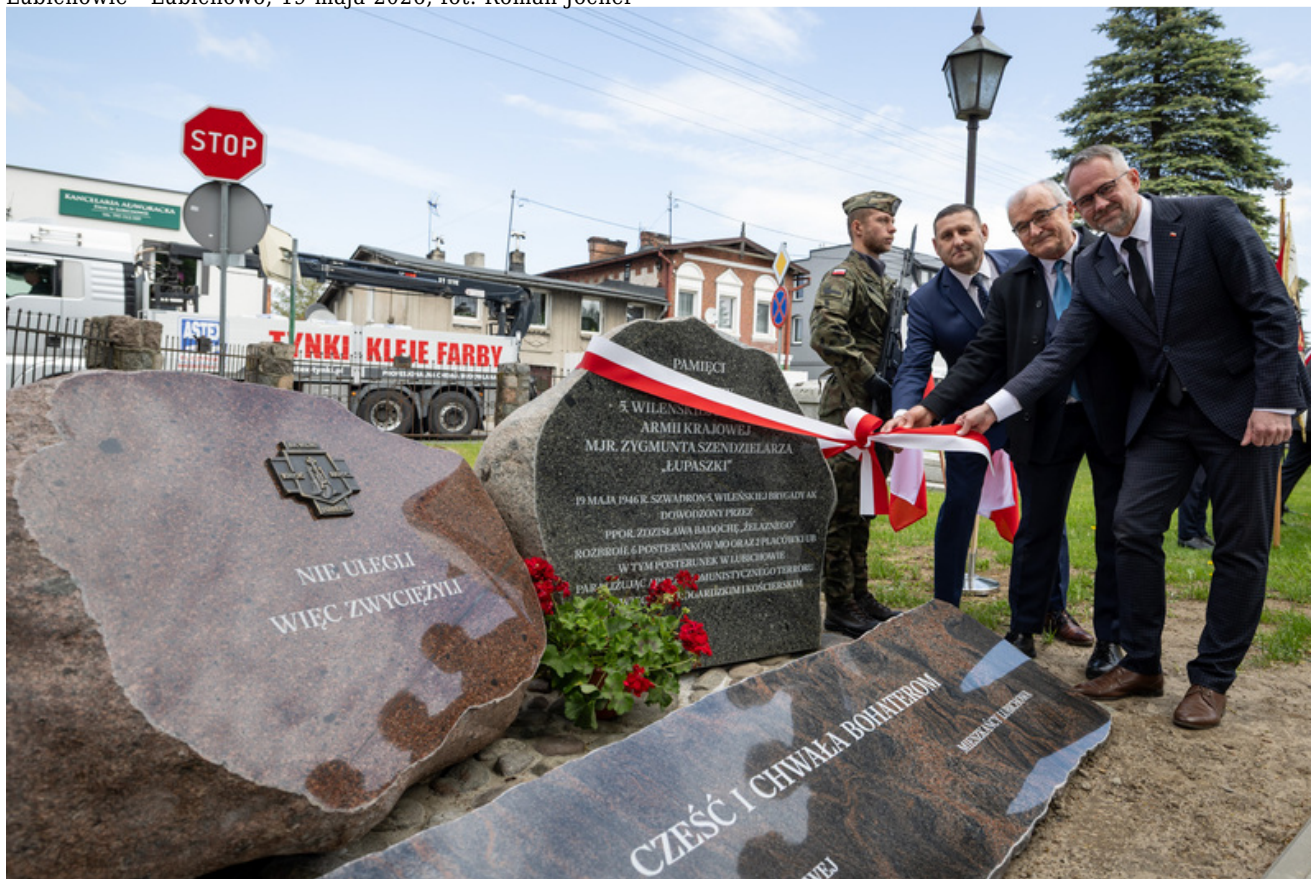
„Nie ulegli, więc zwyciężyli” — uroczystość odsłonięcia odrestaurowanego pomnika 5. Wileńskiej Brygady AK w Lubichowie - Lubichowo, 19 maja 2026