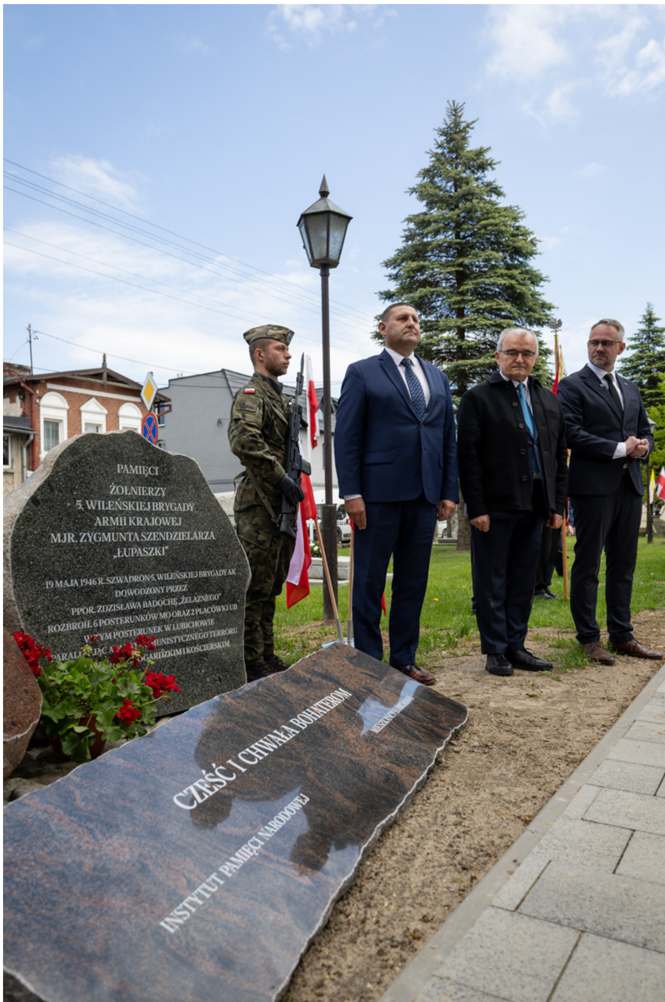
„Nie ulegli, więc zwyciężyli” — uroczystość odsłonięcia odrestaurowanego pomnika 5. Wileńskiej Brygady AK w