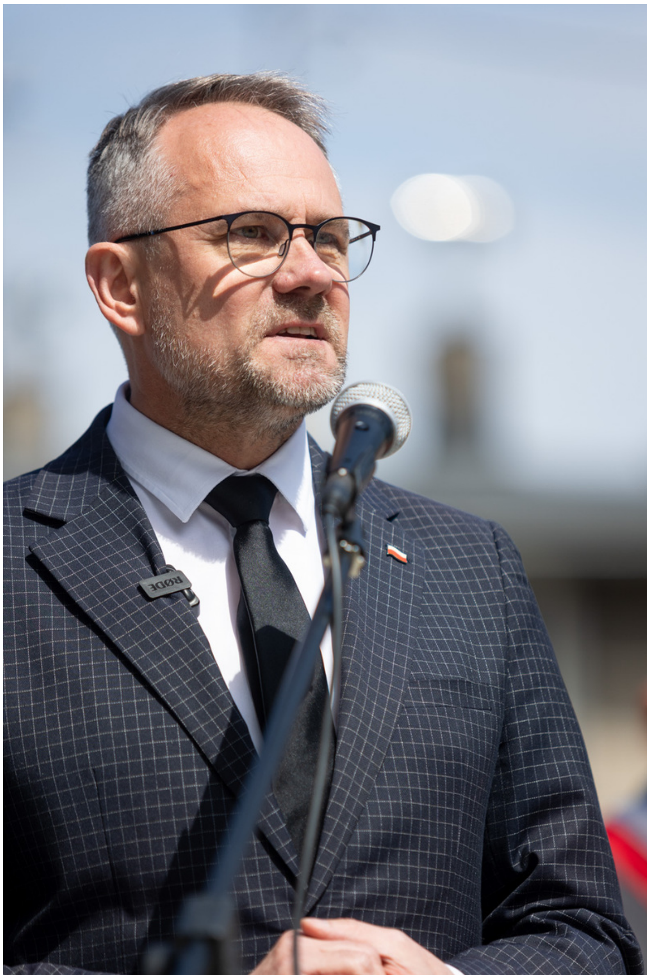
„Nie ulegli, więc zwyciężyli” — uroczystość odsłonięcia odrestaurowanego pomnika 5. Wileńskiej Brygady AK w