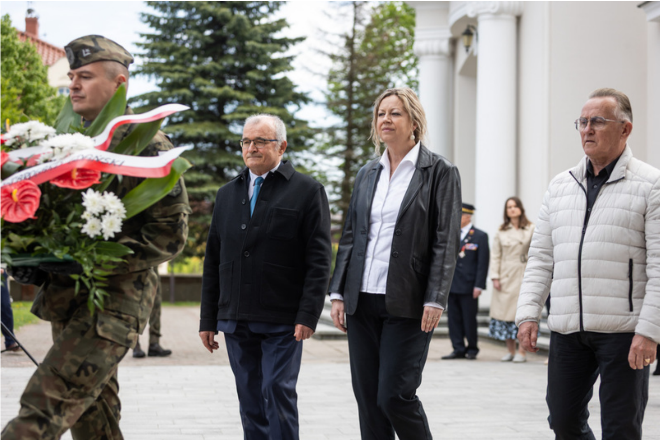
„Nie ulegli, więc zwyciężyli” — uroczystość odsłonięcia odrestaurowanego pomnika 5. Wileńskiej Brygady AK w Lubichowie - Lubichowo, 19 maja 2026, fot.. Roman Jocher