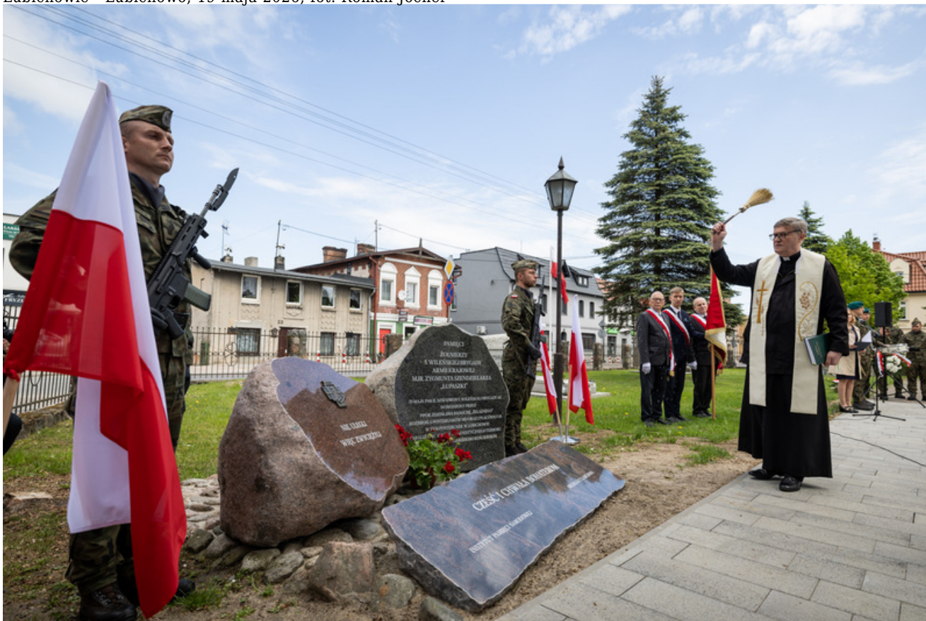
„Nie ulegli, więc zwyciężyli” — uroczystość odsłonięcia odrestaurowanego pomnika 5. Wileńskiej Brygady AK w Lubichowie - Lubichowo, 19 maja 2026