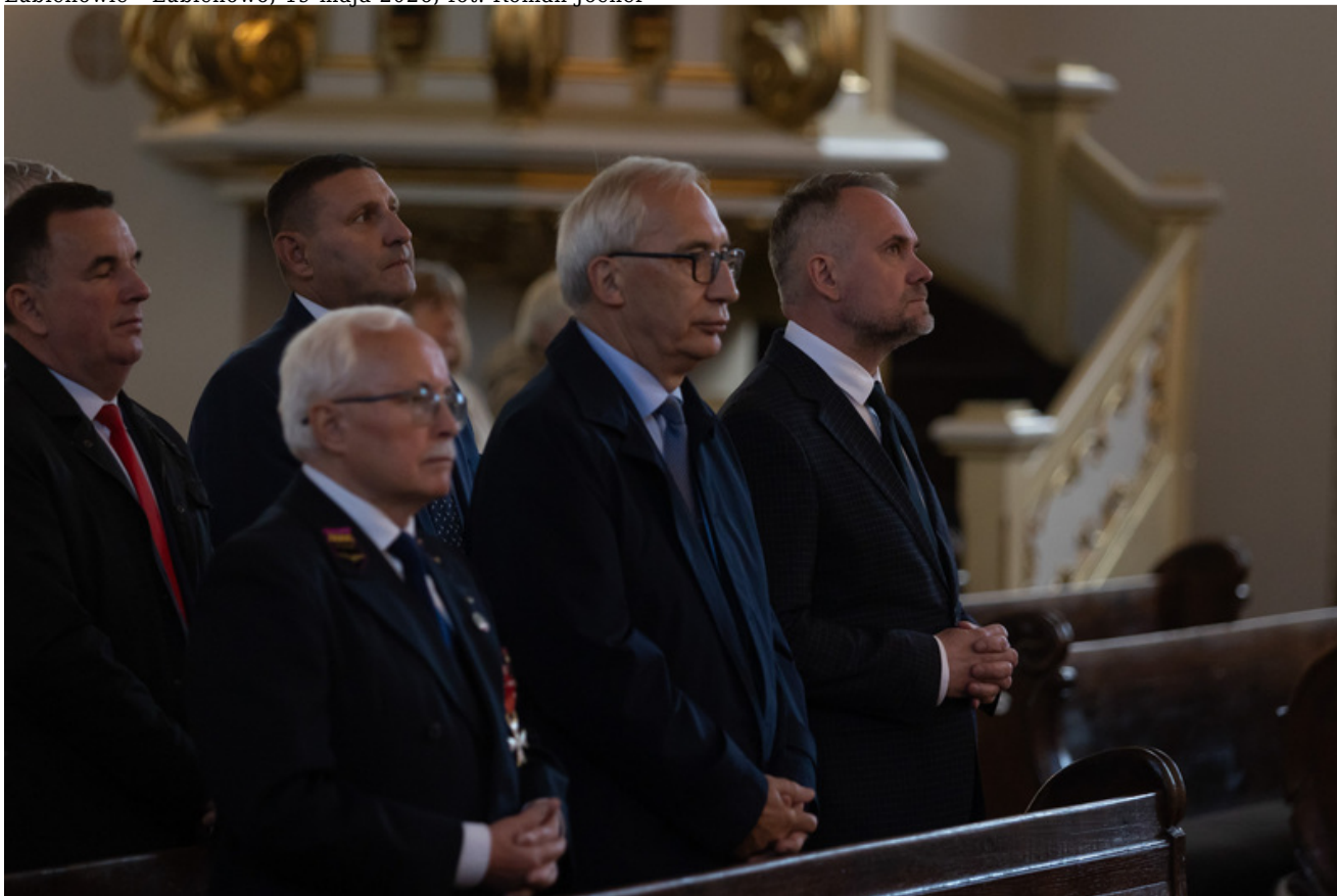
„Nie ulegli, więc zwyciężyli” — uroczystość odsłonięcia odrestaurowanego pomnika 5. Wileńskiej Brygady AK w Lubichowie - Lubichowo, 19 maja 2026