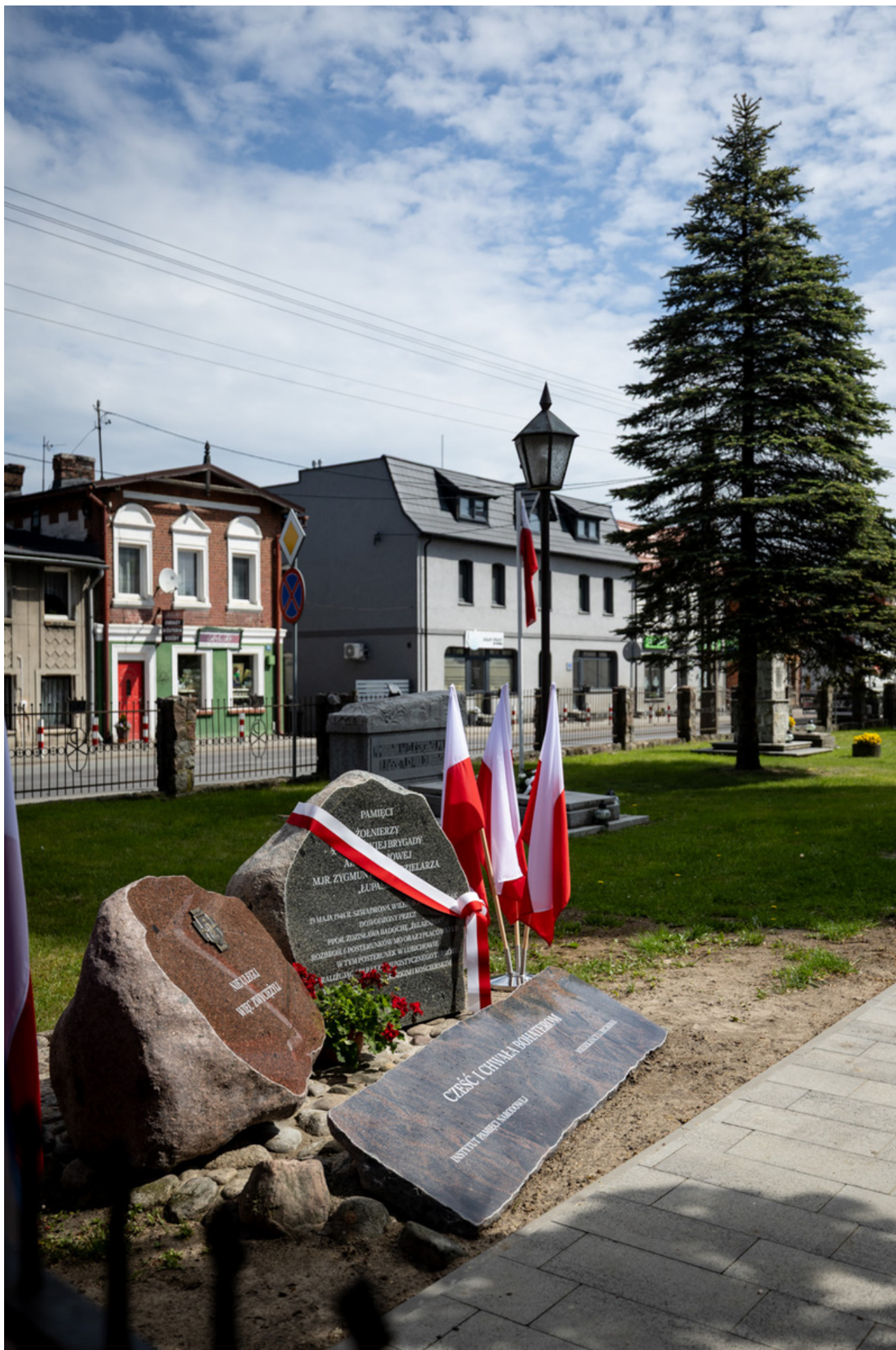
„Nie ulegli, więc zwyciężyli” — uroczystość odsłonięcia odrestaurowanego pomnika 5. Wileńskiej Brygady AK w