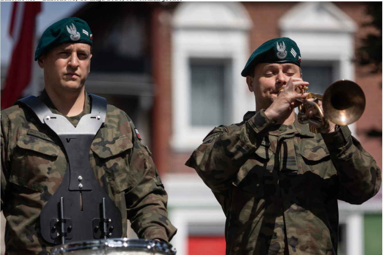
„Nie ulegli, więc zwyciężyli” — uroczystość odsłonięcia odrestaurowanego pomnika 5. Wileńskiej Brygady AK w Lubichowie - Lubichowo, 19 maja 2026, fot. Roman Jocher