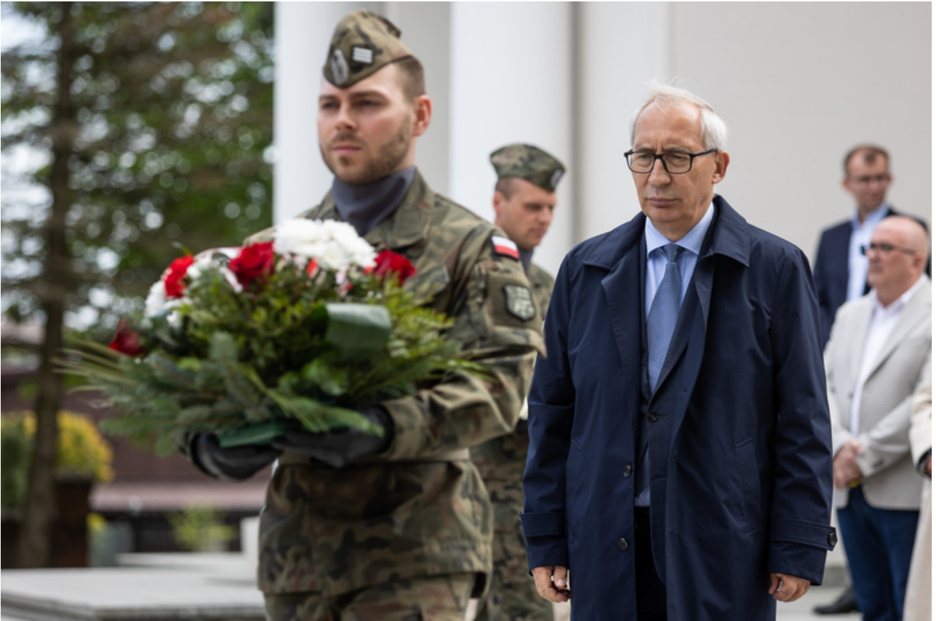
„Nie ulegli, więc zwyciężyli” — uroczystość odsłonięcia odrestaurowanego pomnika 5. Wileńskiej Brygady AK w Lubichowie - Lubichowo, 19 maja 2026, fot.. Roman Jocher