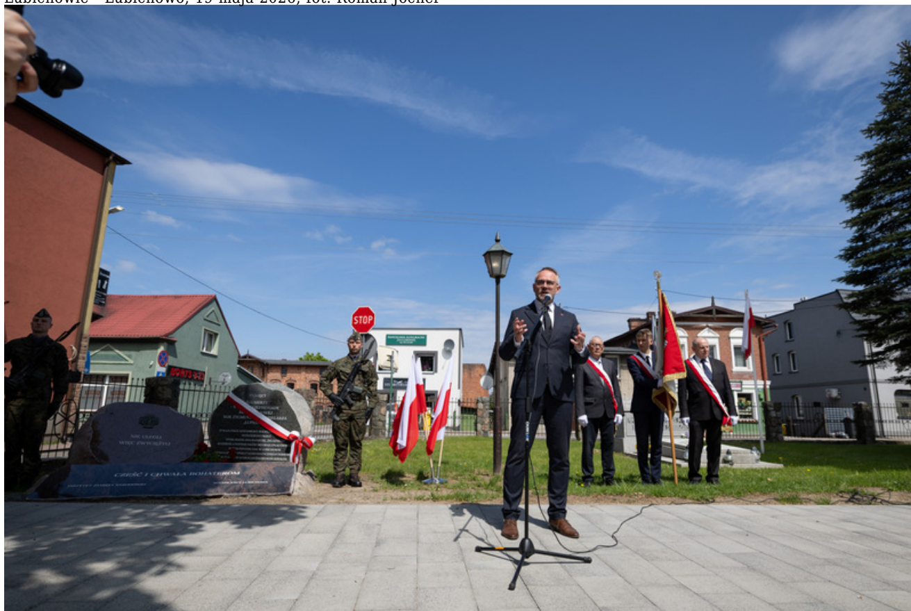
„Nie ulegli, więc zwyciężyli” — uroczystość odsłonięcia odrestaurowanego pomnika 5. Wileńskiej Brygady AK w Lubichowie - Lubichowo, 19 maja 2026