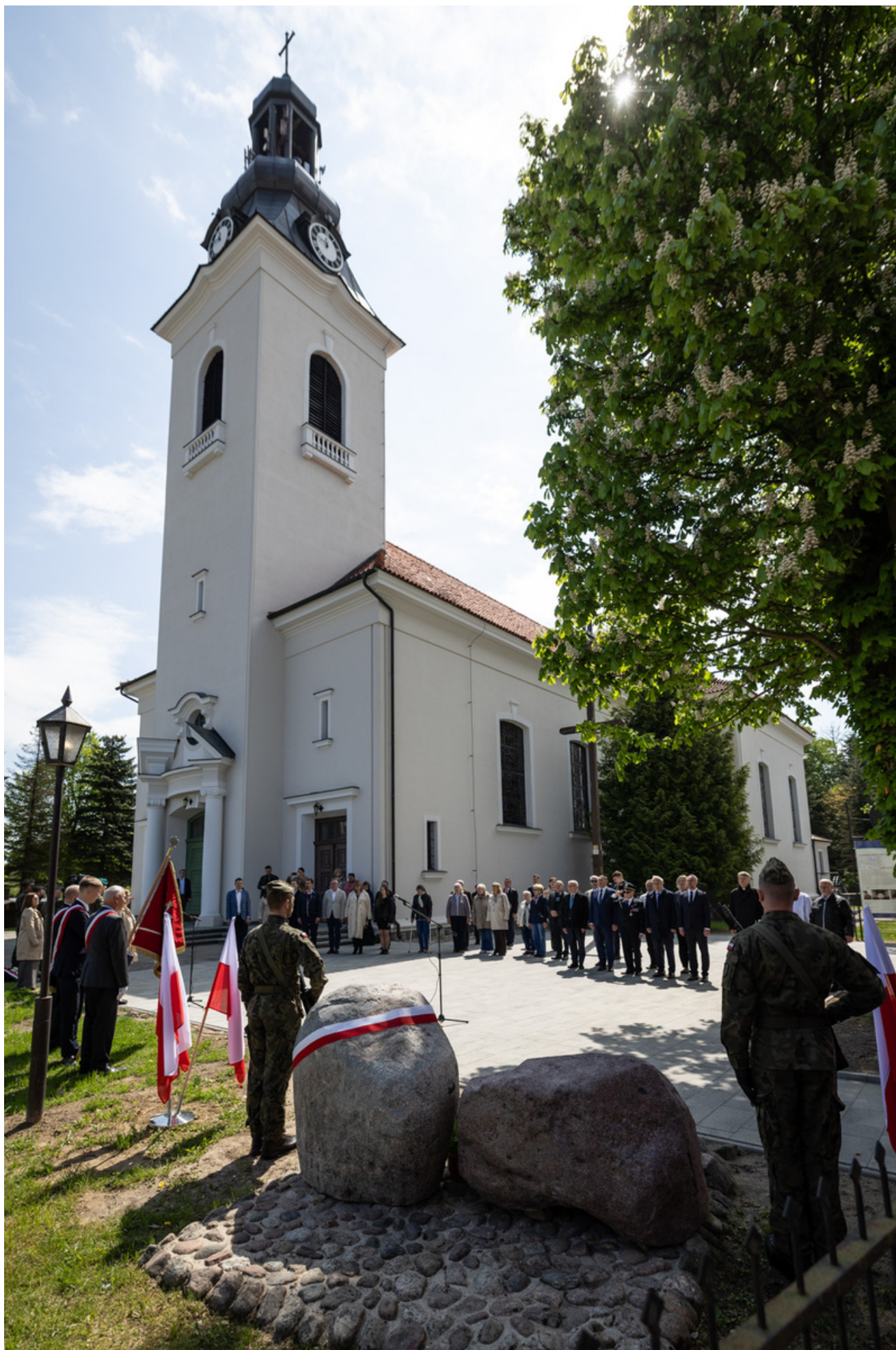
„Nie ulegli, więc zwyciężyli” — uroczystość odsłonięcia odrestaurowanego pomnika 5. Wileńskiej Brygady AK w