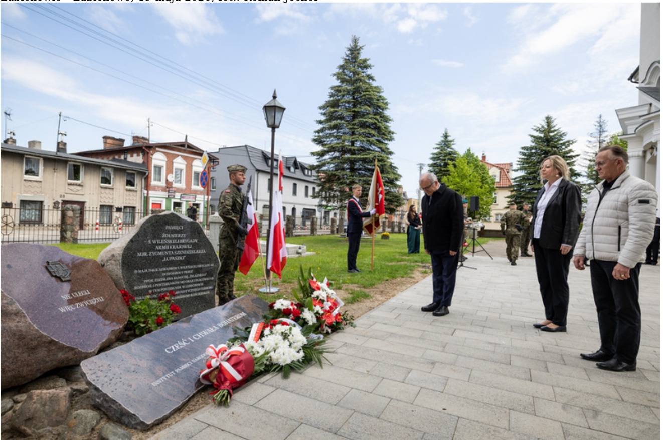
„Nie ulegli, więc zwyciężyli” — uroczystość odsłonięcia odrestaurowanego pomnika 5. Wileńskiej Brygady AK w Lubichowie - Lubichowo, 19 maja 2026