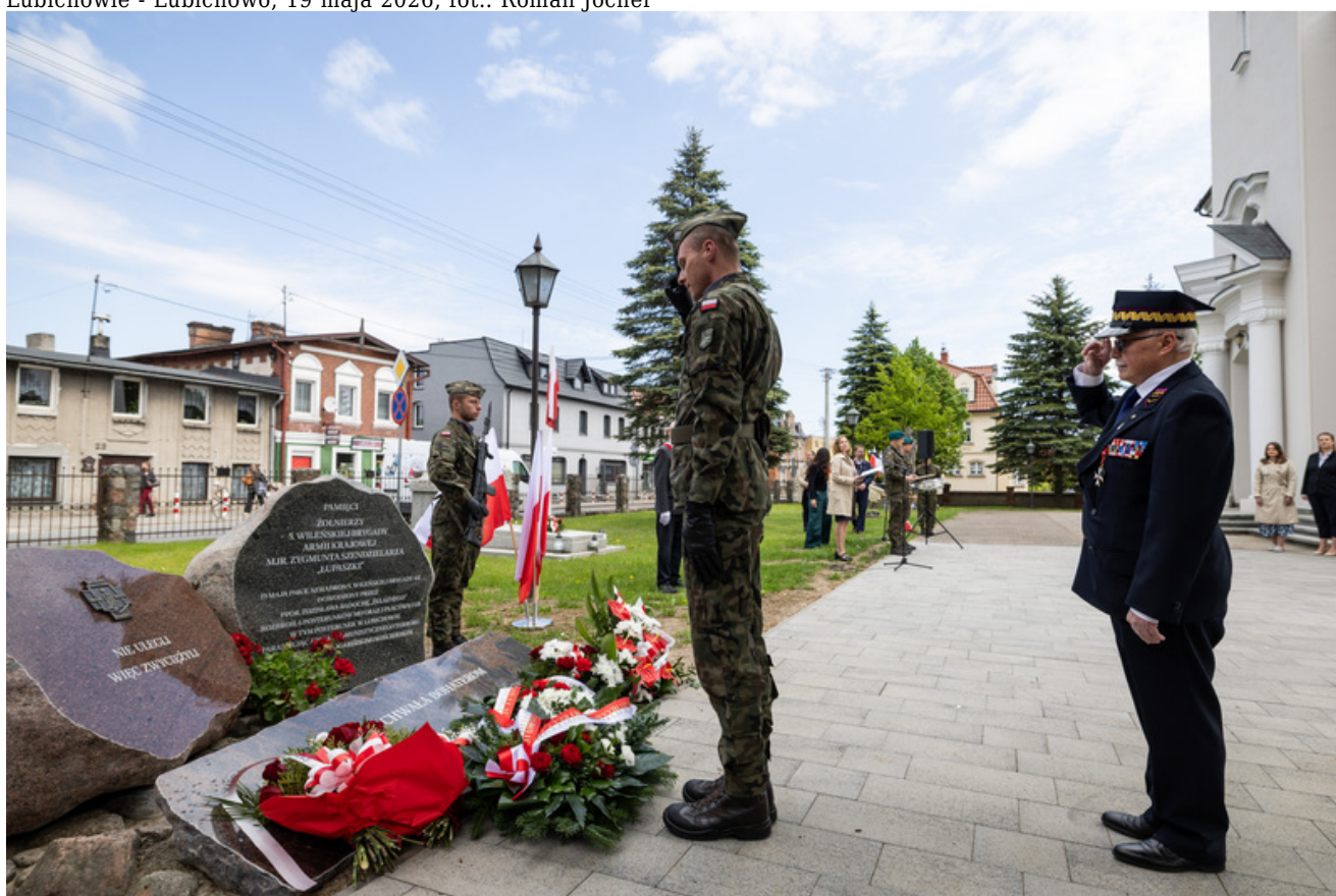
„Nie ulegli, więc zwyciężyli” — uroczystość odsłonięcia odrestaurowanego pomnika 5. Wileńskiej Brygady AK w Lubichowie - Lubichowo, 19 maja 2026