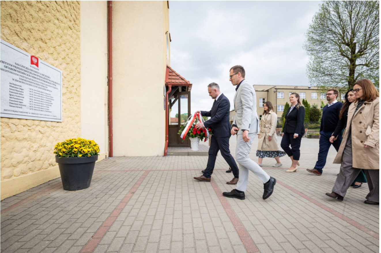
„Nie ulegli, więc zwyciężyli” — uroczystość odsłonięcia odrestaurowanego pomnika 5. Wileńskiej Brygady AK w Lubichowie - Lubichowo, 19 maja 2026