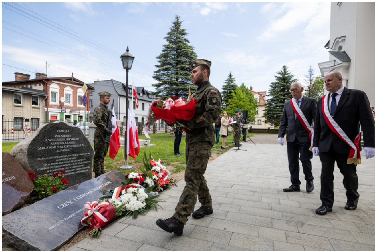
„Nie ulegli, więc zwyciężyli” — uroczystość odsłonięcia odrestaurowanego pomnika 5. Wileńskiej Brygady AK w Lubichowie - Lubichowo, 19 maja 2026, fot.. Roman Jocher