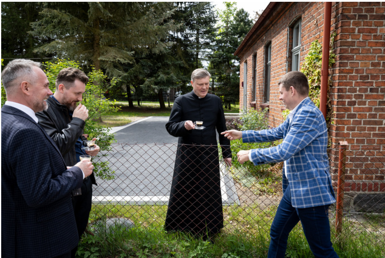
„Nie ulegli, więc zwyciężyli” — uroczystość odsłonięcia odrestaurowanego pomnika 5. Wileńskiej Brygady AK w Lubichowie - Lubichowo, 19 maja 2026

Obchody rozpoczęły się Mszą świętą w kościele pw. św. Jakuba Apostoła w Lubichowie. Następnie uczestnicy uroczystości zgromadzili się przy pomniku, gdzie po odegraniu Hymnu Rzeczypospolitej Polskiej rozpoczęła się oficjalna część wydarzenia.