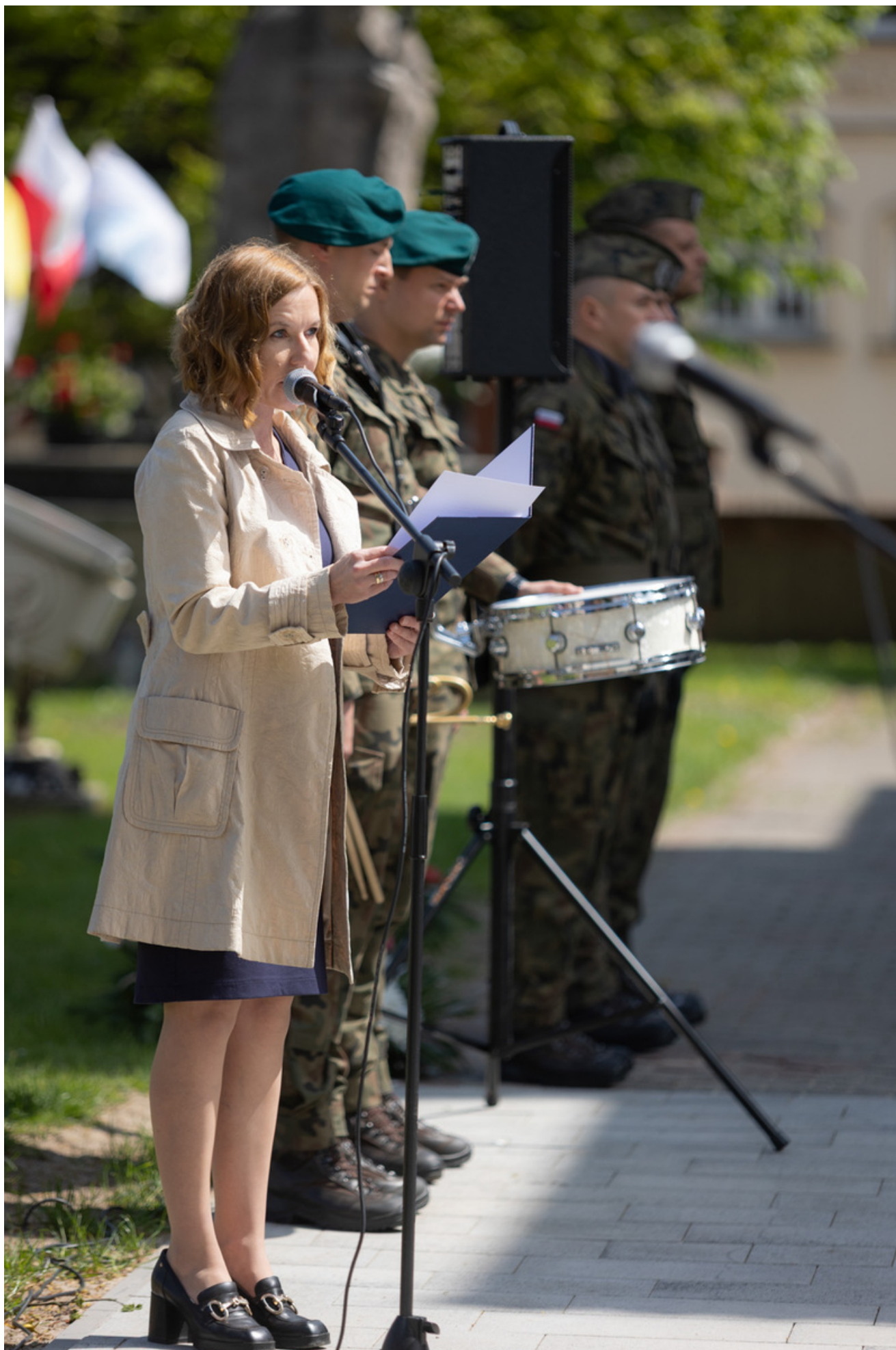
„Nie ulegli, więc zwyciężyli” — uroczystość odsłonięcia odrestaurowanego pomnika 5. Wileńskiej Brygady AK w