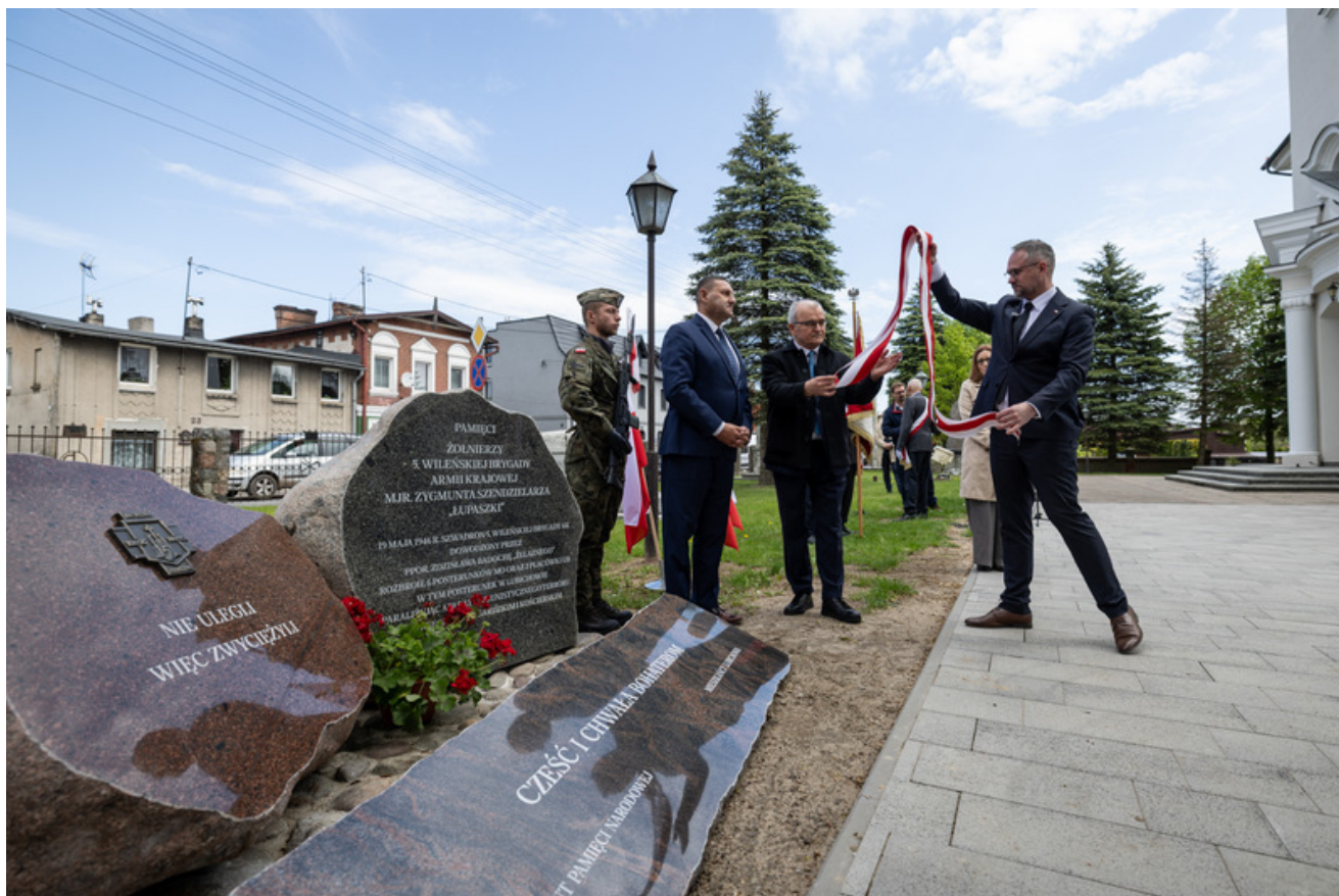
„Nie ulegli, więc zwyciężyli” — uroczystość odsłonięcia odrestaurowanego pomnika 5. Wileńskiej Brygady AK w Lubichowie - Lubichowo, 19 maja 2026, fot. Roman Jocher