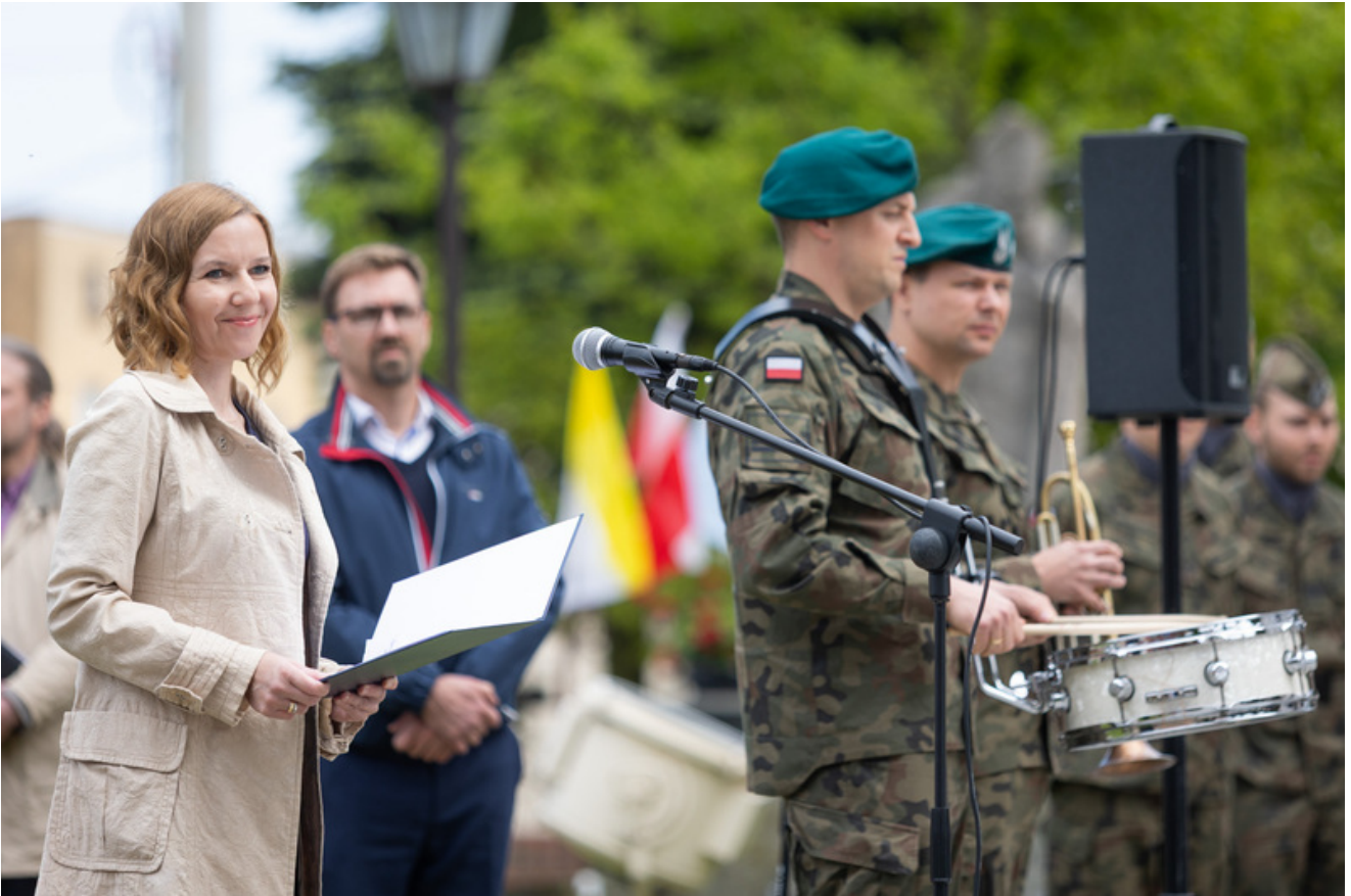
„Nie ulegli, więc zwyciężyli” — uroczystość odsłonięcia odrestaurowanego pomnika 5. Wileńskiej Brygady AK w Lubichowie - Lubichowo, 19 maja 2026