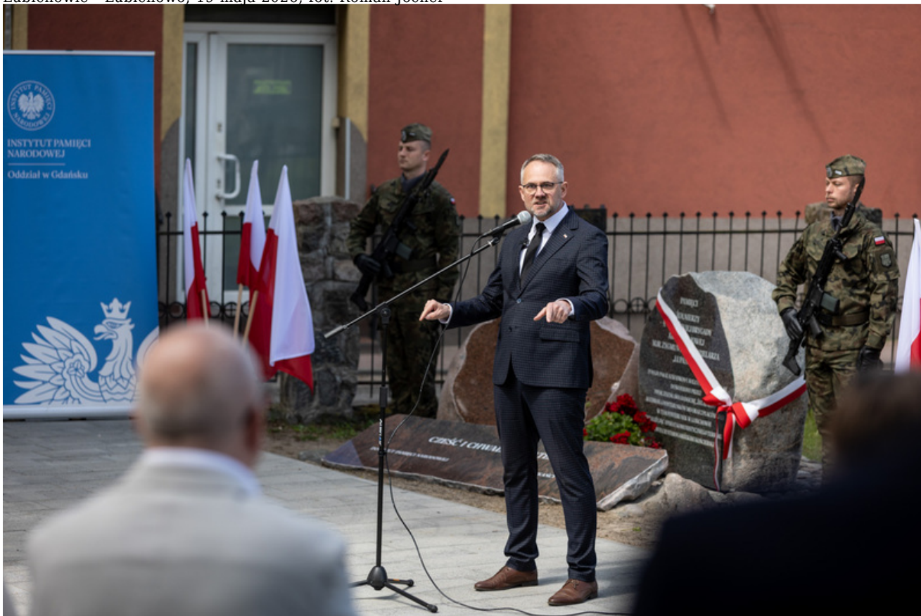
„Nie ulegli, więc zwyciężyli” — uroczystość odsłonięcia odrestaurowanego pomnika 5. Wileńskiej Brygady AK w Lubichowie - Lubichowo, 19 maja 2026