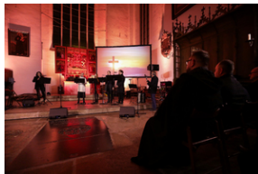
ANTIDOTUM - rzecz o księdzu Blachnickim - Gdańsk, 22-23 marca 2024