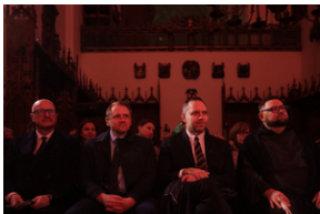
ANTIDOTUM - rzecz o księdzu Blachnickim - Gdańsk, 22-23 marca 2024

Prezes IPN dodał, że Instytut Pamięci Narodowej jest od tego, aby mówić, niezależnie od zmieniających się okoliczności, o prawdzie o historii narodu i państwa polskiego w XX wieku.