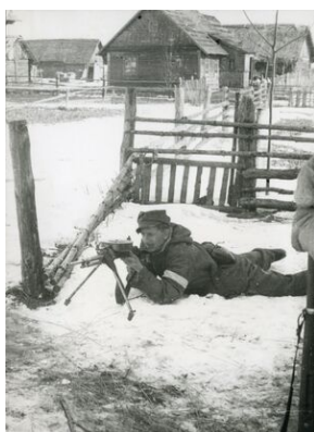
Żołnierz 3 Brygady ps. „Mars”