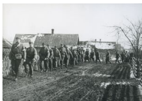
Wymarsz żołnierzy 3 Brygady prawdopodobnie z Tabońszek