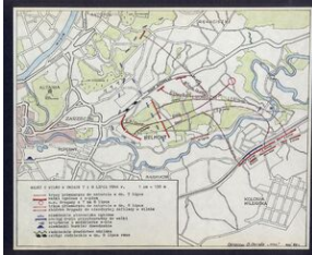
Mapa walk 3 Brygady o Wilno w dniach 7-8 lipca 1944 r.