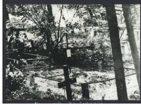
Zbiorowy grób żołnierzy 3 Brygady w Kolonii Wileńskiej