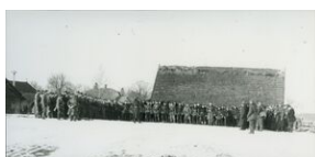
Żołnierze 3 Brygady przed wymarszem na Troki