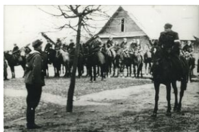
Zbiórka oddziału konnego 3 Brygady

Album zawiera biogram kapitana Gracjana Froga, liczne fotografie przedstawiające żołnierzy Brygady, ich służbę i działania bojowe, kopie map ilustrujących akcje przeprowadzane przez Brygadę, a także tablice pamiątkowe poświęcone żołnierzom.