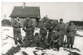
Żołnierze 3 Brygady ps. „Zorian”, „Brzoza”, „Mars”, „Pantera”, „Juhas”