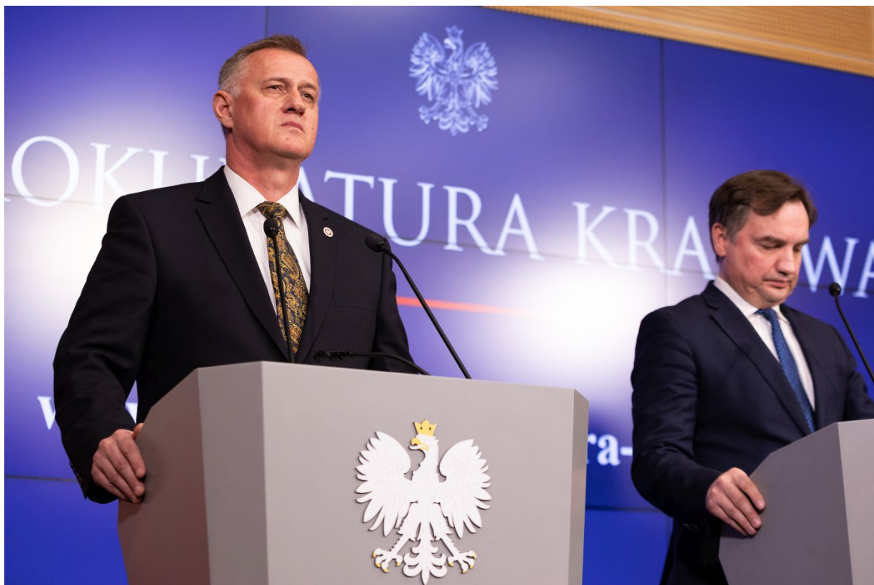
Konferencja prasowa w sprawie śledztwa dotyczącego śmierci ks. Franciszka Błachnickiego - Warszawa, 14 marca 2023.