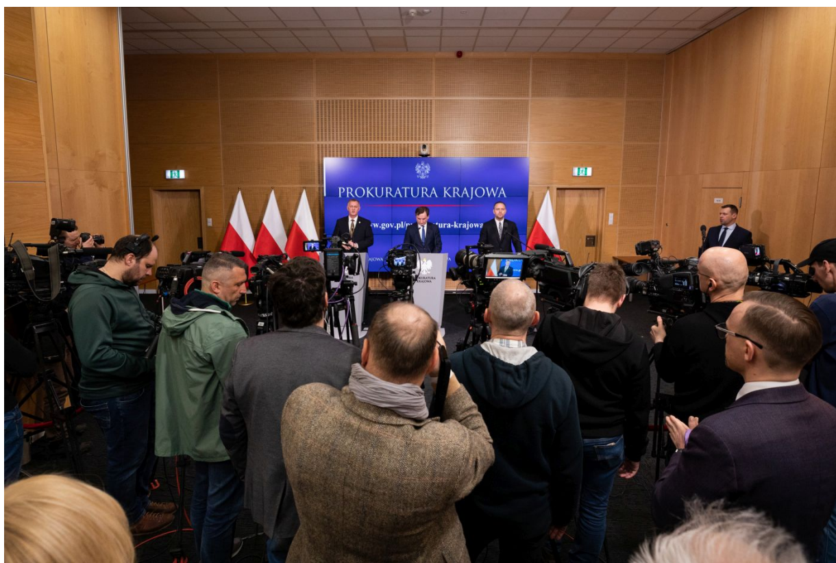
Konferencja prasowa w sprawie śledztwa dotyczącego śmierci ks. Franciszka Błachnickiego - Warszawa, 14 marca 2023.