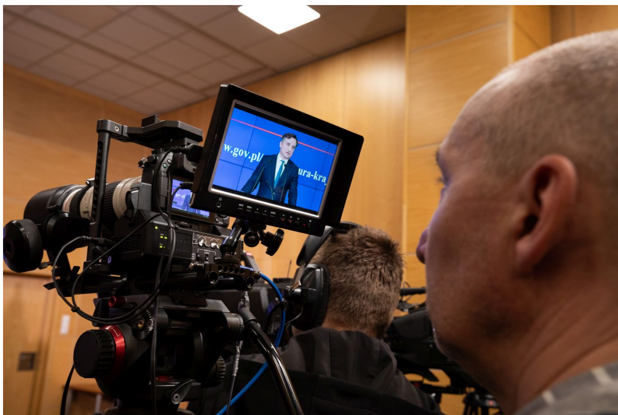
Konferencja prasowa w sprawie śledztwa dotyczącego śmierci ks. Franciszka Błachnickiego - Warszawa, 14 marca 2023.