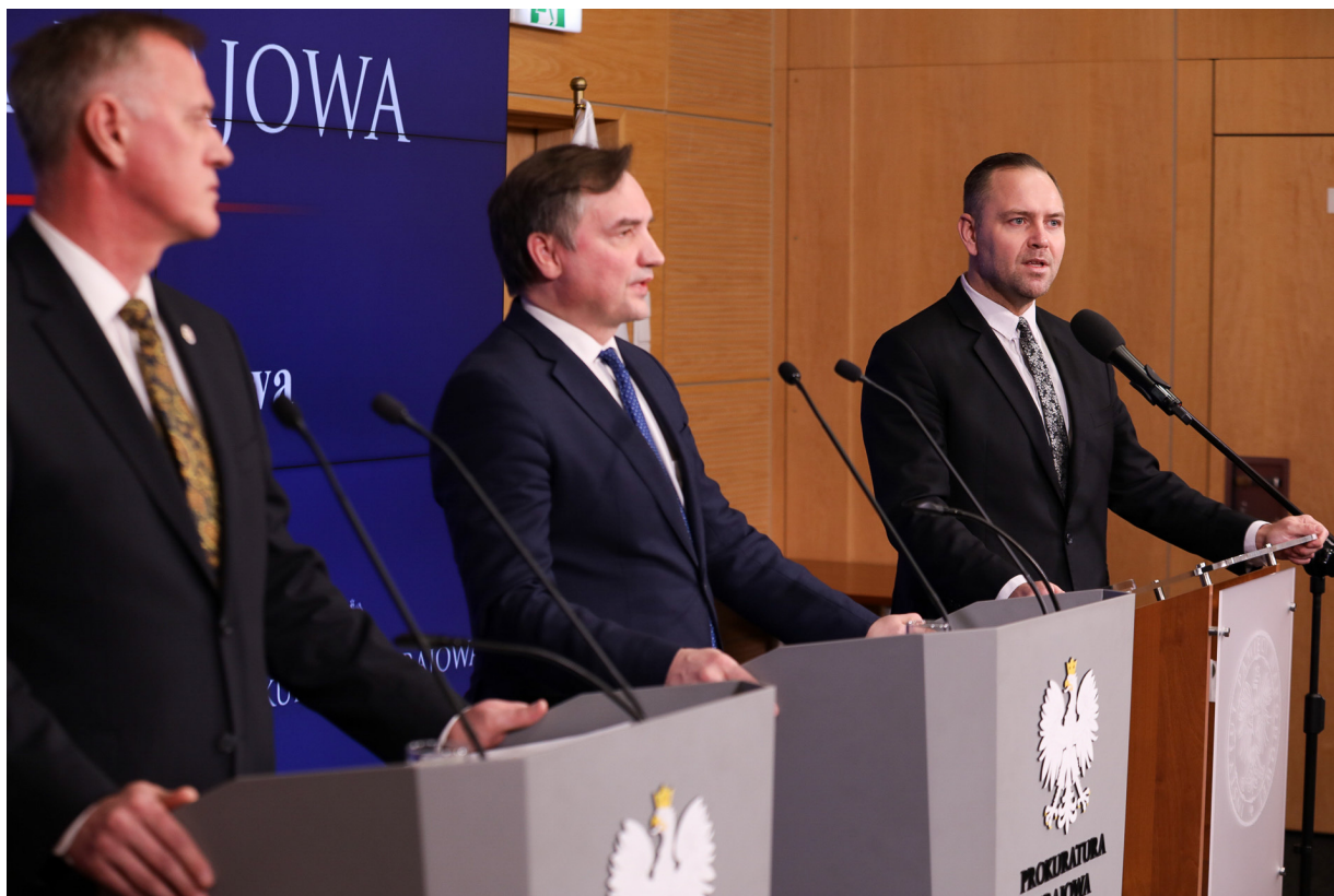
Konferencja prasowa w sprawie śledztwa dotyczącego śmierci ks. Franciszka Błachnickiego - Warszawa, 14 marca 2023.