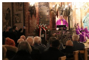
Serce dla „Inki”. Kościół św. Brygidy w Gdańsku