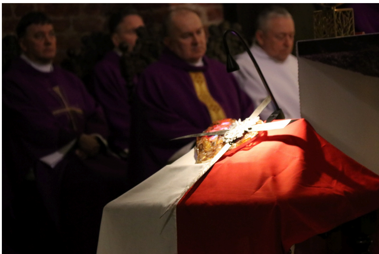
Serce dla „Inki”. Kościół św. Brygidy w Gdańsku

W Gdańsku odbyły się uroczystości Narodowego Dnia Pamięci „Żołnierzy Wyklętych” z udziałem delegacji Oddziału IPN w Gdańsku.