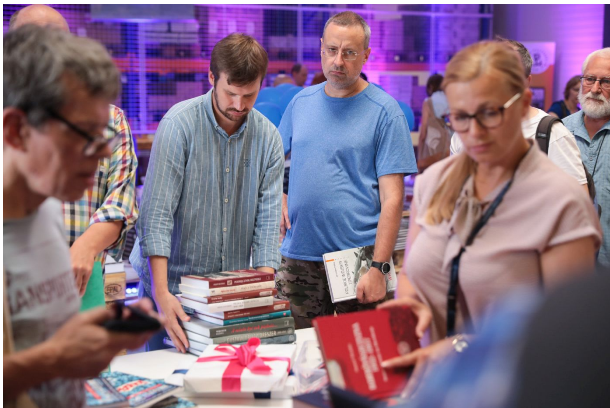
Dni Wydawnictwa IPN – Warszawa, 20 sierpnia 2022.