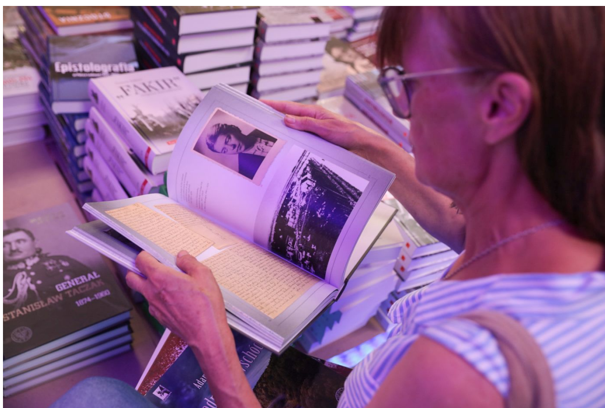
Dni Wydawnictwa IPN – Warszawa, 20 sierpnia 2022.