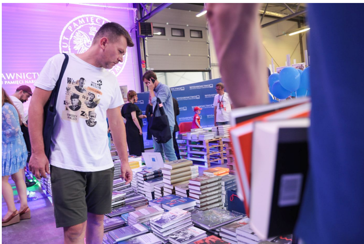
Dni Wydawnictwa IPN – Warszawa, 20 sierpnia 2022.