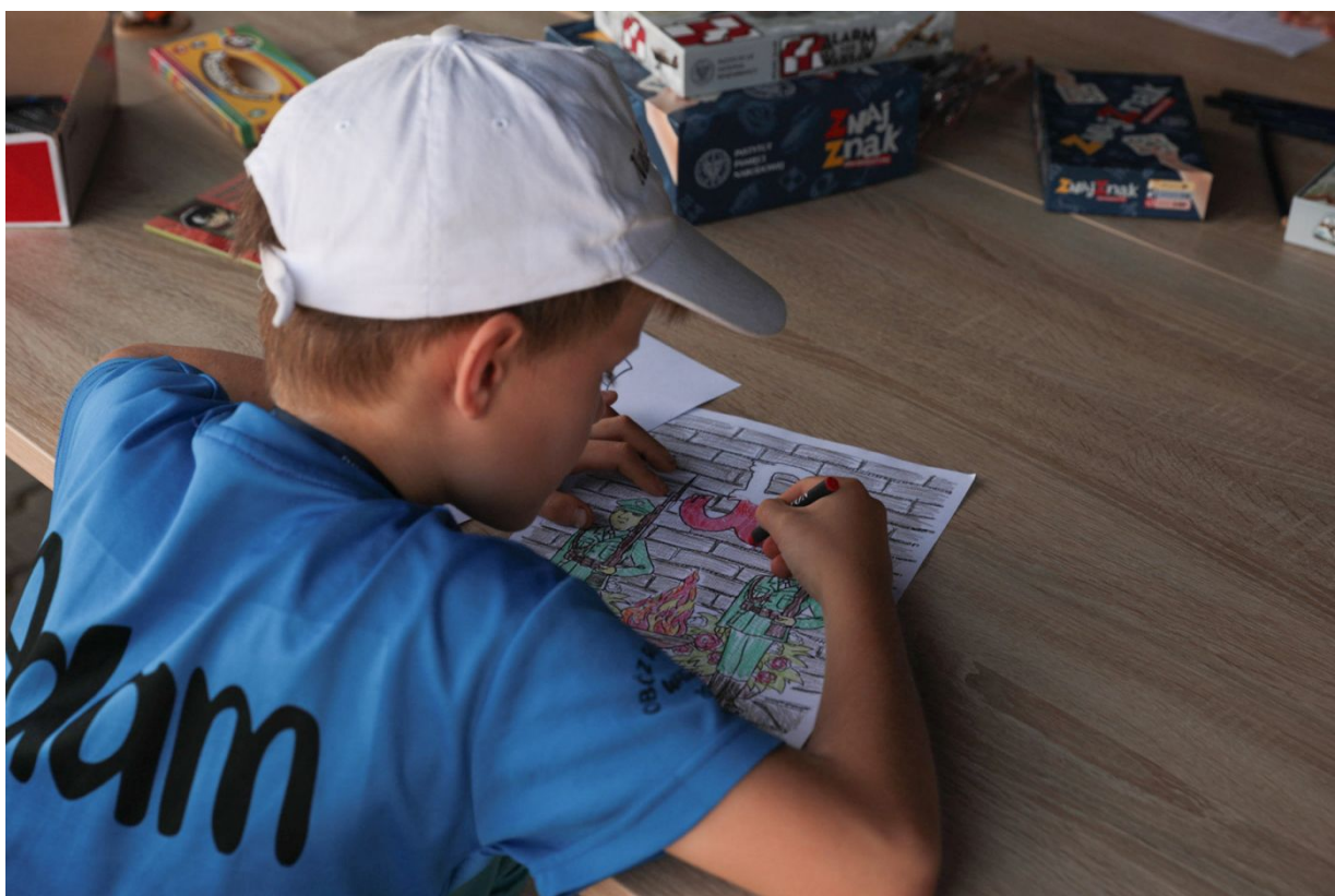
Dni Wydawnictwa IPN – Warszawa, 20 sierpnia 2022.