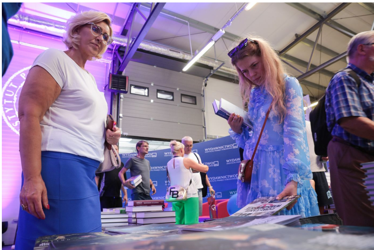
Dni Wydawnictwa IPN – Warszawa, 20 sierpnia 2022.