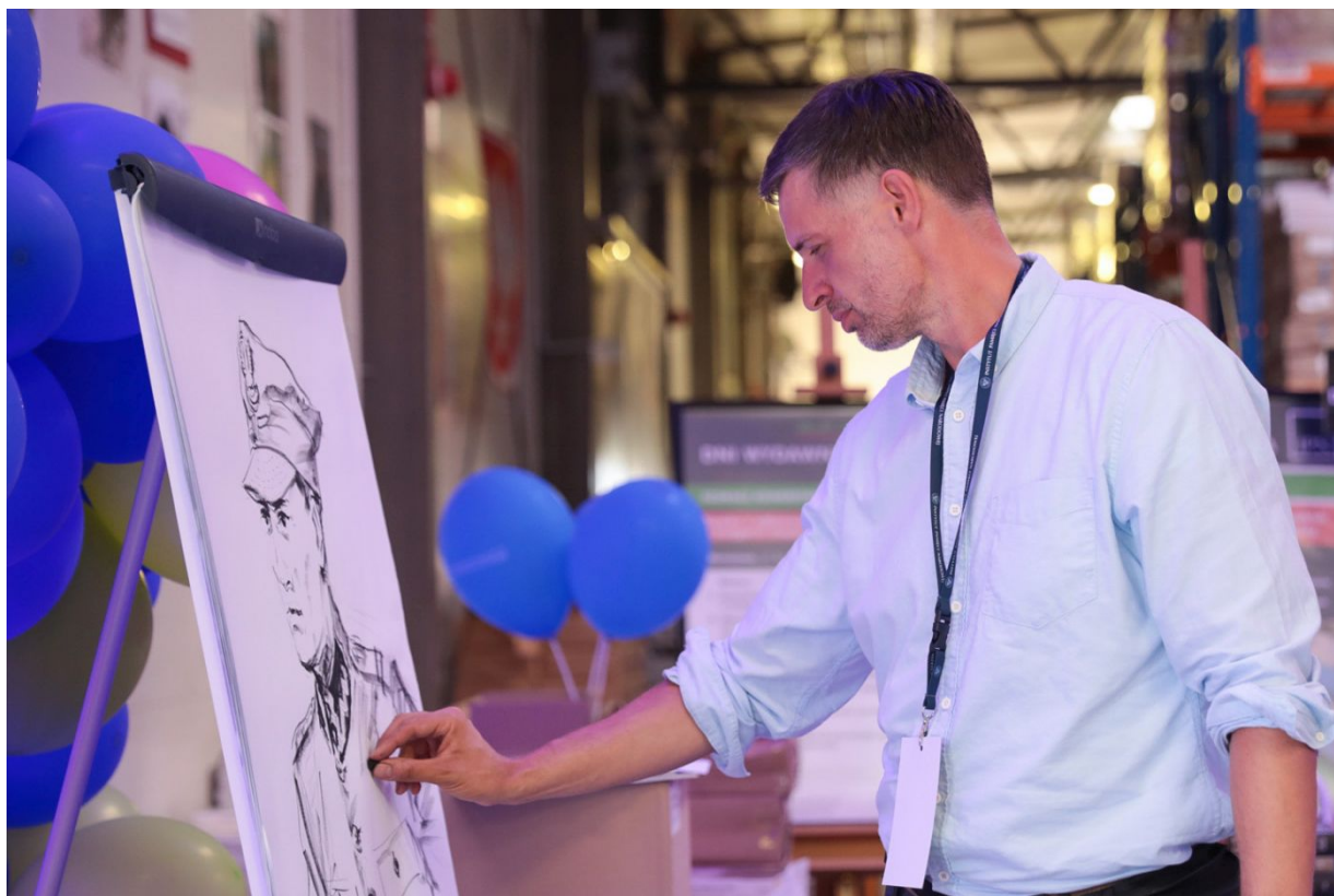
Dni Wydawnictwa IPN – Warszawa, 20 sierpnia 2022.