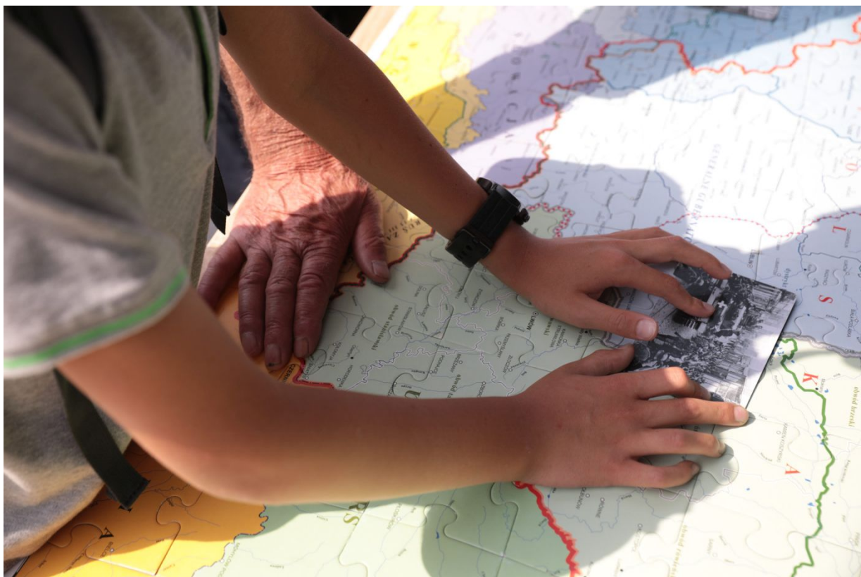
Dni Wydawnictwa IPN – Warszawa, 20 sierpnia 2022.