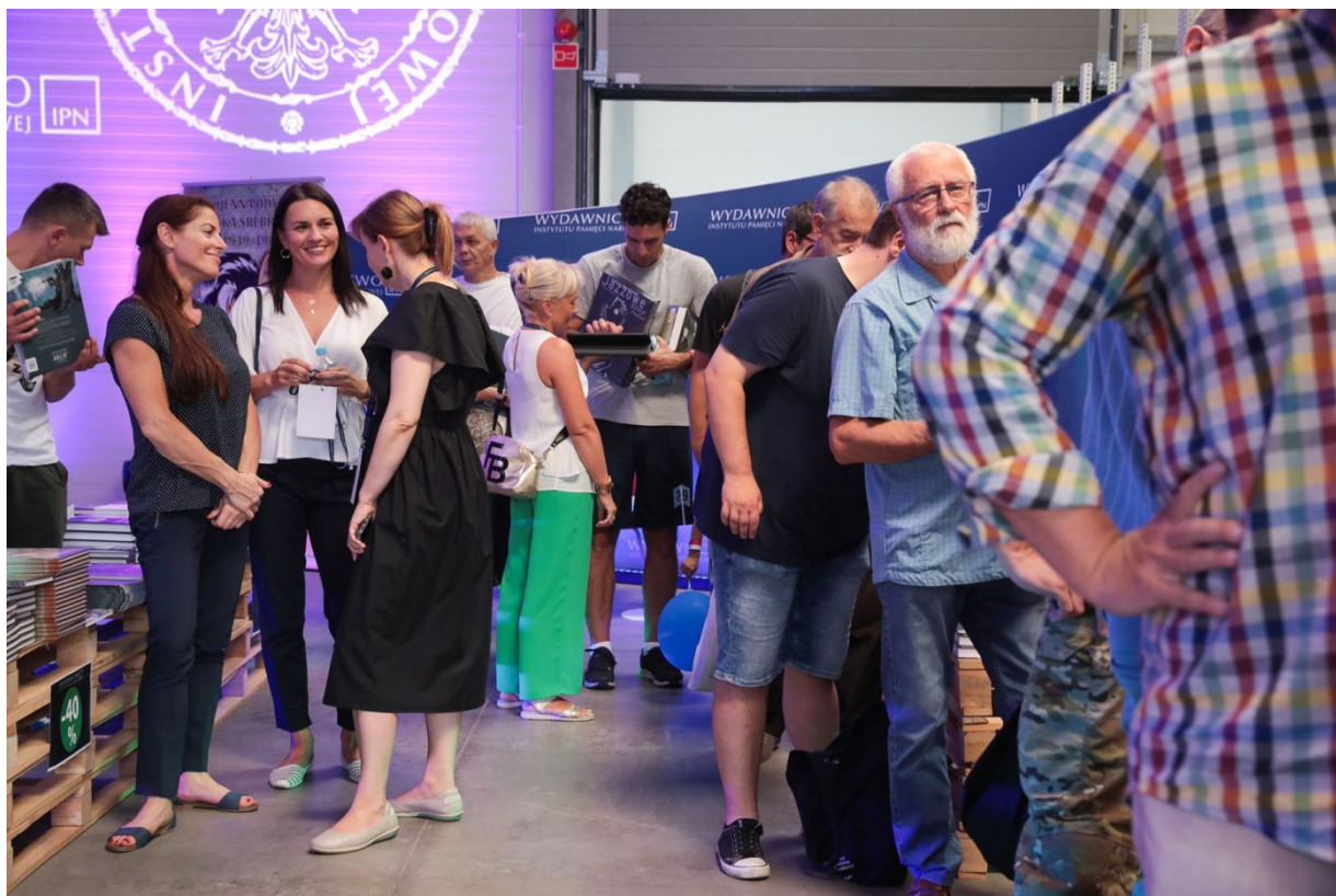
Dni Wydawnictwa IPN – Warszawa, 20 sierpnia 2022.