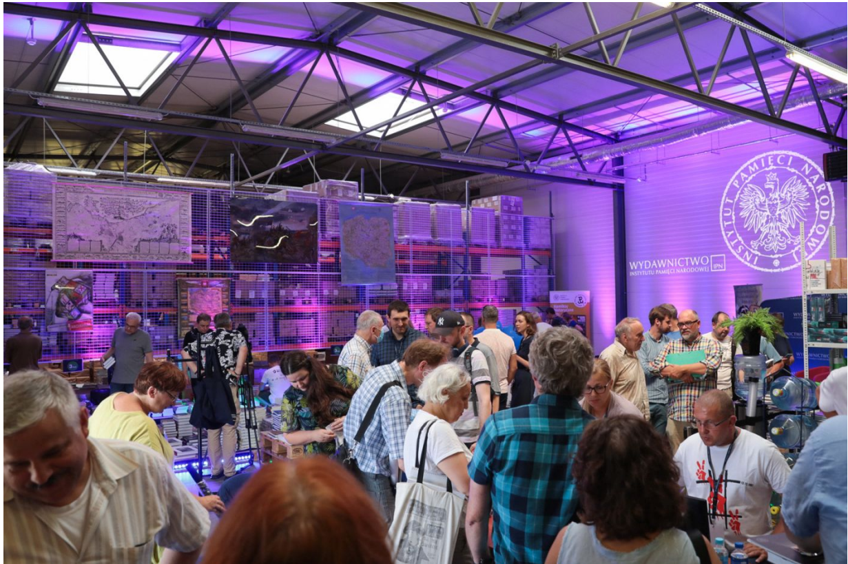
Dni Wydawnictwa IPN – Warszawa, 20 sierpnia 2022.

Wielka wyprzedaż połączona ze spotkaniami z autorami, wystawami, kinem plenerowym i innymi atrakcjami to pierwsze tego typu wydarzenie w historii działalności Instytutu Pamięci Narodowej.