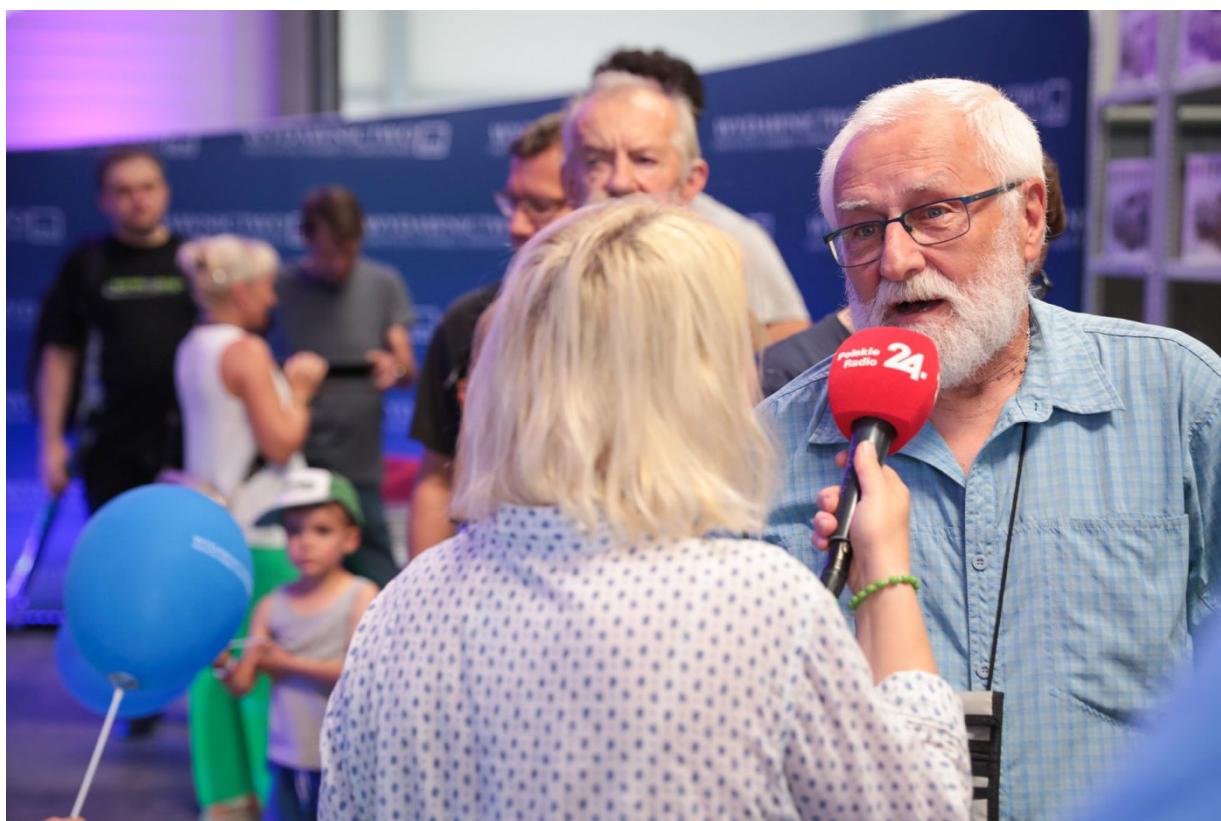
Dni Wydawnictwa IPN – Warszawa, 20 sierpnia 2022.