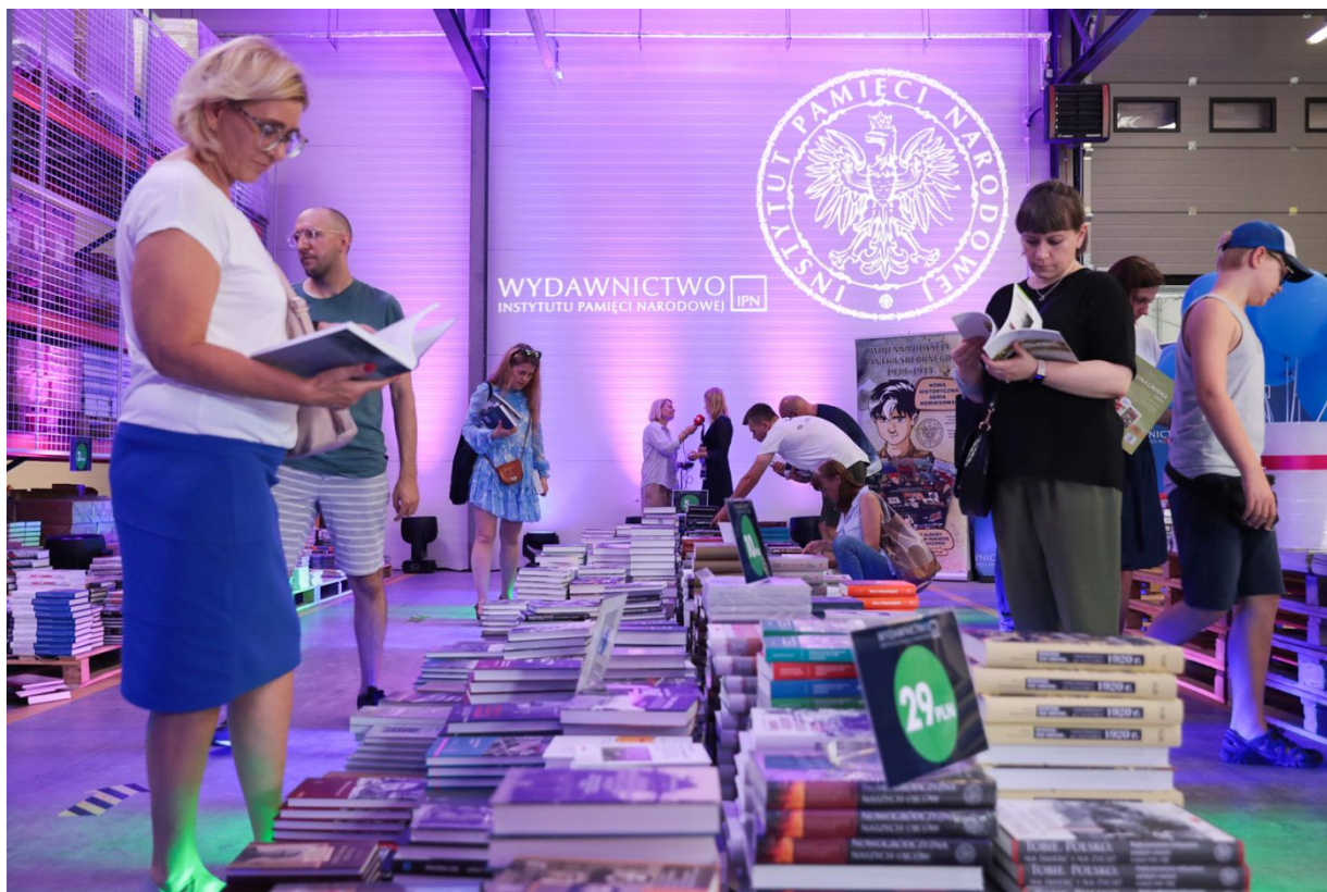
Dni Wydawnictwa IPN – Warszawa, 20 sierpnia 2022.