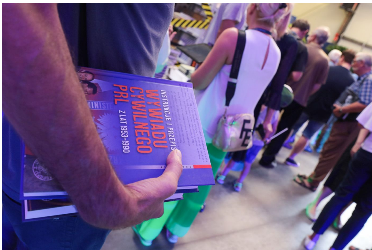
Dni Wydawnictwa IPN – Warszawa, 20 sierpnia 2022.