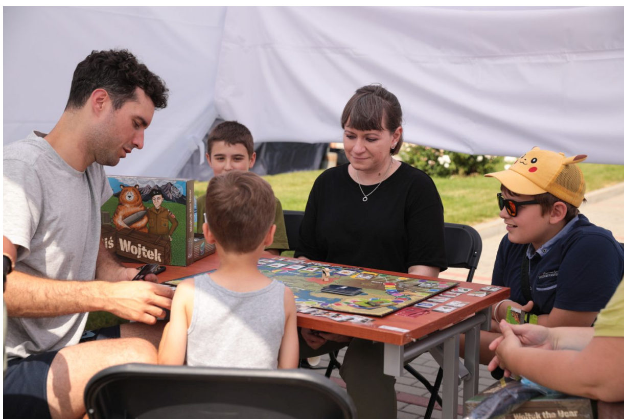
Dni Wydawnictwa IPN – Warszawa, 20 sierpnia 2022.