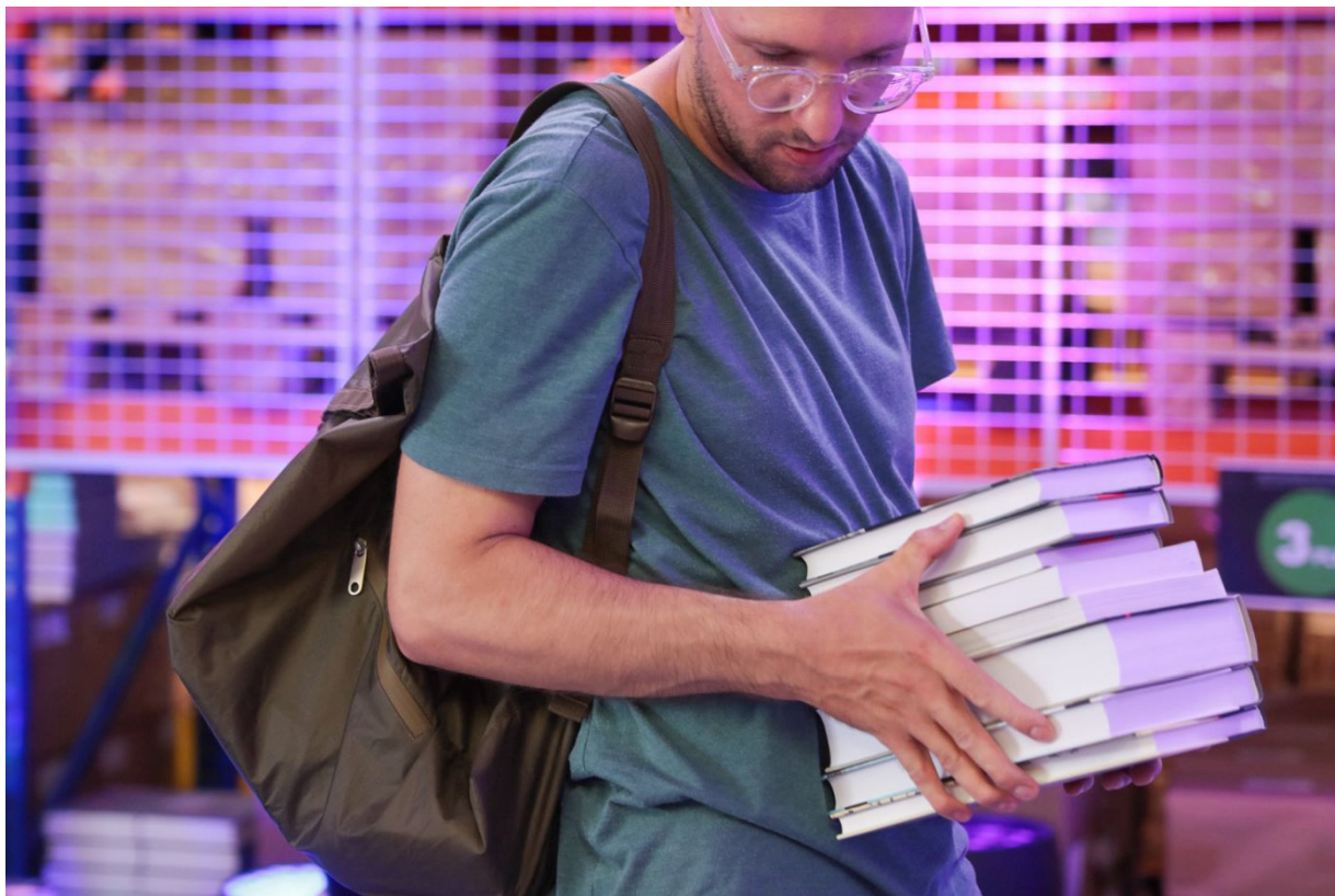
Dni Wydawnictwa IPN – Warszawa, 20 sierpnia 2022.

Inauguracja wydarzenia odbyła się w sobotę 20 sierpnia 2022 r. Tego dnia w magazynie centralnym w Warszawie oraz w 8 oddziałach IPN w Polsce rozpoczęliśmy wielkie święto książki. Była to okazja do zakupu naszych wydawnictw, ale też do międzypokoleniowych rozmów o przeszłości, dla pasjonatów historii, jak i najmłodszych gości.