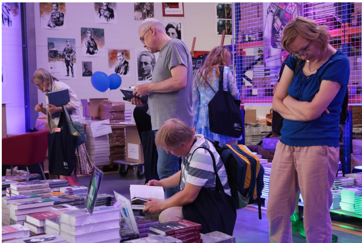
Dni Wydawnictwa IPN – Warszawa, 20 sierpnia 2022.