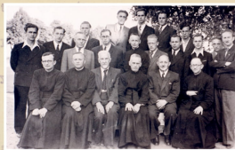
Nauczyciele i absolwenci Społecznej Gimnazjum i Liceum ZNP w Gdyni-Orłowie – 1947 r.