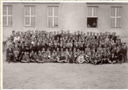
Uczniowie Prywatnego Gimnazjum Męskiego o.o. Jezuitów w Gdyni-Orłowie lata 1945-1946

Oddziałowe Biuro Upamiętniania Walk i Męczeństwa Instytutu Pamięi Narodowej Al. Grunwaldzka 216, 80-266 Gdynia e-mail: obowim.gdynia@ipn.gov.pl www.ipn.gov.pl