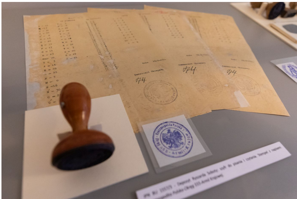
Archiwalia z zasobu IPN dokumentujące czyn zbrojny Armii Krajowej prezentowane w Centralnym Przystanku Historia.