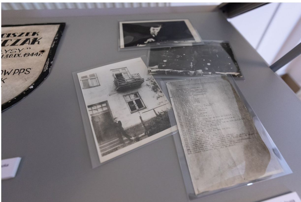
Archiwalia z zasobu IPN dokumentujące czyn zbrojny Armii Krajowej prezentowane w Centralnym Przystanku Historia.