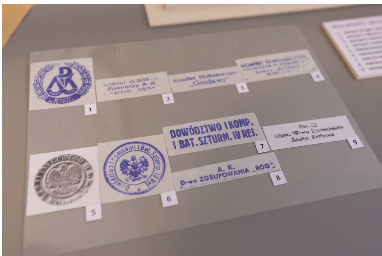
Archiwalia z zasobu IPN dokumentujące czyn zbrojny Armii Krajowej prezentowane w Centralnym Przystanku Historia.