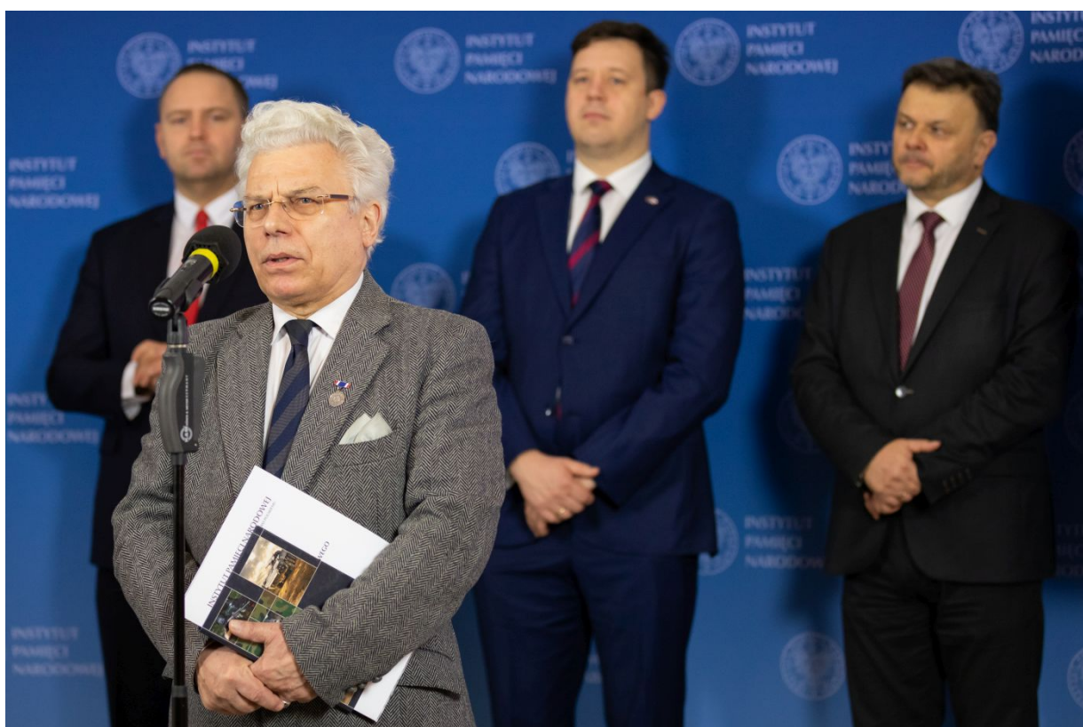
Konferencja prasowa związana z obchodami 80. rocznicy przemianowania ZWZ na AK - Warszawa, 10 lutego 2022.