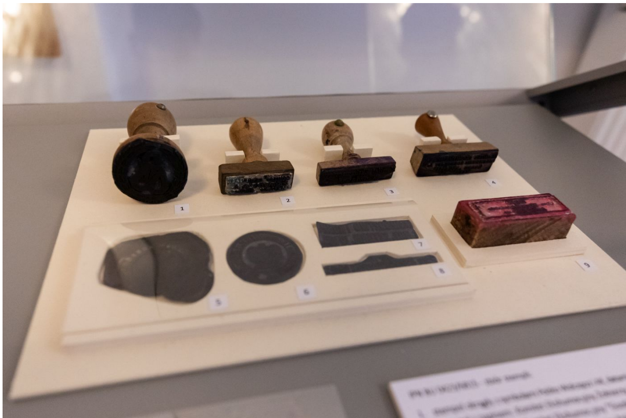
Archiwalia z zasobu IPN dokumentujące czyn zbrojny Armii Krajowej prezentowane w Centralnym Przystanku Historia.