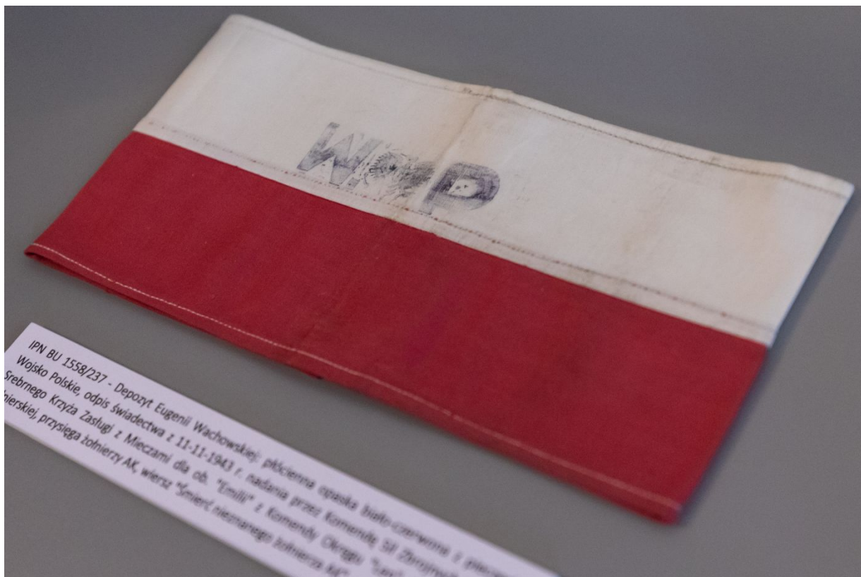
Archiwalia z zasobu IPN dokumentujące czyn zbrojny Armii Krajowej prezentowane w Centralnym Przystanku Historia.

- I tak trwają te trzy: wiara, wiara w zwycięstwo, wiara w niepodległość, wiara w suwerenność, wiara w niepodległość, nadzieja, nadzieja na pokonanie niemieckiego barbarzyństwa, na pokonanie przerażającej okupacji i miłość. Z nich najważniejsza jest miłość. I to z miłości do Polski powstała Armia Krajowa - największa podziemna armia świata, która w szczytowym momencie skupiała blisko 400 tysięcy konspiratorów na okupowanych terenach Rzeczypospolitej - powiedział prezes IPN dr Karol Nawrocki.