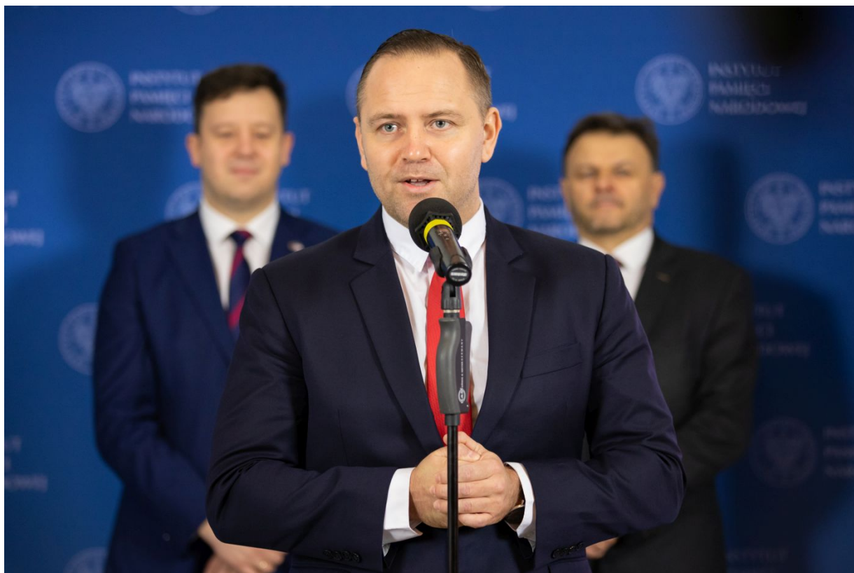
Prezes IPN dr Karol Nawrocki podczas konferencji prasowej związanej z obchodami 80. rocznicy przemianowania ZWZ na AK - Warszawa, 10 lutego 2022.