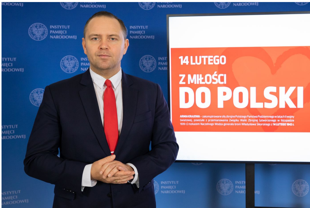
Prezes IPN dr Karol Nawrocki podczas konferencji prasowej związanej z obchodami 80. rocznicy przemianowania ZWZ na AK – Warszawa, 10 lutego 2022.