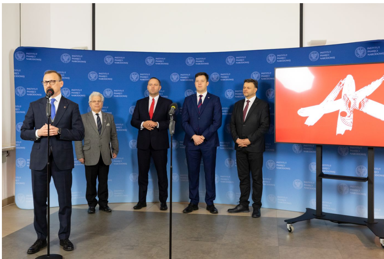
Konferencja prasowa związana z obchodami 80. rocznicy przemianowania ZWZ na AK - Warszawa, 10 lutego 2022.

Z okazji 80. rocznicy przemianowania Związku Walki Zbrojnej na Armię Krajową w Instytucie Pamięci Narodowej odbyła się konferencja prasowa z udziałem prezesa IPN dr. Karola Nawrockiego, w czasie której zostały zaprezentowane przedsięwzięcia przygotowane przez Instytut upamiętniające największą podziemną armię Europy.