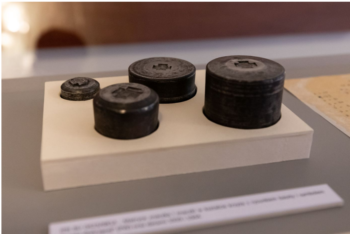
Archiwalia z zasobu IPN dokumentujące czyn zbrojny Armii Krajowej prezentowane w Centralnym Przystanku Historia.