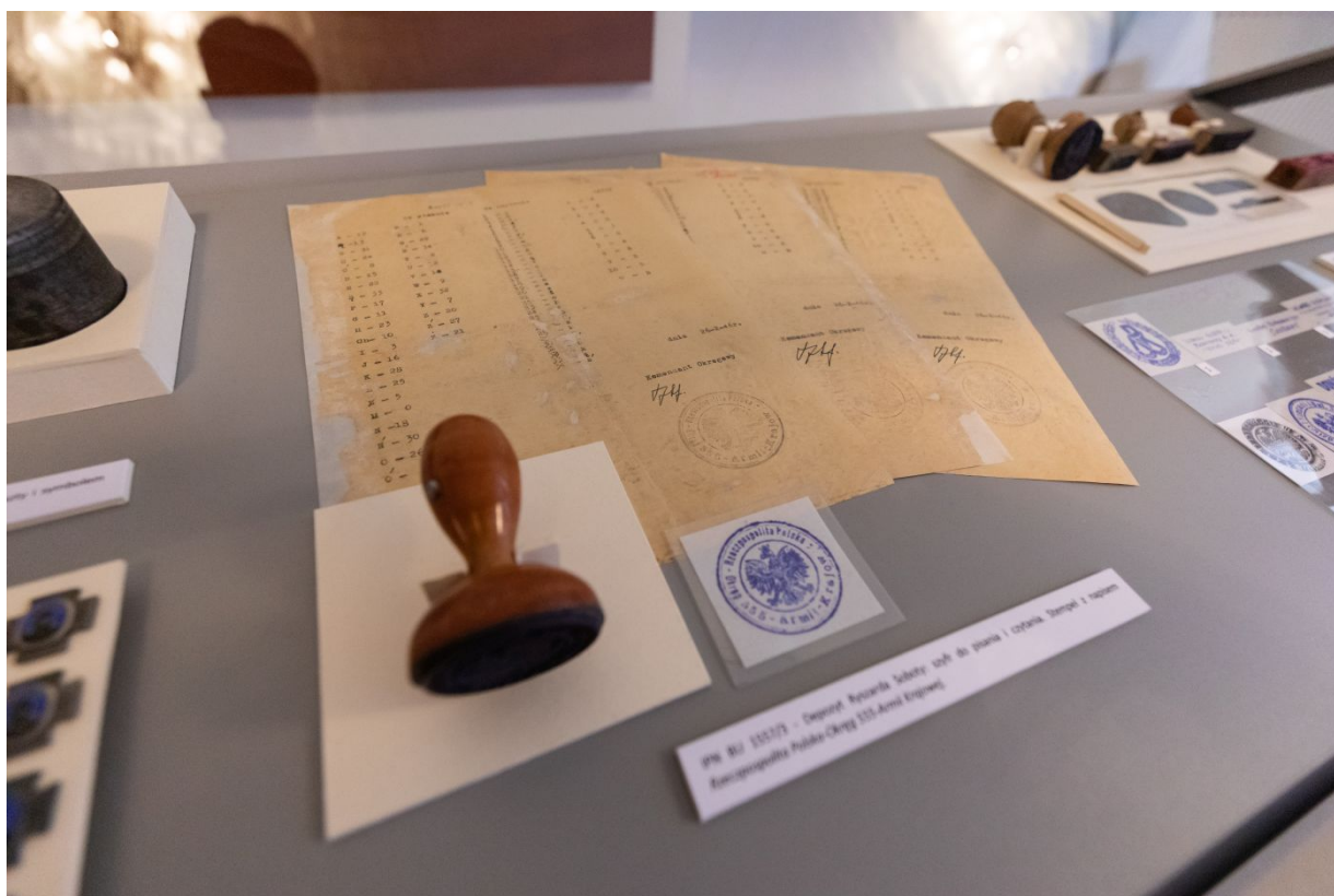
Archiwalia z zasobu IPN dokumentujące czyn zbrojny Armii Krajowej prezentowane w Centralnym Przystanku Historia.