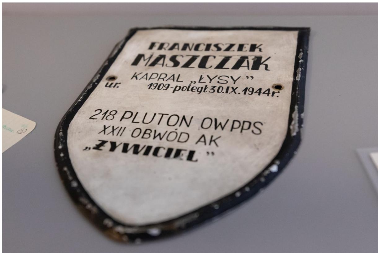
Archiwalia z zasobu IPN dokumentujące czyn zbrojny Armii Krajowej prezentowane w Centralnym Przystanku Historia.