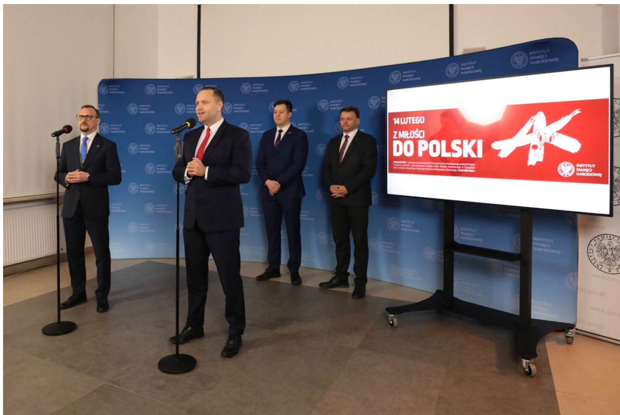
Konferencja prasowa związana z obchodami 80. rocznicy przemianowania ZWZ na AK - Warszawa, 10 lutego 2022.