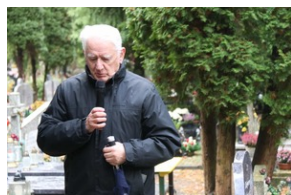
Krzysztof Wyszkowski, działacz opozycji antykomunistycznej, przedstawiciel Kolegium IPN