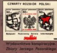
Wydawnictwa kompirowane.

Ekspozycja prezentuje historię Wojskowych Obozów Internowania. W WOI umieszczono opozycjonistów z 35 ówczesnych województw. Internowania pod pozorem „ćwiczeń