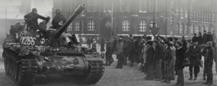
Czołgi w rejonie Stoczni Gdańskiej, 13 grudnia 1981 r.