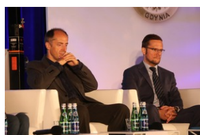
Debata „Walka o pamięć. Dorobek i spuścizna NSZZ Solidarność”. #2