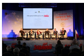
Debata „Walka o pamięć. Dorobek i spuścizna NSZZ Solidarność”. #3