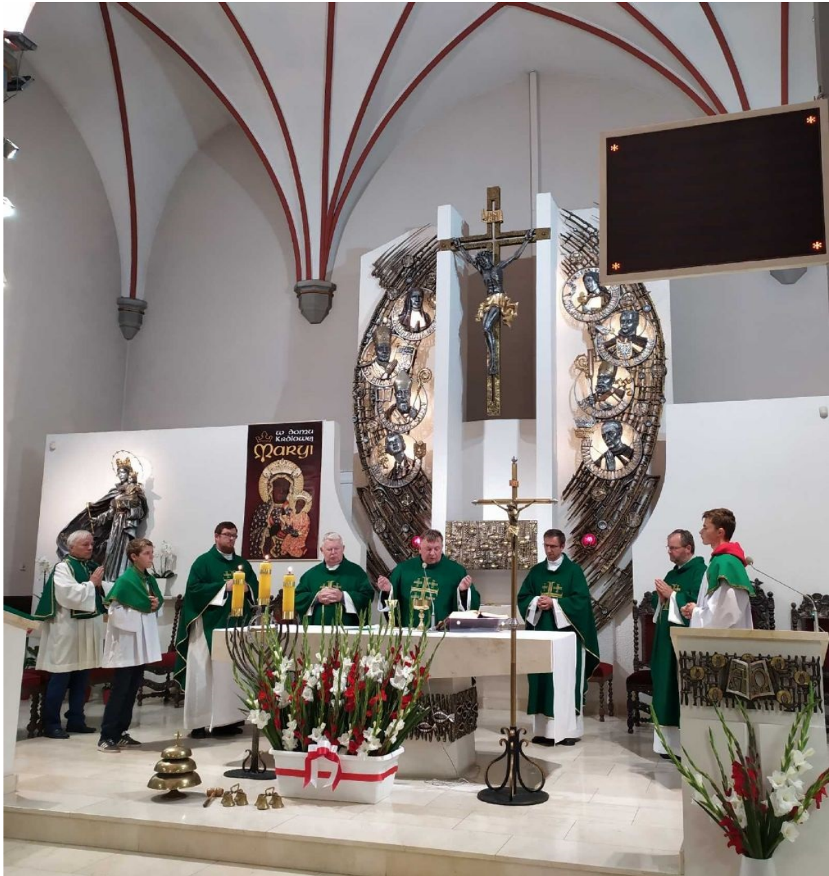
Przed uroczystością na Cmentarzu Garnizonowym odbyła się premiera wystawy IPN „Danuta Siedzikówna «Inka»” autorstwa Artura Chomicza.