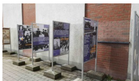
Panele wystawy „Sąsiedzka krew” #3