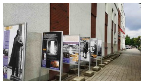
Panele wystawy „Sąsiedzka krew” #2