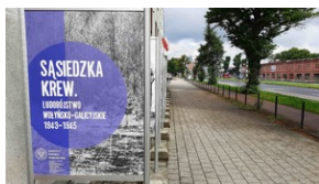
Panele wystawy „Sąsiedzka krew” #1

prezentacja wystawy elementarnej „Sąsiedzka krew. Ludobójstwo wołyńsko-galicyskie 1943-1945” (al. Grunwaldzka 216 - przed siedzibą Oddziału IPN w Gdańsku)