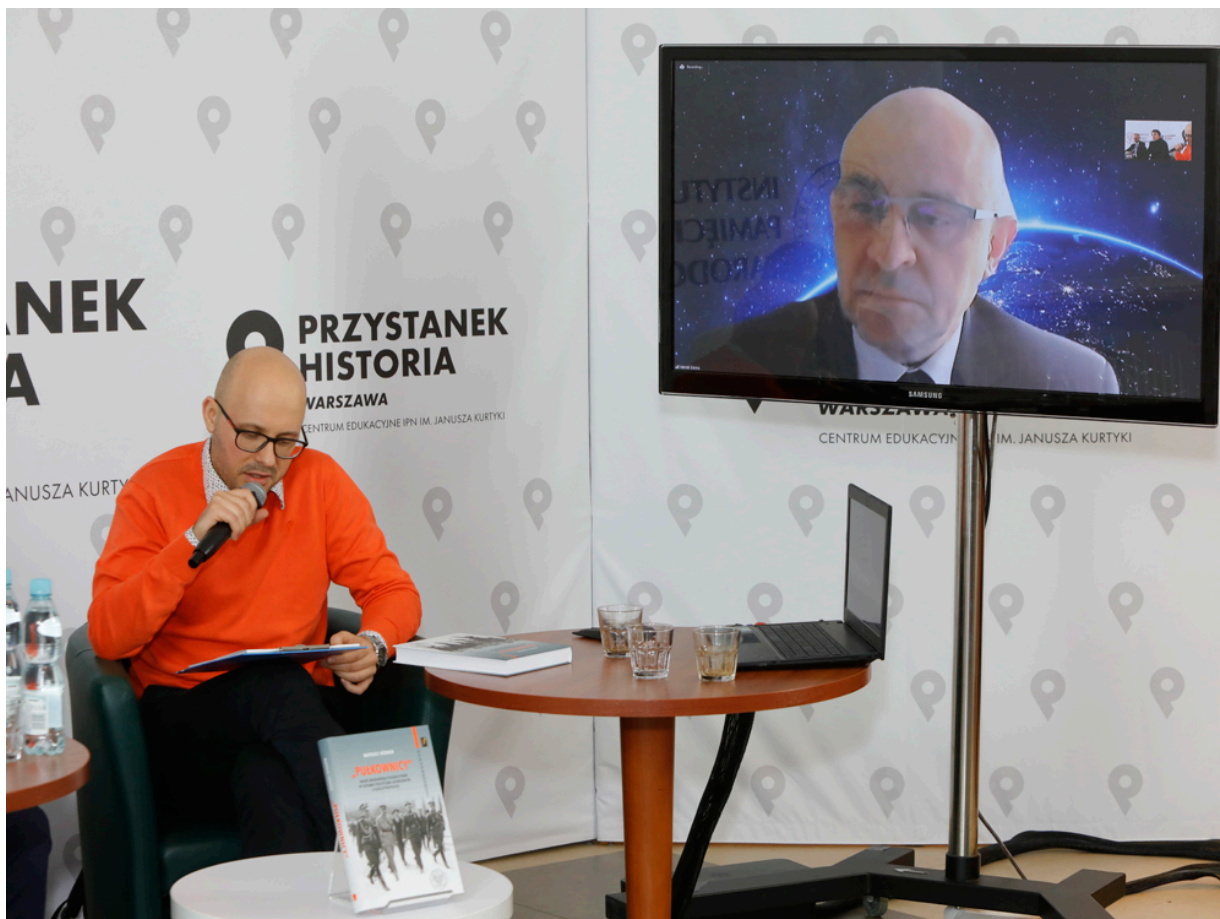
Dyskusja o książce „»Pułkownicy«. Rdzeń środowiska piłsudczyków w systemie polityczno-ustrojowym II Rzeczypospolitej” – 19 maja 2021.