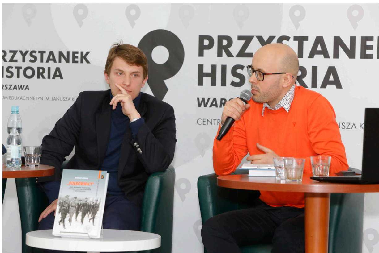
Dyskusja o książce „»Pułkownicy«. Rdzień środowiska piłsudczyków w systemie polityczno-ustrojowym II Rzeczypospolitej” - 19 maja 2021.