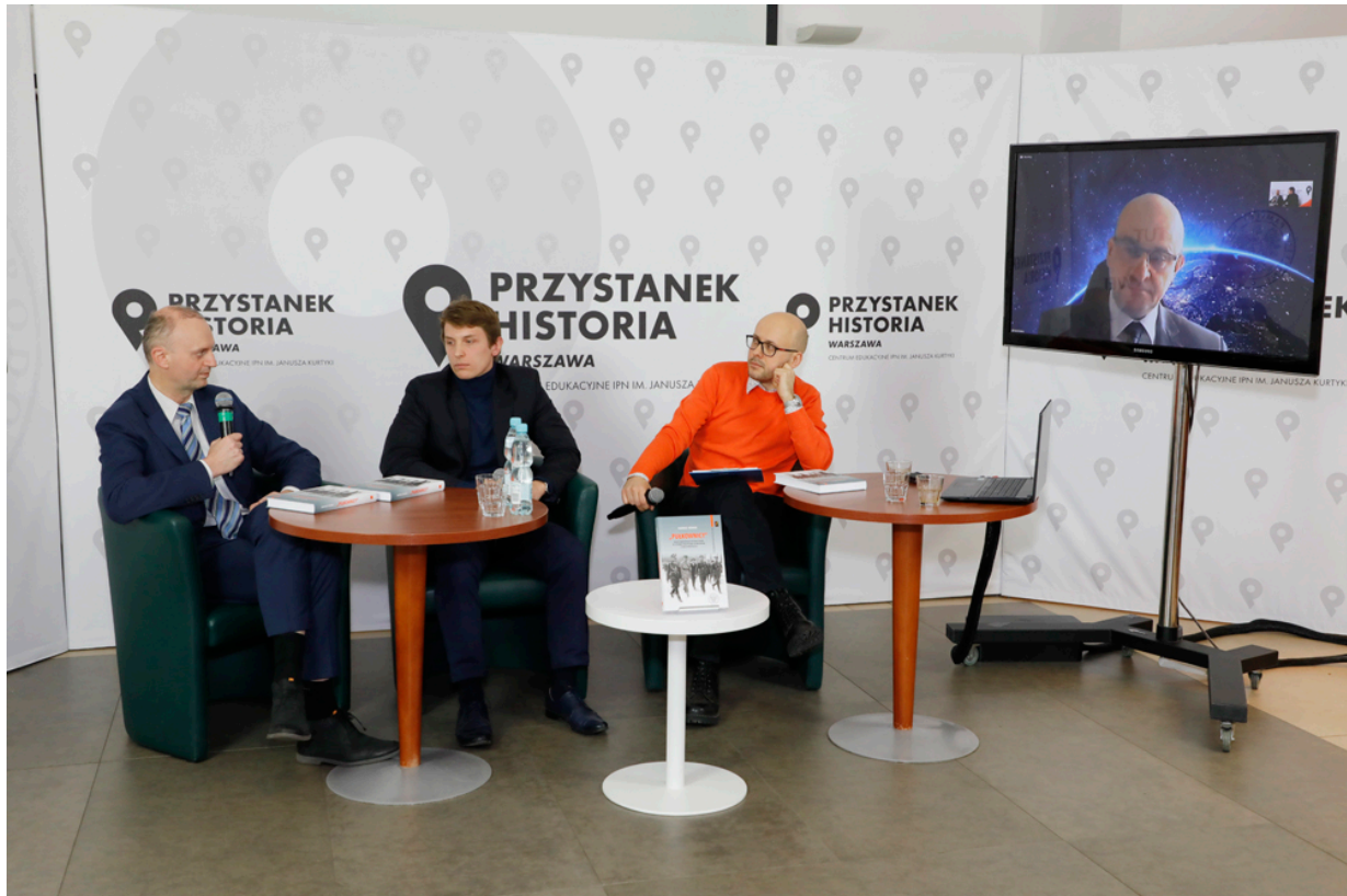
Dyskusja o książce „»Pułkownicy«. Rdzeń środowiska piłsudczyków w systemie polityczno-ustrojowym II Rzeczypospolitej” - 19 maja 2021.