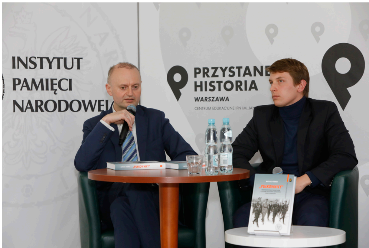
Dyskusja o książce „»Pułkownicy«. Rdzeń środowiska piłsudczyków w systemie polityczno-ustrojowym II Rzeczypospolitej” – 19 maja 2021.