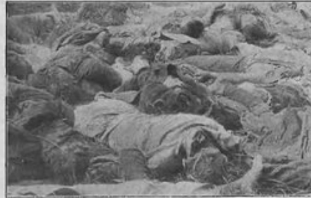
Wzięci do niewoli, rozstrzelani i wyrzuceni samolotami we wsi Lemonia, ziemia łomżyńska pow. łomżyński; 1 oficer 69 p. p., 37 żołnierzy i 5 cywilnych z II-go batalionu Kowieńskiego p. p. dnia 25-go lipca 1920 roku. Pochowani zostali przez ludność m. Kólna.