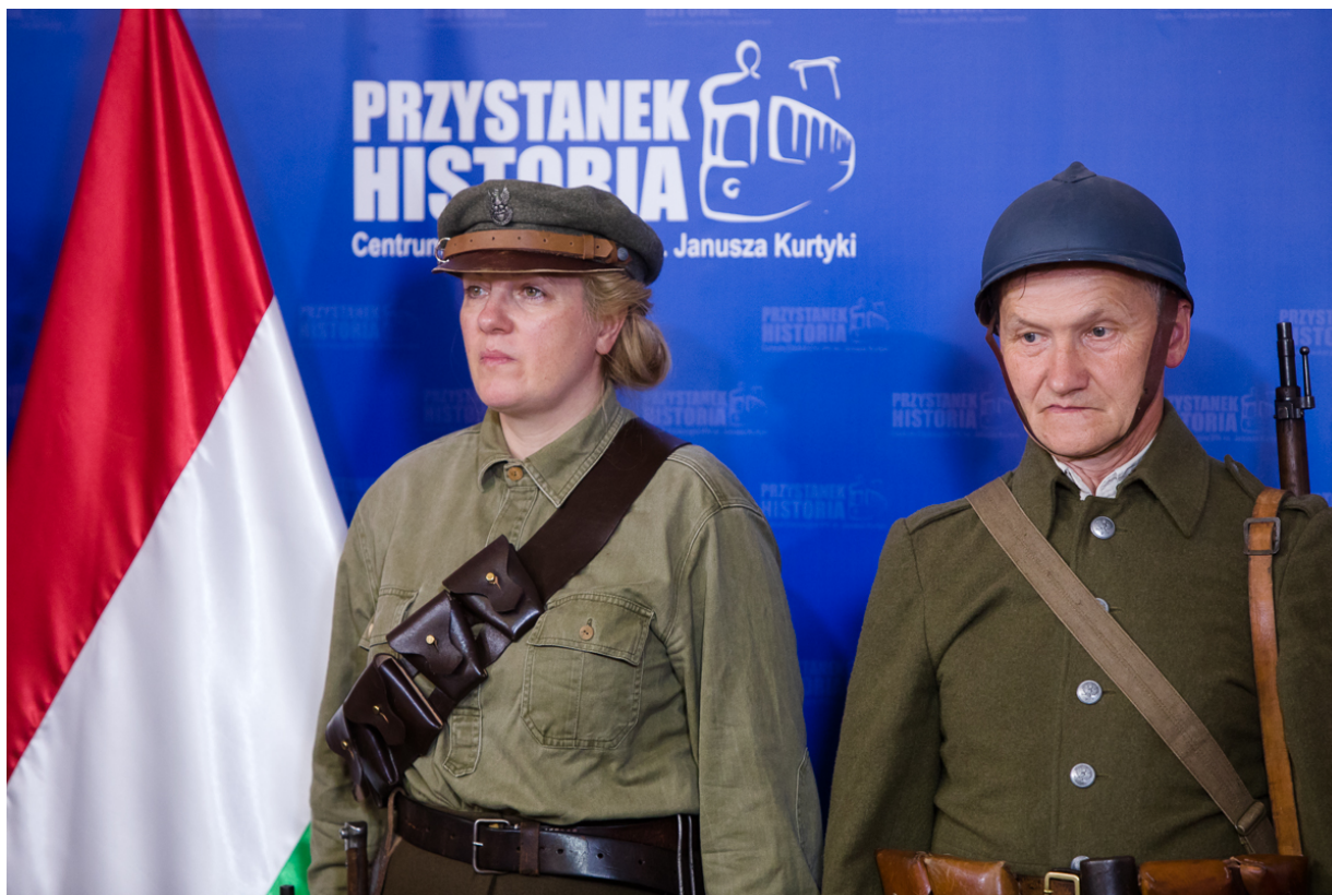
Rekonstruktorzy z Grupy Historycznej „Zgrupowanie Radosław” – 17 czerwca 2020.