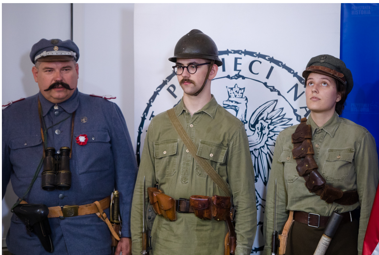
Rekonstruktorzy z Grupy Historycznej „Zgrupowanie Radosław” – 17 czerwca 2020.