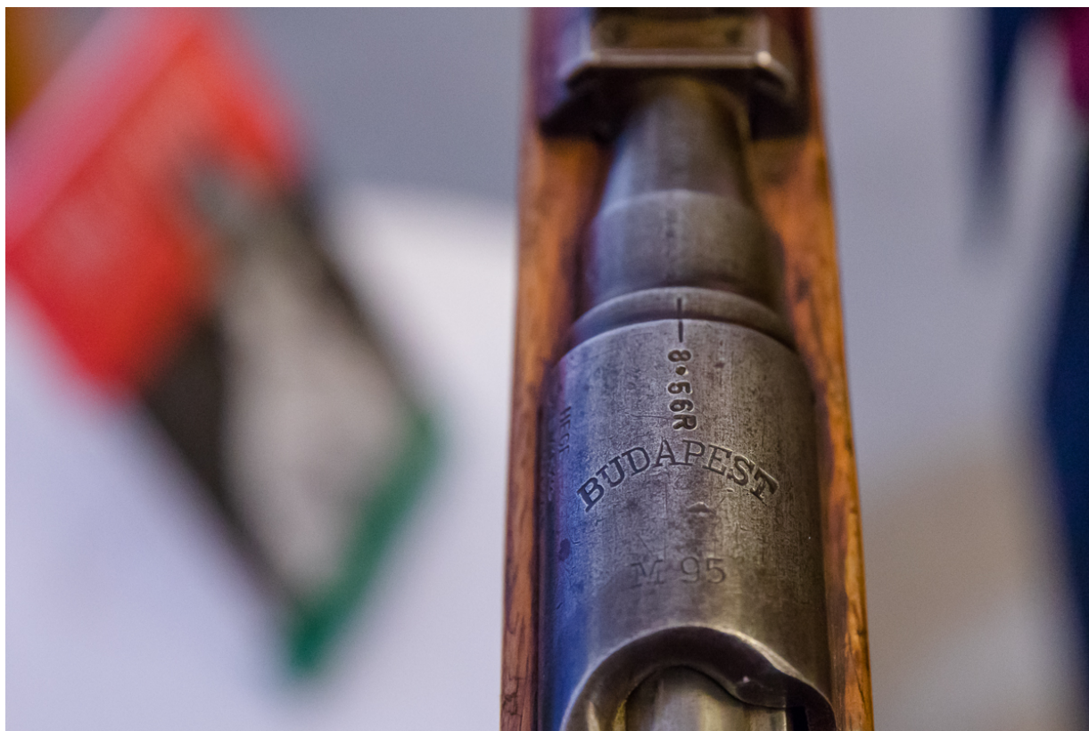
Karabin węgierski z 1920 roku.