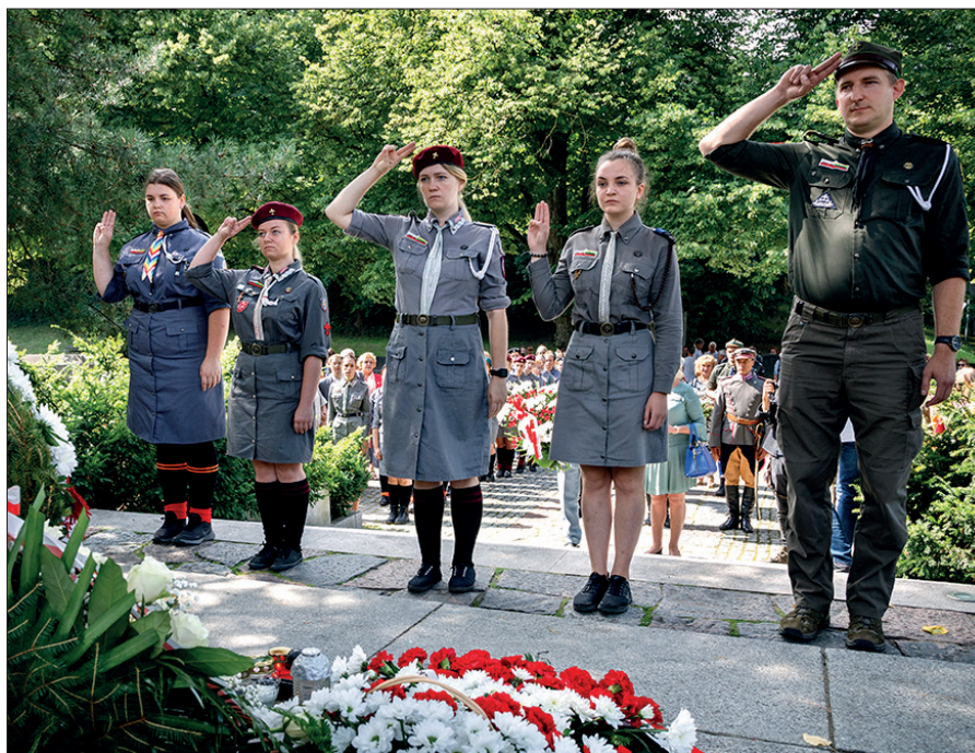
■ Wieńce złożyli litewscy Polacy oraz goście z Polski.