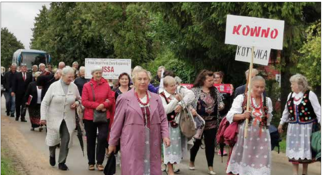
■ Korowód zespołów i uczestników święta