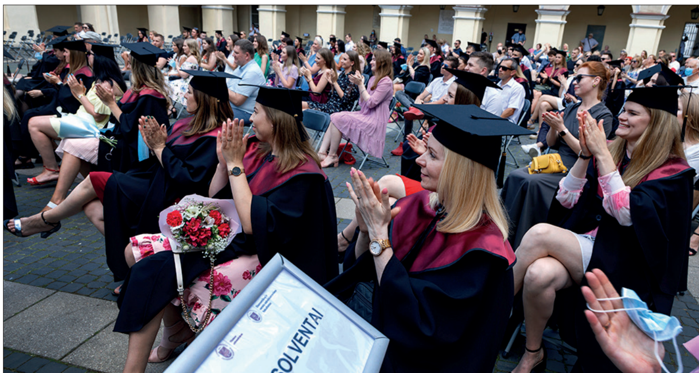
■ Osoby rozpoczynające studia wyższe najczęściej wybierają nauki o zdrowiu (19 proc.)