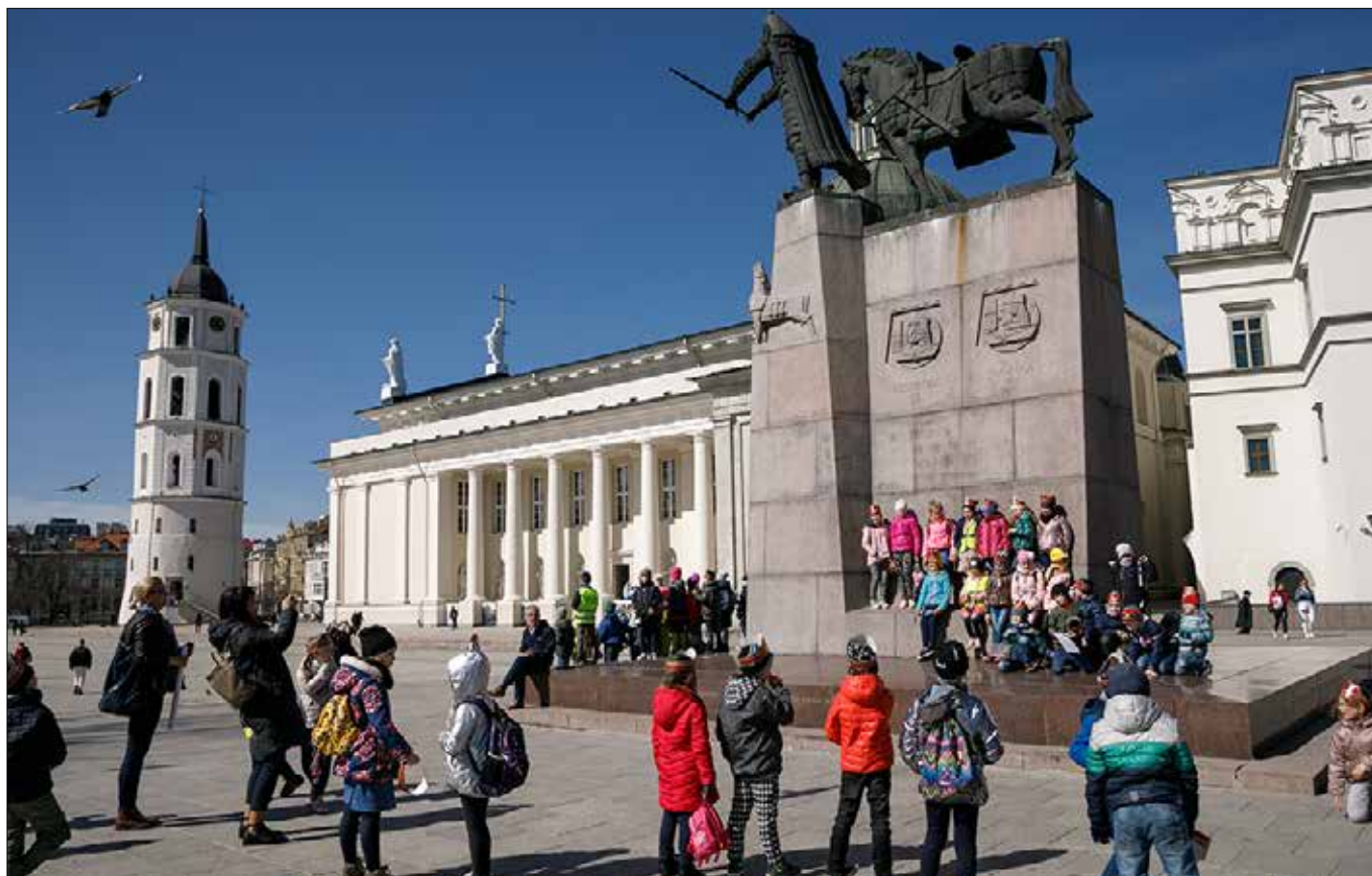
Wilno przypomina o Rzeczypospolitej Obojga Narodów Fot. Marian Paluszkiewicz