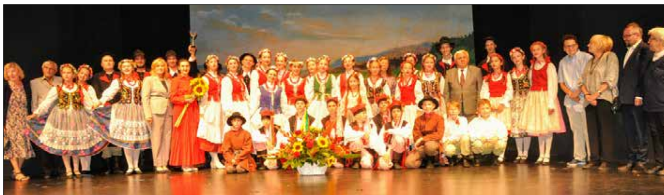
Koncert Wileńszczyzny w Teatrze Miejskim im. W. Gombrowicza został entuzjastycznie przyjęty przez widzów

Godziny pracy: Pn - Pt 10:00 - 18:00; So 10:00 - 16:00