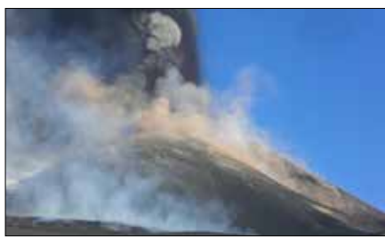
Str. przygotował Witold Janczys

Znajdujący się na Sycylii wulkan Etna, najwyższy w Europie, urósł o 37 metrów. To rezultat zanotowanych w tym roku około 50 epizodów jego dużej aktywności, w trakcie których skumulowała się tam warstwa produktów wybuchu wulkanicznego i lawy. Nagromadzenie się tego materiału na stożku najnowszego krateru południowo-wschodniego doprowadziło do tego, że wyraźnie zmienił się kształt wulkanu. To w rejonie tego krateru skoncentrowała się zwiększona i bardzo spektakularna aktywność Etny, notowana od 16 lutego. W jej efekcie wysokość wulkanu wzrosła do 3357 metrów.