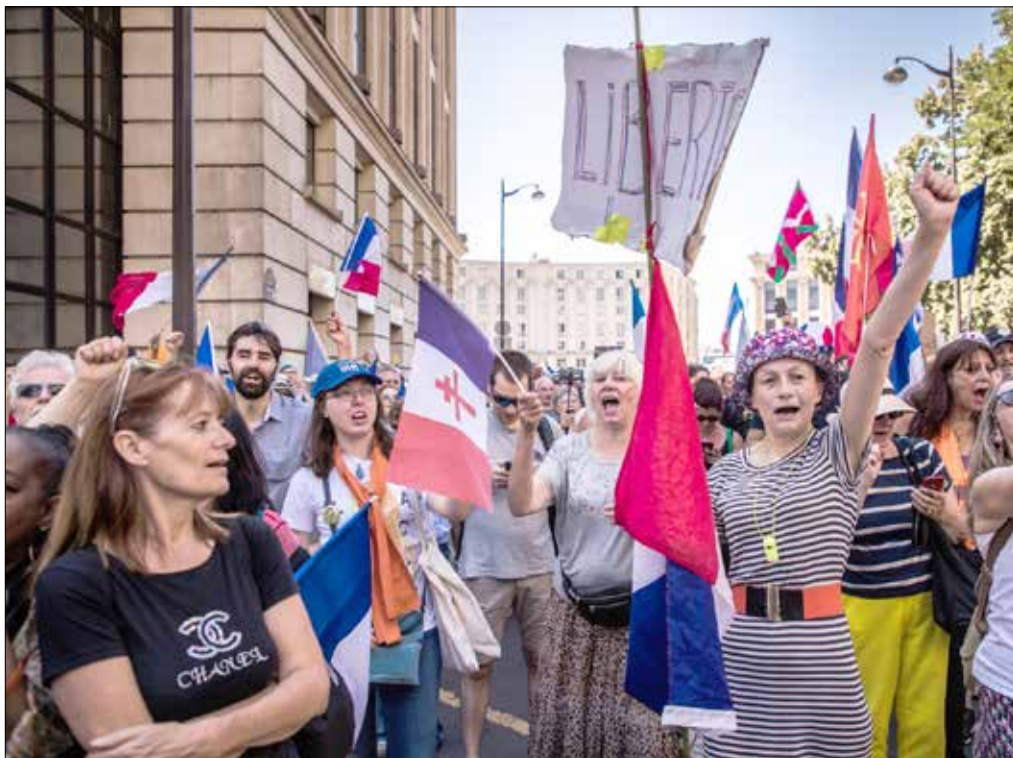
We Francji trwają demonstracje przeciwko ograniczeniom związanym z COVID-19