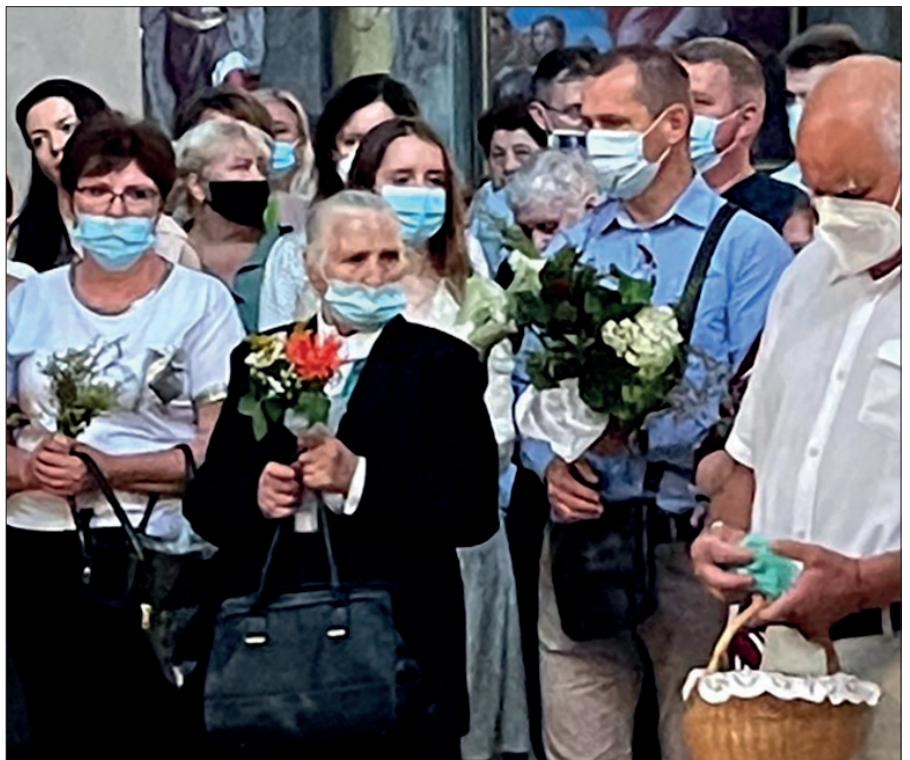
■ 15 sierpnia Kościół katolicki obchodzi Wniebowzięcie Najświętszej Maryi Panny