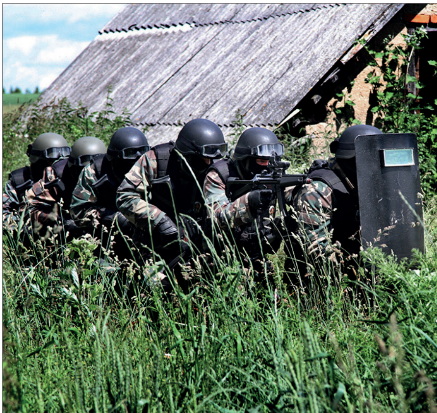
■ Pograniczników wspomagają żołnierze Wojska Litewskiego

Litwa otrzymuje pomoc również ze strony struktur unijnych. W ubiegłym tygodniu Komisja Europejska podjęła decyzję o przeznaczeniu 36,7 mln euro na wsparcie dla Litwy w walce z kryzysem migracyjnym. Środki mają być przekazane na opiekę medyczną, szczepionki, żywność, odzież oraz zestawy higieniczne dla migrantów. Co prawda Komisja Europejska oświadczyła, że chociaż popiera budowę płotu na granicy litewsko-białoruskiej, to raczej dodatkowych środków finansowych na ten projekt nie przeznaczy. Płot ma wynosić 508 kilometrów, jego koszty są szacowane na 152 mln euro. Litwa jest jednak zdeterminowana do budowy, która zostanie sfinansowana ze środków pochodzących z budżetu państwa. „Konieczne jest zbudowanie silnej i bezpiecznej granicy z Białorusią i to jak najszybciej” – oświadczyła Bilotaitė. Ogrodzenie graniczne ma się składać z dwóch elementów. Pierwszym będą zasieki typu concertina ułożone w trzech poziomach w formie piramidy. Drugim elementem będzie metalowy, czterometrowy płot w kształcie litery Y, na górze którego również zostanie zamontowana concertina. Część ogrodzenia