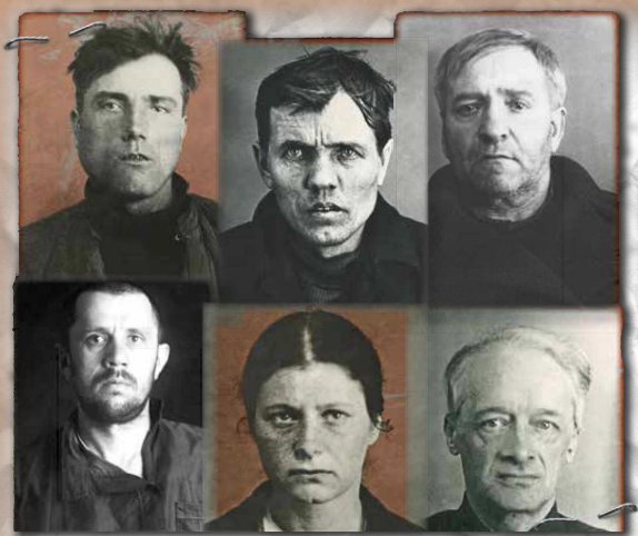
Na zdjęciu Polacy, ofiary sowieckiego ludobójstwa.