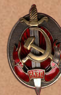
Odznaka i czapka funkcjonariusza NKWD

JEŻOWSZCZYZNA – potoczne określenie okresu „Wielkiego Terroru”, utworzone od nazwiska szefa NKWD Nikołaja Jeżowa (Stalin oraz władze sowieckie chciały przypisać odpowiedzialność za zbrodnie tylko i wyłącznie Jeżowowi).