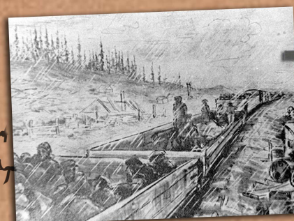
Transport więźniów na odkrytych platformach kolejowych, rysunek nieznanego łagiennika.