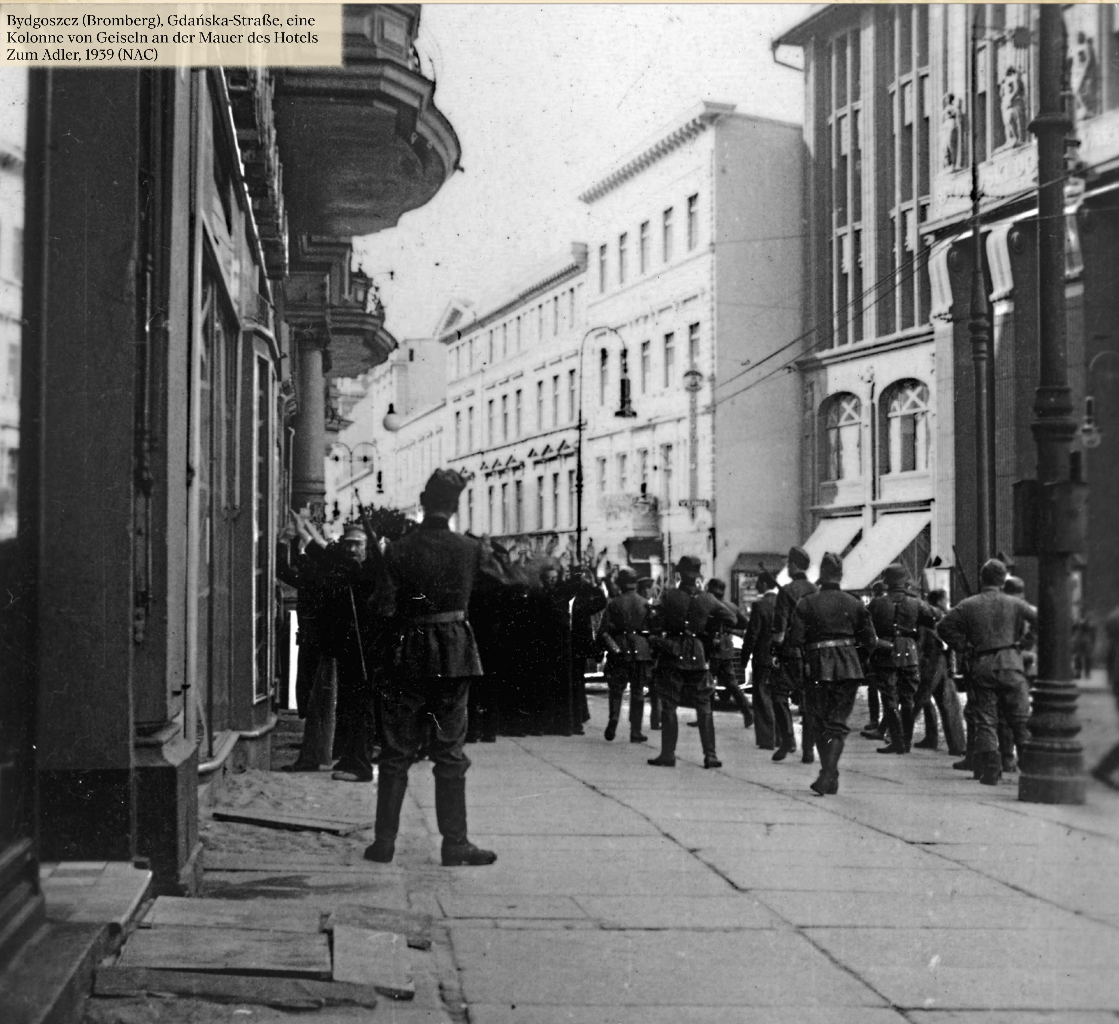
Bydgoszcz (Bromberg), Gdańska-Straße, eine Kolonne von Geiseln an der Mauer des Hotels Zum Adler, 1939