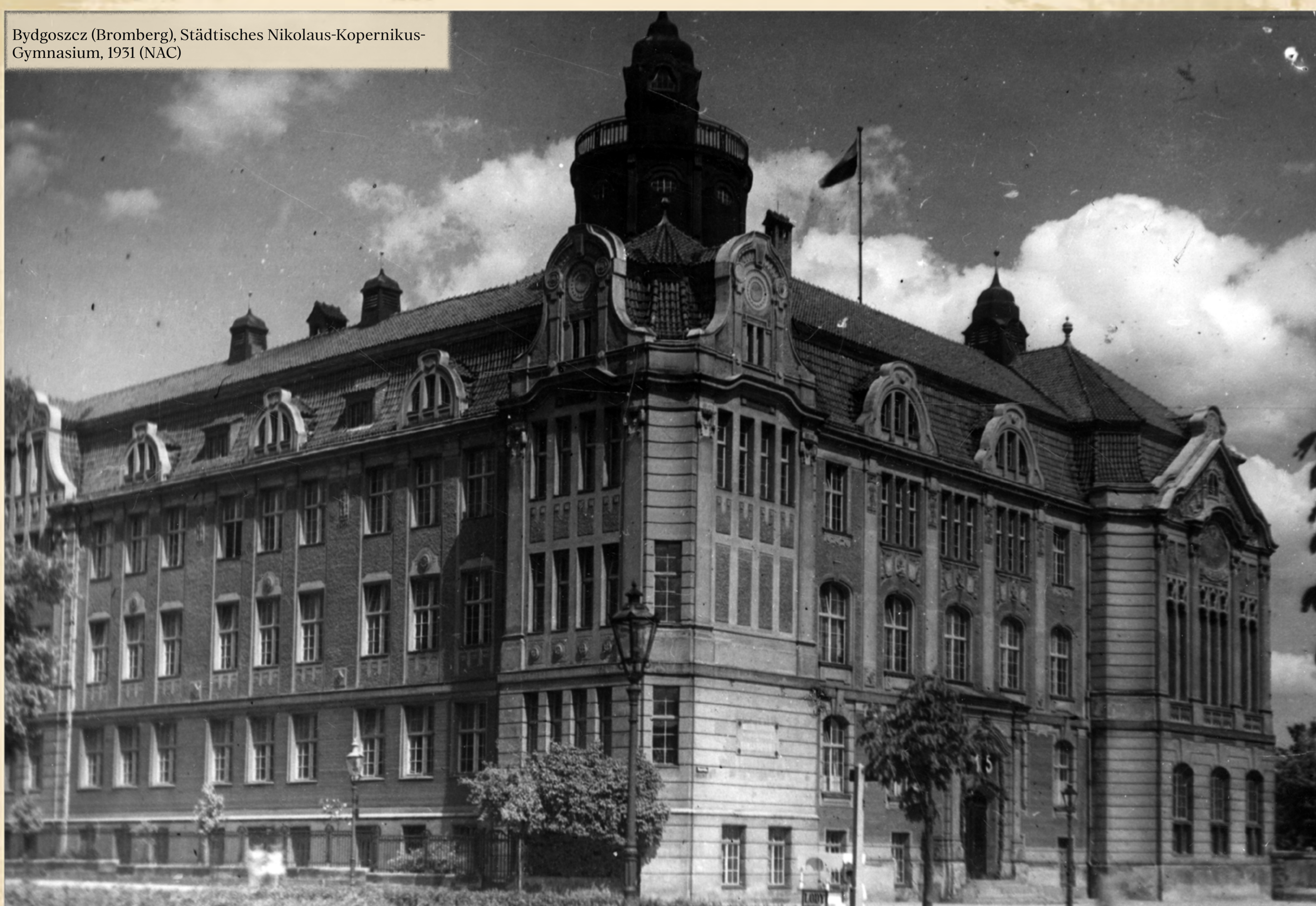
Bydgoszcz (Bromberg), Städtisches Nikolaus-Kopernikus-Gymnasium, 1931