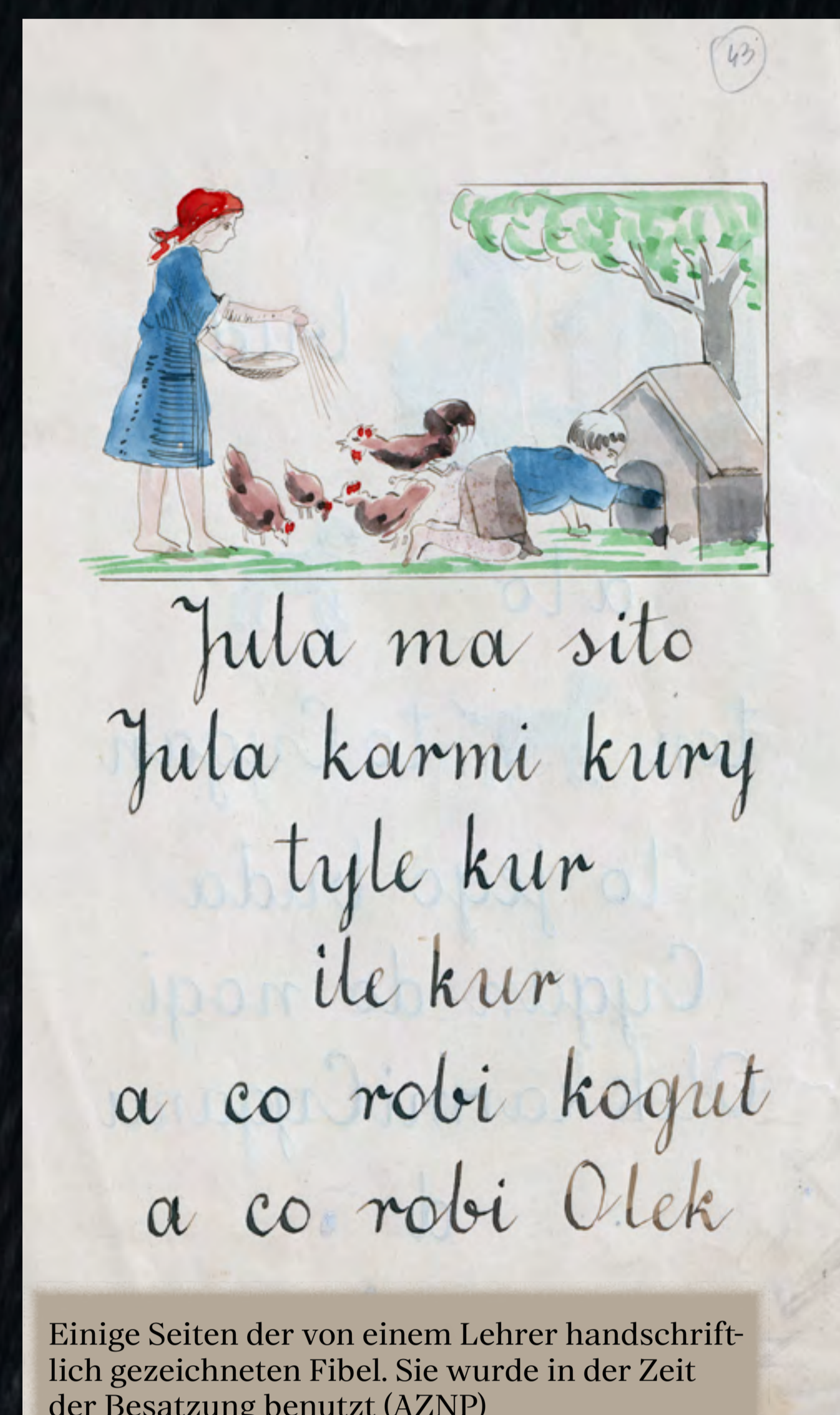
Einige Seiten der von einem Lehrer handschriftlich gezeichneten Fibel. Sie wurde in der Zeit der Besatzung benutzt