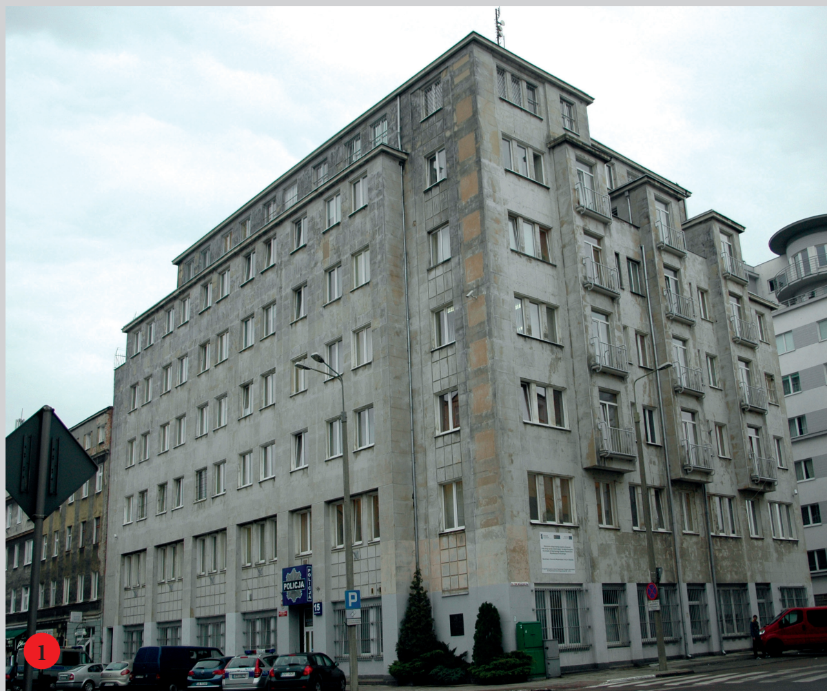
1 Budynek przy ul. Portowej 13/15. Widok współczesny