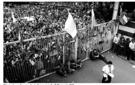
Stoczniowcy bronią się przed wrota Stoczni 800

Pracownicy fabryki nie byli świadkami, a uczestnikami wydarzeń. Ich wiedza o Sierpniu 1980 roku była fragmentaryczna i niepełna. Wiele z nich nie było świadkami wydarzeń, a jedynie słyszało o nich z ust innych ludzi. Wiele z nich nie było świadkami wydarzeń, a jedynie słyszało o nich z ust innych ludzi. Wiele z nich nie było świadkami wydarzeń, a jedynie słyszało o nich z ust innych ludzi.