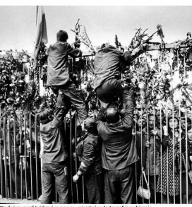
Strajkujący mogli być szczyt na pomniku – metalowcy dotarli do podziemia