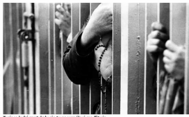
Typowe ludzkie spojrzenie na niepokojące wydarzenia