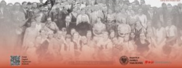
Public trials were held in various places. They would spend nights in bunkers and in the morning they would go to work. They would spend nights in bunkers and in the morning they would go to work.