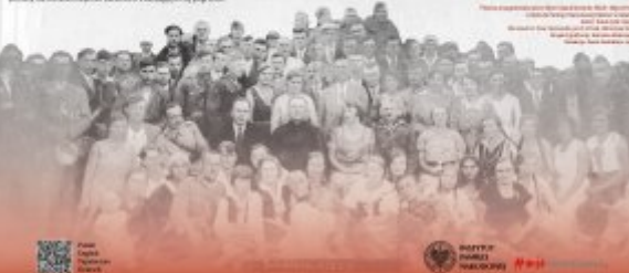
W ramach "Akcji Wschód" w 1942 roku w miejscowości Jędrzejów w powiecie jędrzejowskim (dzisiejszy powiat Jędrzejowski) w województwie świętokrzyskim, w ramach akcji "Kamień" (ang. Operation Stone) doszło do masowego wymordowania Polaków w ramach "Akcji Wschód". W tym celu Niemcy, wspierani przez lokalnych Polaków, przetransportowali Polaków do obozów w Łodzi i Węgrzech.