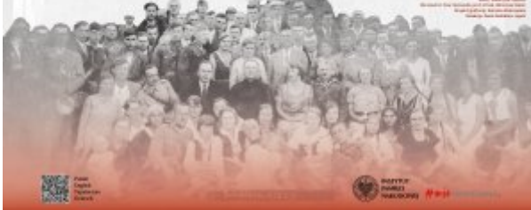
W ramach akcji "Kampania na południowo-wschodnich ziemiach II Rzeczypospolitej" Polacy wywieźli do Niemiec i Włoch 100 tysięcy Polaków, Żydów i Romów.

Polacy zostali wywiezieni do Niemiec i Włoch w ramach akcji "Kampania na południowo-wschodnich ziemiach II Rzeczypospolitej". Polacy zostali wywiezieni do Niemiec i Włoch w ramach akcji "Kampania na południowo-wschodnich ziemiach II Rzeczypospolitej". Polacy zostali wywiezieni do Niemiec i Włoch w ramach akcji "Kampania na południowo-wschodnich ziemiach II Rzeczypospolitej".