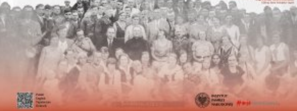
Public trials were held in various places. They would spend nights in bunkers and in the morning they would go to work. They would spend nights in bunkers and in the morning they would go to work.