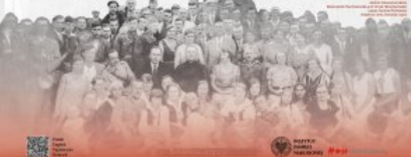
Polen, 1942. Ein Foto von einem Ghettostempel, das die Opfer des Holocausts zeigt.

Die deutsche Besatzungspolitik zielte auf die Vernichtung der polnischen Bevölkerung ab. In den südlich-östlichen Gebieten wurde die Bevölkerung in Ghettos und Vernichtungslagern konzentriert. Die Ghettos wurden durch Hunger, Krankheiten und Verhaftungen zerstört. Die Vernichtungslager waren Orte, an denen die polnische Bevölkerung ermordet wurde. Die deutsche Besatzungspolitik zielte auf die Vernichtung der polnischen Bevölkerung ab. In den südlich-östlichen Gebieten wurde die Bevölkerung in Ghettos und Vernichtungslagern konzentriert. Die Ghettos wurden durch Hunger, Krankheiten und Verhaftungen zerstört. Die Vernichtungslager waren Orte, an denen die polnische Bevölkerung ermordet wurde.