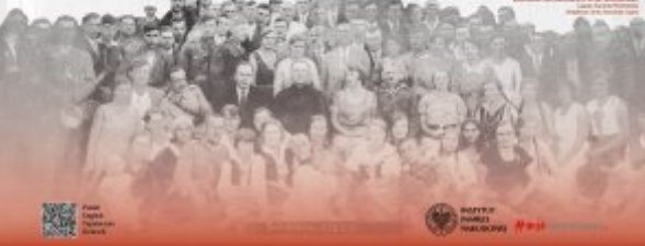
Polen, 1942. Ein Foto von einem Ghettostempel, das die Opfer des Holocausts zeigt.

Die deutsche Besatzungspolitik zielte auf die Vernichtung der polnischen Bevölkerung ab. In den südlich-östlichen Gebieten wurde die Bevölkerung in Ghettos und Vernichtungslagern konzentriert. Die Ghettos wurden durch Hunger, Krankheiten und Verhaftungen zerstört. Die Vernichtungslager waren Orte, an denen die polnische Bevölkerung ermordet wurde. Die deutsche Besatzungspolitik zielte auf die Vernichtung der polnischen Bevölkerung ab. In den südlich-östlichen Gebieten wurde die Bevölkerung in Ghettos und Vernichtungslagern konzentriert. Die Ghettos wurden durch Hunger, Krankheiten und Verhaftungen zerstört. Die Vernichtungslager waren Orte, an denen die polnische Bevölkerung ermordet wurde.