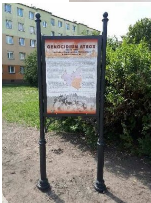
Tablica „Genocidium Atrax” w Grudziądzu