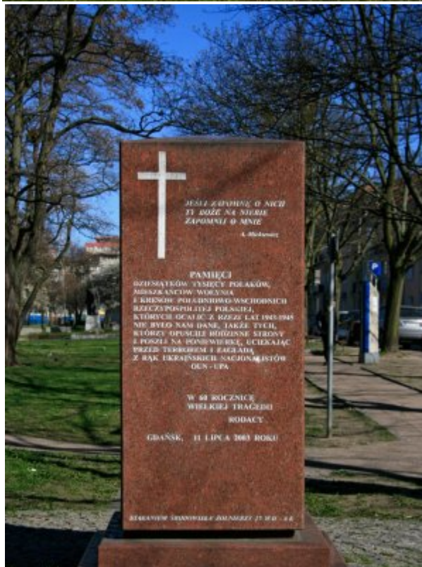
Pomnik Wołyński w Gdańsku