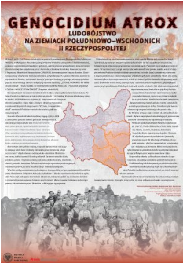
Tablica przygotowana przez IPN Oddział w Gdańsku