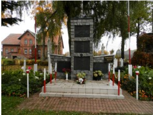
Pomnik w Zielonca Pasłęckiej