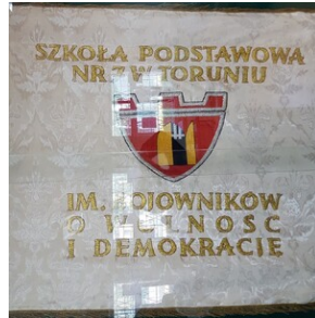
Poprzedni sztandar szkoły