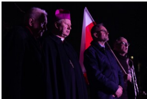
84. rocznica „krwawego” Wielkiego Piątku - Gdańsk, 22 marca 2024, fot. Roman Jocher