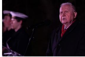
84. rocznica „krwawego” Wielkiego Piątku - Gdańsk, 22 marca 2024