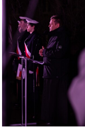
84. rocznica „krwawego” Wielkiego Piątku - Gdańsk, 22 marca 2024