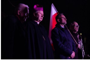
84. rocznica „krwawego” Wielkiego Piątku - Gdańsk, 22 marca 2024