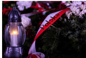
84. rocznica „krwawego” Wielkiego Piątku - Gdańsk, 22 marca 2024, fot. Roman Jocher