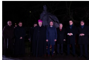
84. rocznica „krwawego” Wielkiego Piątku - Gdańsk, 22 marca 2024