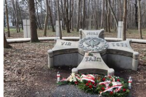
Otwarcie wystawy „Wartownia nr 5” - Gdańsk, 14 marca 2024