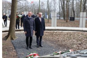
Otwarcie wystawy „Wartownia nr 5” - Gdańsk, 14 marca 2024