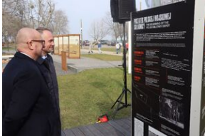
Otwarcie wystawy „Wartownia nr 5” - Gdańsk, 14 marca 2024