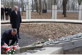
Otwarcie wystawy „Wartownia nr 5” - Gdańsk, 14 marca 2024