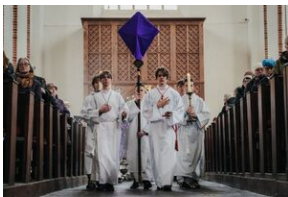
ANTIDOTUM - rzecz o księdzu Blachnickim - Gdańsk, 22-23 marca 2024