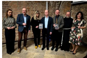
ANTIDOTUM - rzecz o księdzu Blachnickim - Gdańsk, 22-23 marca 2024