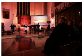
ANTIDOTUM - rzecz o księdzu Blachnickim - Gdańsk, 22-23 marca 2024