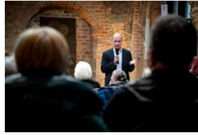
ANTIDOTUM - rzecz o księdzu Blachnickim - Gdańsk, 22-23 marca 2024, fot. Maja Studzińska