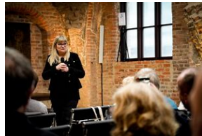
ANTIDOTUM - rzecz o księdzu Blachnickim - Gdańsk, 22-23 marca 2024