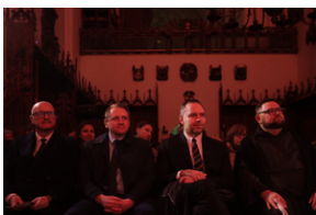
ANTIDOTUM - rzecz o księdzu Blachnickim - Gdańsk, 22-23 marca 2024

Prezes IPN dodał, że Instytut Pamięci Narodowej jest od tego, aby mówić, niezależnie od zmieniających się okoliczności, o prawdzie o historii narodu i państwa polskiego w XX wieku.