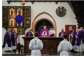
ANTIDOTUM - rzecz o księdzu Blachnickim - Gdańsk, 22-23 marca 2024