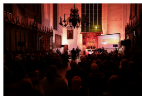
ANTIDOTUM - rzecz o księdzu Blachnickim - Gdańsk, 22-23 marca 2024