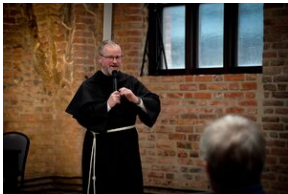
ANTIDOTUM - rzecz o księdzu Blachnickim - Gdańsk, 22-23 marca 2024