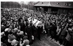
Pogrzeb Lecha Bądkowskiego na gdańskim cmentarzu Srebrzysko, 28 lutego 1984, fot. S. Skiačanowski, zbiory Archiwum IPN.