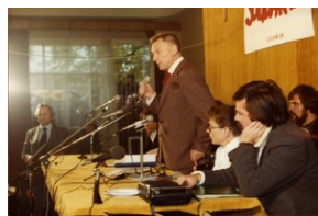
Lech Bądkowski przemawiający podczas jednego z zebrań NSZZ „Solidarność”, zbiory Archiwum IPN.