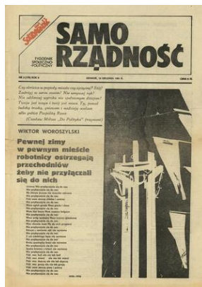
Tytułowa strona „Samorządności”, nr 3 z 14 grudnia 1981 r., zbiory OA IPN w Gdańsku.