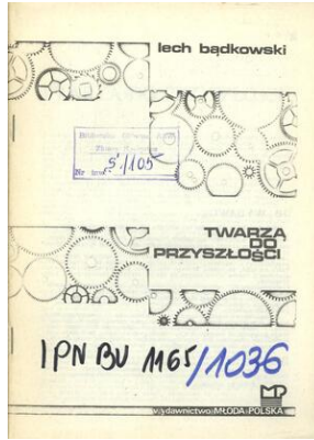
Okradka wydane w drugim obiegu eseju Lecha Bądkowskiego pt. 'Twarz do przyszłości'