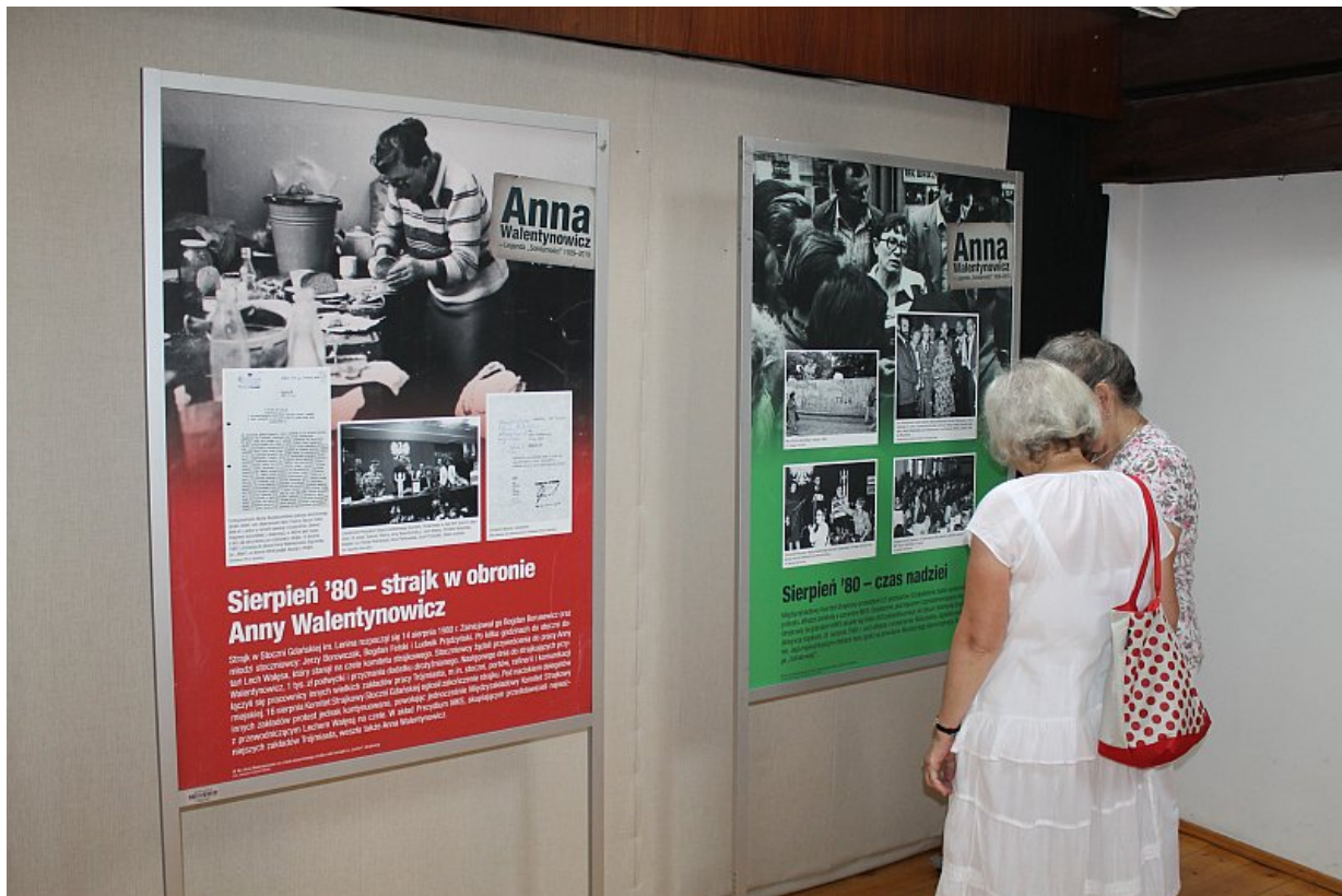
Miejsce: Miejska Biblioteka Publiczna w Tczewie.