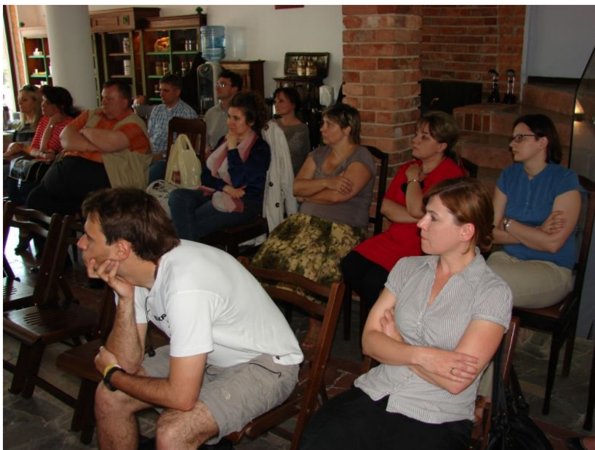
W warsztatach wzięło udział 23 nauczycieli historii