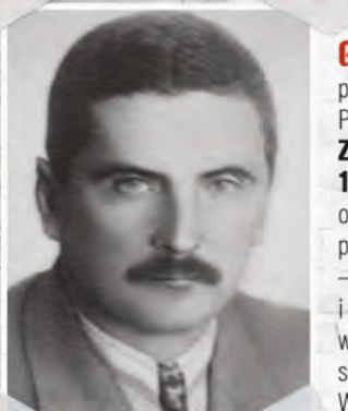
Fot. Lech Wyszczelski, General Kazimierz Sosnkowski, Warszawa 2010, (domena publiczna)

ps. „Godziemba”, „Józef” (1885–1969) z inicjatywy Józefa Piłsudskiego założyciel Związku Walki Czynnej pod zaborem austriackim, szef Sztabu I Brygady Legionów Polskich, minister spraw wojskowych, komendant główny Związku Walki Zbrojnej od 13 listopada 1939 r. do 30 czerwca 1940 r. Naczelny Wódz Polskich Sił Zbrojnych (1943–1944). Emigrował do Kanady w 1944 r. Do kraju nigdy nie powrócił.