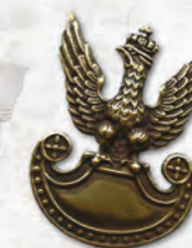
Zaprzyśiężenie AK