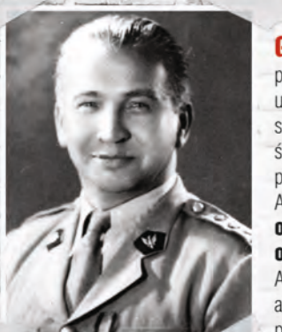
Fot. Tadeusz „Bór” Komorowski, Armia podziemna, Warszawa 1989, (domena publiczna)

ps. „Bór” (1895–1966) – uczestnik wojny z bolszewikami, komendant główny Armii Krajowej od lipca 1943 r. do 2 października 1944 r. Wydał rozkaz o rozpoczęciu akcji „Burza”, a 31 lipca 1944 r. o wybuchu Powstania Warszawskiego. 2 października 1944 r. podpisał akt kapitulacyjny kończący powstanie. Trafił do niemieckiej niewoli. W latach 1947–1949 prezes Rady Ministrów Rządu RP na Uchodźstwie. Osiadł na stałe w Wielkiej Brytanii.