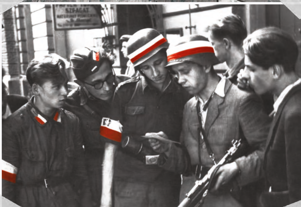
Oddział AK czyta ulotkę podczas Powstania Warszawskiego.

Armia Krajowa to siły zbrojne Polskiego Państwa Podziemnego działającego w czasie II wojny światowej na terenie Rzeczypospolitej Polskiej, podlegające Rządowi RP na uchodźstwie oraz Naczelnemu Wodzowi. Jeszcze w czasie wrześniowych walk w 1939 r. w oblężonej przez Niemców Warszawie powołano organizację kierującą działalnością konspiracyjną – Służbę Zwycięstwu Polski, w listopadzie 1939 r. przemianowaną na Związek Walki Zbrojnej, a następnie 14 lutego 1942 r. na Armię Krajową. ZWZ/AK miał skupiać całość wysiłku zbrojnego polskiego społeczeństwa pod okupacją. Z czasem w skład AK weszły różne organizacje konspiracyjne, które zasilily szeregi podziemnego wojska. Armia Krajowa z założenia była formacją apolityczną i ponadpartyjną, a jej główne zadanie stanowiła walka bieżąca i przygotowanie żołnierzy do powszechnego powstania w momencie załamania się okupacji niemieckiej.