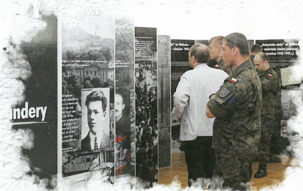
Wystawa IPN dotycząca Zbrodni Wołyńskiej prezentowana w Przystanku Historia

W Przystanku Historia każdy znajdzie coś dla siebie. Będziemy prowadzić tu lekcje i warsztaty dla uczniów, organizować wernisaże, szkolenia dla nauczycieli, pokazy filmów, a także spotkania z badaczami i świadkami historii. Uczestnictwo we wszystkich wydarzeniach organizowanych w Przystanku Historia jest bezpłatne .