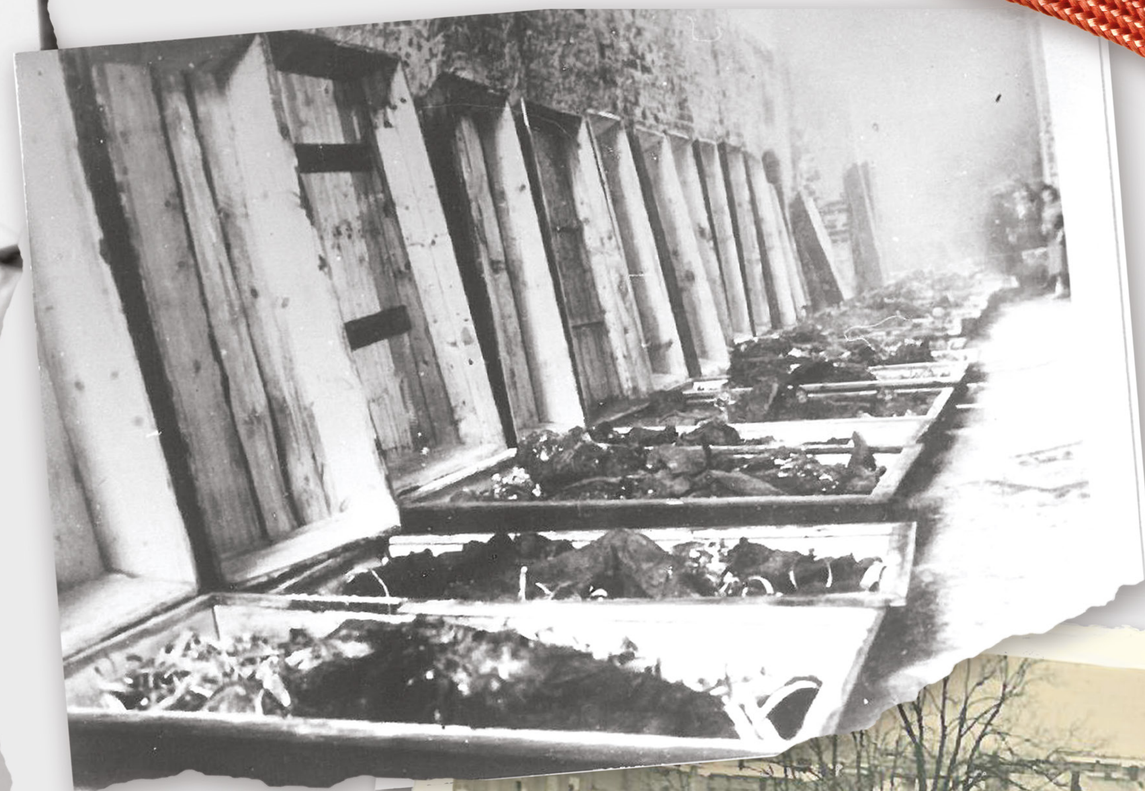
EKSHUMACJA ZWŁOK, 1945 R.