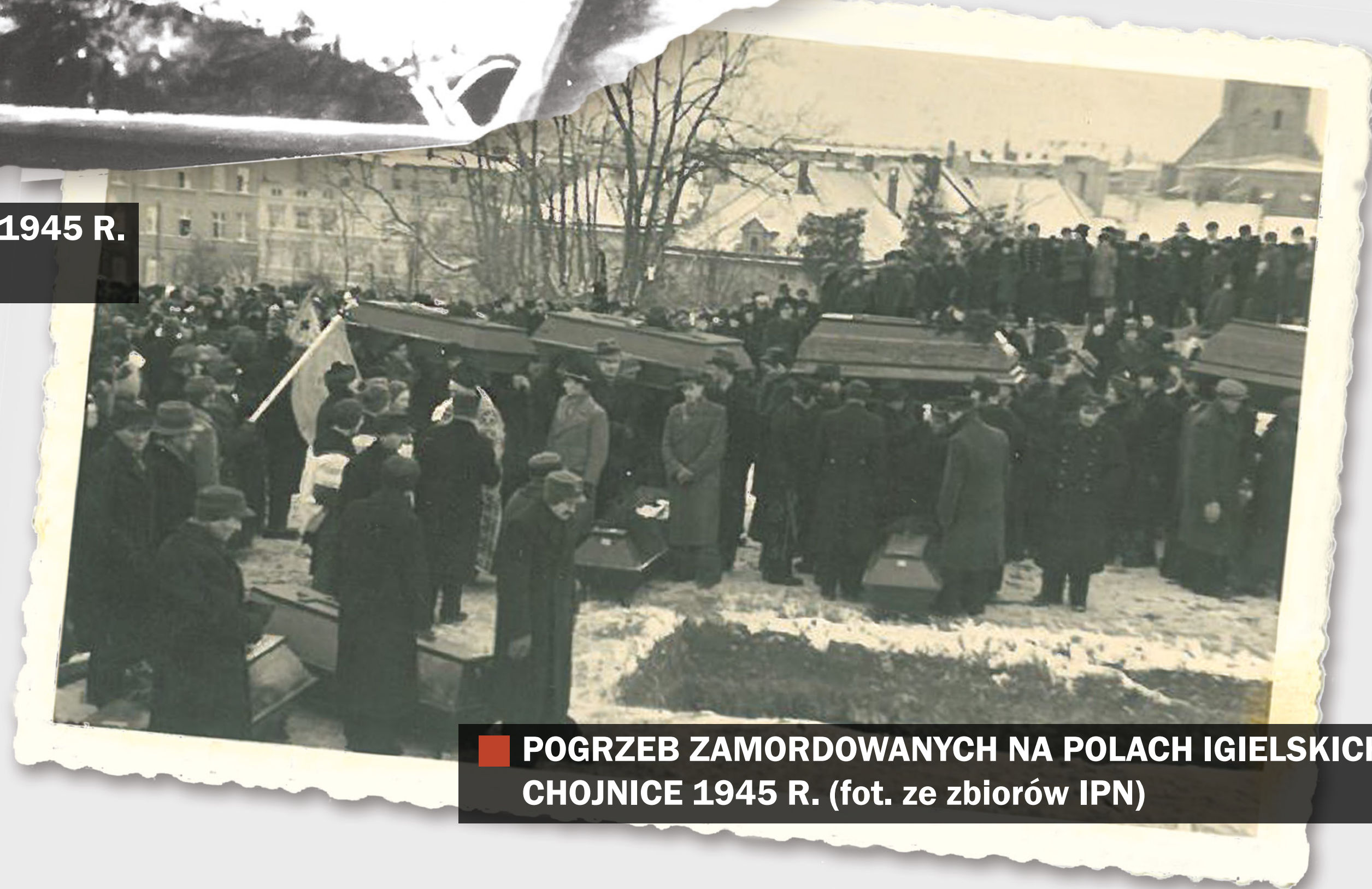
POGRZEB ZAMORDOWANYCH NA POLACH IGIELSKICH, CHOJNICE 1945 R.