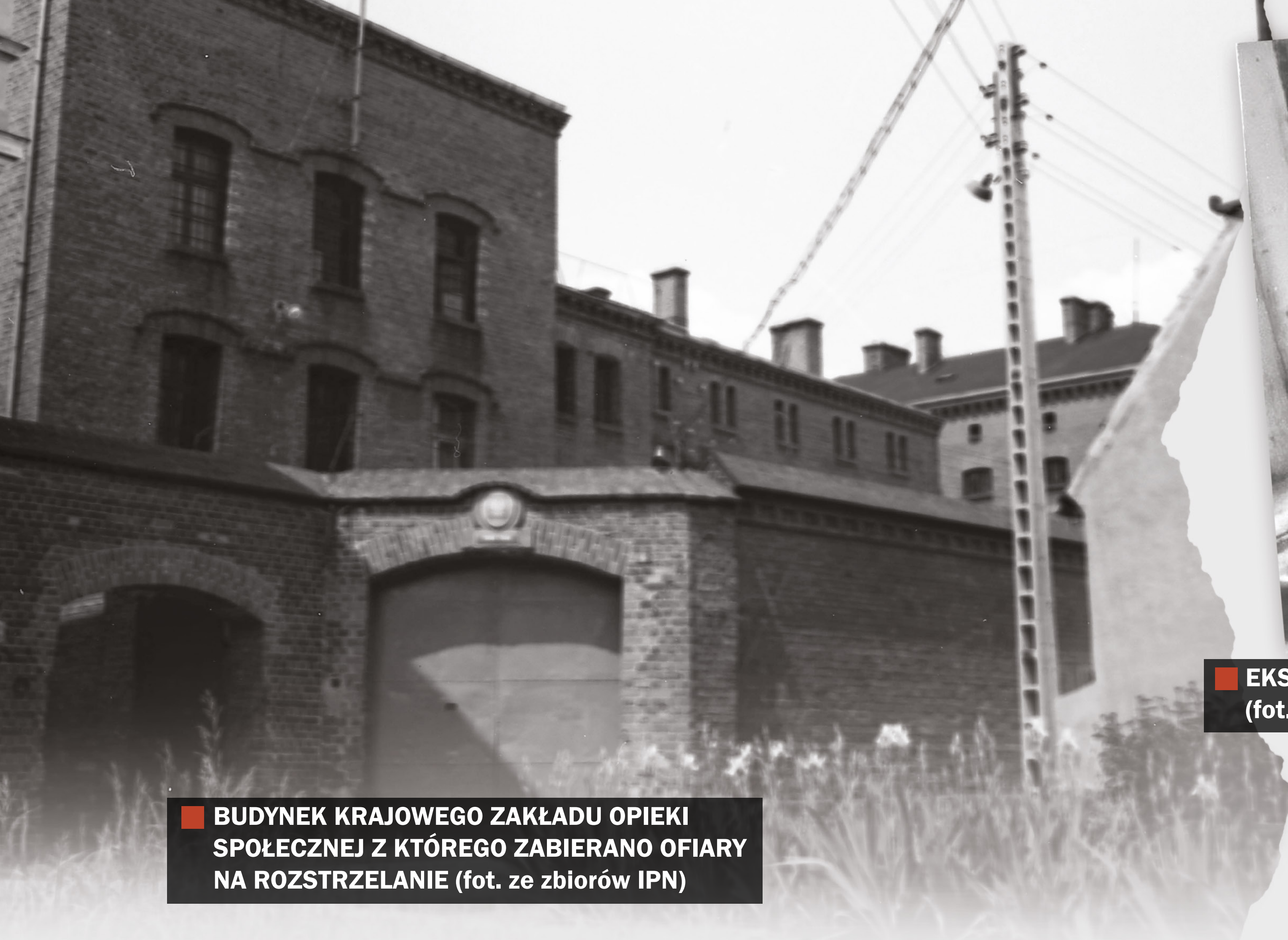
BUDYNEK KRAJOWEGO ZAKŁADU OPIEKI SPOŁECZNEJ Z KTÓREGO ZABIERANO OFIARY NA ROZSTRZELANIE