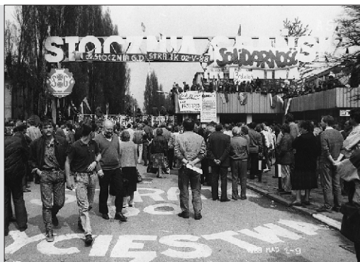
Mieszkańcy Gdańska pod bramą nr 2 solidaryzują się ze strajkującymi stoczniowcami, maj 1988 r.