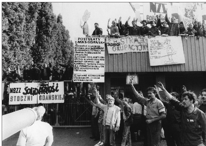
Stefan Kraszewski / zbiory ECS w Gdańsku