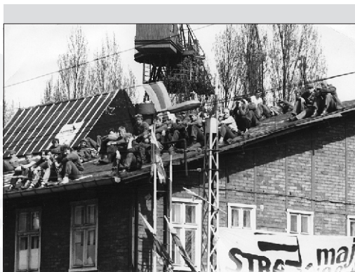
„Strajk dachowy” przy bramie nr 3 i dyskusje w hali produkcyjnej, maj 1988 r.