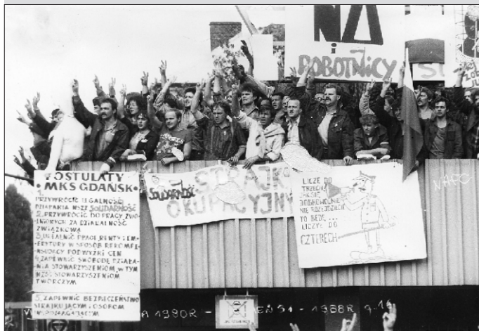
N.N. / zbiory ECS w Gdańsku